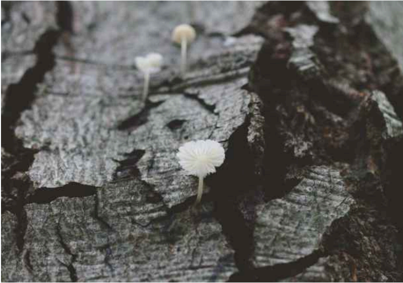
Abb. 4: Mycena olida im NSG Ichterloh.