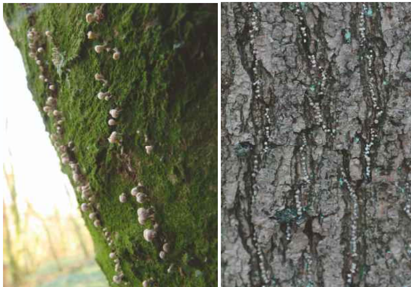
Abb. 1: Phleogena faginea in den Wildnisgebieten Nonnenbach und Keutenbusch.

dann aber erst ins Braune und schließlich ins Schwarze um. Im Alter zerfällt der Kopf und setzt das hellbraune Sporenpulver frei. Der Stiel des Fruchtkörpers ist zylindrisch und weiß bis hell ocker. Auf den hyalinen Basidien (Phragmobasidie) sitzen je vier Sporen; eindeutige Sterigmen sind nicht vorhanden (Abb. 2). Die Sporen sind gelblich braun, dickwandig und kugelig. Sie besitzen eine glatte Oberfläche und sind inamyloid. Gelegentlich bildet die Art Konidiophoren mit breit elliptischen Konidien aus.