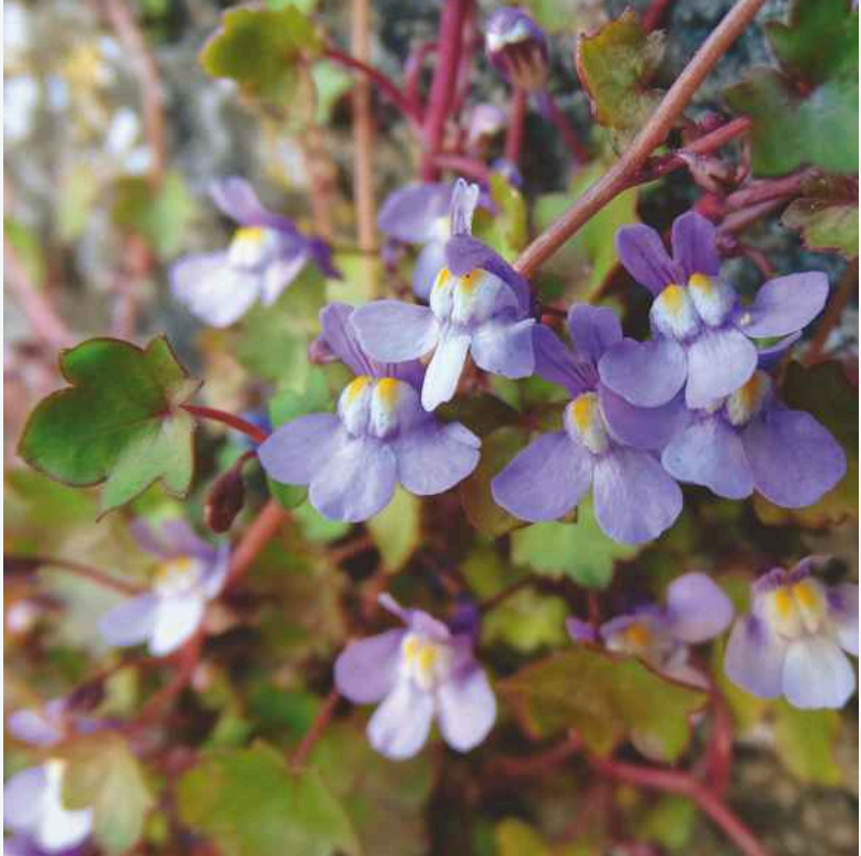
Das Zimbelkraut ( Cymbalaria muralis P.Gaertn., B.Mey. & Scherb.), ein in Westfalen weitverbreiteter Neophyt. (Foto: Bernd Tenbergen, April 2019)