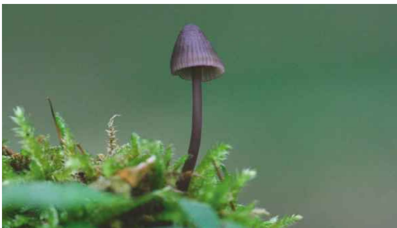
Abb. 3: Mycena purpureofusca im Wildnisgebiet Nonnenbach.

Rote Liste Deutschlands (2016): ungefährdet. Rote Liste NRW (2011): Kategorie „1“ (vom Aussterben bedroht).