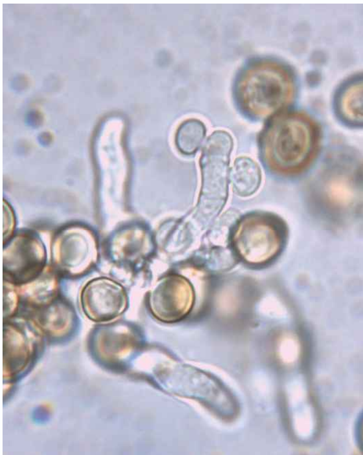
Abb. 2: Phleogena faginea Basidien und Sporen

Weitere Fundstellen liegen im Münsteraner Raum (u.a. Davert-Inkmans Holz), in den Baumbergen, in den Exkursionsgebieten der Pilzgruppe APR (Arbeitsgemeinschaft Pilze Ruhrgebiet), mehrere Funde in Parks in Mönchengladbach, und in der Wahner Heide bei Lohmar/Köln (vgl. Eintragungen in „Pilze-Deutschland“).