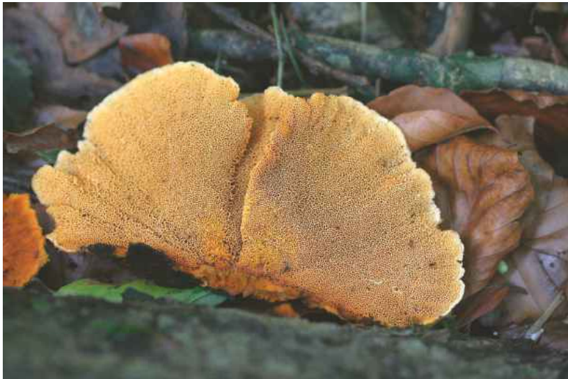
Abb. 6: Pycnoporellus fulgens im NSG Ichterloh.