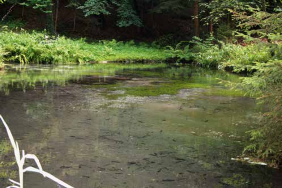
Abb. 2: Großer Quelltopf der Kumberbachquelle im NSG Donoper Teich-Hiddeser Bent bei Detmold, Lebensraum der Alpenplanarie ( Crenobia alpina ).