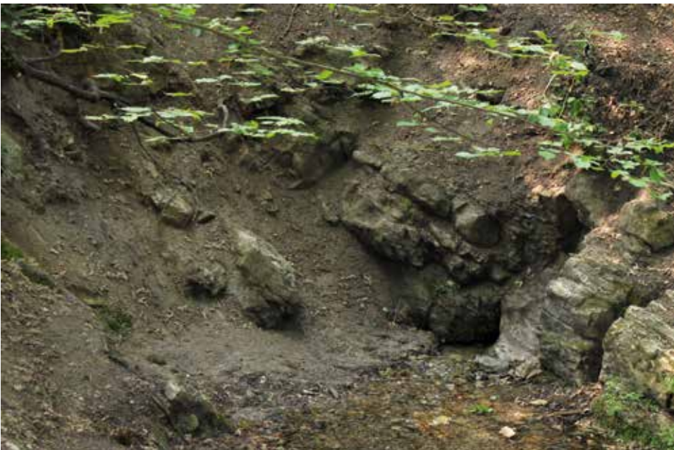
Abb. 3: Oberer Quellbereich der Retlage im Bereich der Dörenschlucht.