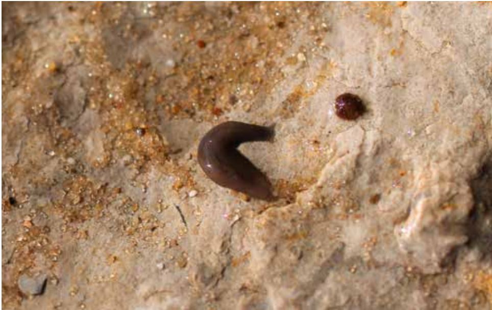
Abb. 4: Alpenplanarie ( Crenobia alpina ) aus dem Quellbach der Retlage (September 2012).

Am 23.09.05 waren die beiden Seitenquellen im Hauptquelltopf ohne Schüttung, nur die im mittleren Bereich des Quelltopfes aus dem Gestein aufsprudelnde Grundquelle schüttete kräftig. Nach längeren Trockenperioden (z. B. im September 2012) können die Quellen im Bereich des Quelltopfes jedoch auch komplett trocken fallen, während die beschriebenen weiter unterhalb liegenden Quellen nahezu konstant kräftig schütten. Bei einer Untersuchung des trocken gefallenen, aber feuchten Plänerschotter-Sand Untergrundes im Quelltopf Mitte September 2012 fand ich eine erste C. alpina in 27 cm Tiefe.