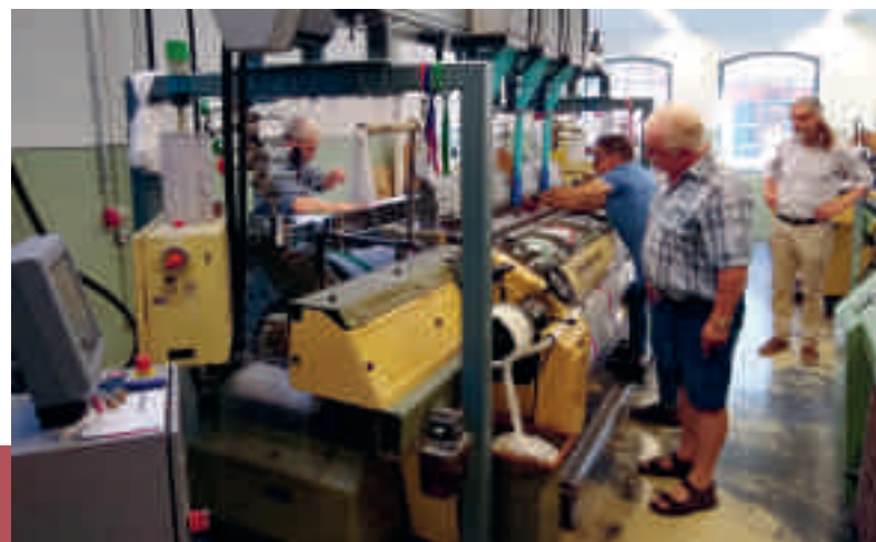
Produktion der Tischläufer im Textilwerk