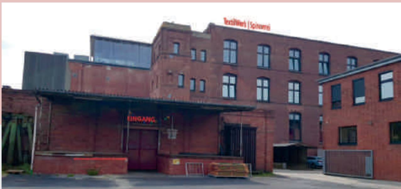
Licht im Dunkel. Mit Eröffnung der Podiumsbrücke über die Aa haben sich die Verkehrswege im Quartier verändert, und das Museum reagiert darauf mit einem System von Leuchtschriften an den Gebäuden, das den Besuchern zwischen Spinnerei und Weberei Orientierung geben wird.