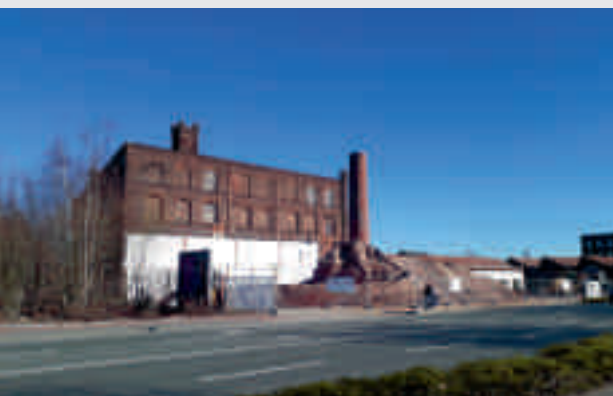
Das Spinnereigebäude von 1898 baut die Stadt Bocholt zum Lernwerk für Volkshochschule, Musikschule und freie Kunstszene um.

Das kubaai-Gelände ist gerade mächtig im Wandel, genauso wie unser Klima. Man hört nicht nur von neuen Hitzerekorden, man spürt die extremen Temperaturen wie im vergangenen Sommer am eigenen Leib. Das Thema Klimawandel ist aktueller denn je – und was war der Hauptauslöser und der Anfang vom möglichen Ende der Welt? Die Industrialisierung. Wie hat der Mensch die Natur verändert? Wie ging und wie geht er mit seiner Umwelt um? Wird die Industrialisierung der Anfang vom Ende unserer Erde sein? Unter anderem mit diesen Fragen beschäftigt sich das neue Freiwilligenprojekt unter dem Titel: „Der Anfang vom Ende? – Industrialisierung und Klimawandel“.