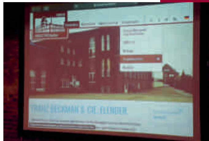
Die neue Homepage des Euregionetzwerk www.industriewerk.eu