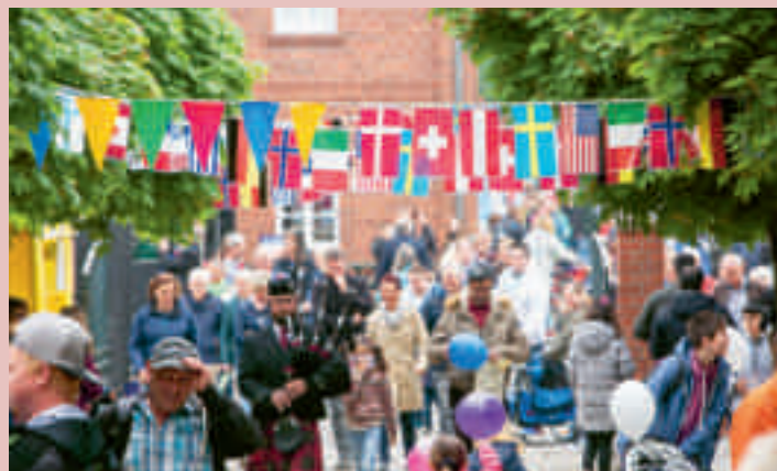
Dichter Trubel an der Weberei

Zahlreiche Vereine und Kulturgesellschaften aus Bocholt beteiligten sich mit Ständen, Kulinarischem, Mitmachaktionen und Bühnenbeiträgen am Programm. Musikalische Beiträge, Soundkunst und Kreativangebote luden zum Verweilen auf der Podiumsbrücke und den Uferwiesen ein. Kostenlose Fahrten mit dem Dampftraktor, ein Entenrennen, ein Picknick, mobile Musik-Acts und viele weitere Aktionen erfüllten das kubaai-Viertel mit Leben.