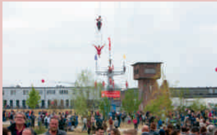
Hochseilshow über die Aa