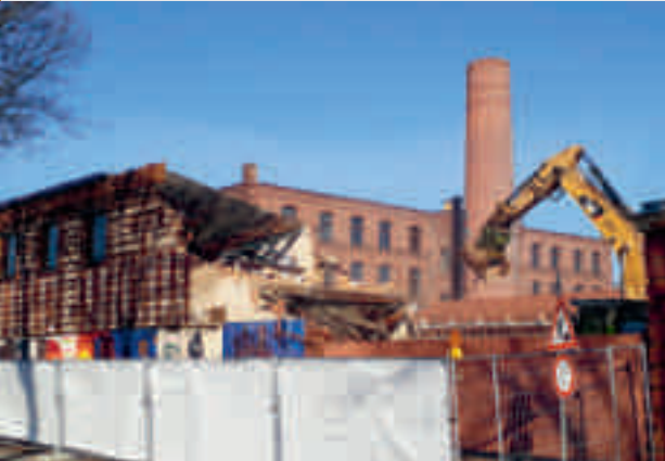
Abbruch eines Teils der Produktionsgebäude der Firma Carl Herding, Industriestraße 1, in Bocholt, im Januar 2019