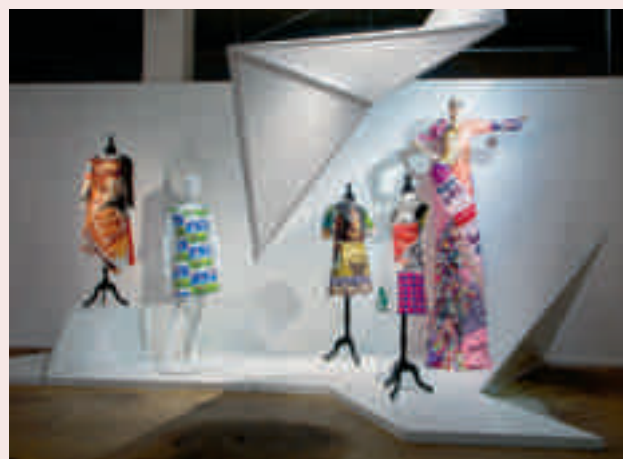
Blick auf die Ausstellungseinheit „Verführt“