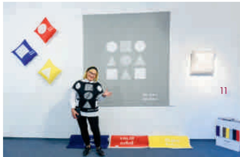
Ausstellung im Kunsthaus Bocholt