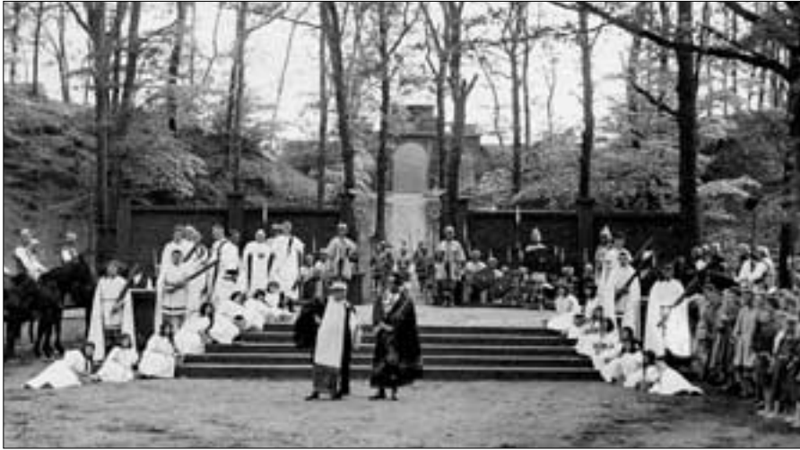
Aufführung von „Die heilige Helena“ in Birten 1926 (AG)