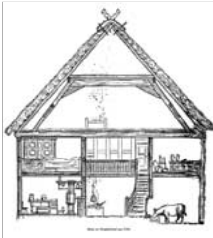
Schnitt durch ein Siegerländer Bauernhaus um 1700.

Durch die mannshohe Hubdier (Haustüre) kam der Besucher ins Innere des Siegerländer Bauernhauses. In uralter Zeit war die Haustüre in der Mitte noch quergeteilt. Es war eine Einrichtung, die mancherlei Vorteile bot. Tagsüber stand der obere Teil offen und gab dem fensterlosen Ärn (Hausflur) Licht und Luft. Der in der Diele Arbeitende konnte so über den unteren Teil hinweg die Vorgänge vor dem Hause beobachten. Bei Sommertagen, wenn die ganze Türe offen stand, schob man zum Schutze gegen herumlaufende Hühner und Hunde das Gaar (Gatter) vor. Es war eine Lattentüre in gleicher Höhe wie der untere Türteil. Hiervon kam folgende Redensart, die man zu einem Menschen sagte, der über den schwierigsten Teil seiner Aufgabe noch nicht hinaus war: Dä es met der Broatwurscht noch net ewer de Gaar . (Der ist mit der Bratwurst noch nicht über dem Gatter) Ähnlich wie ein Hund, der im Hause eine Wurst gestohlen hat und nun damit noch über das Gatter springen muss.