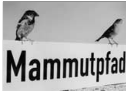
Hausperlinge auf einem Straßenschild in Ahlen

Für interessierte Gruppen kann die Veranstaltung auch zu einem anderen Termin nach Voranmeldung wiederholt werden. Auskünfte hierzu und zu der Veranstal-