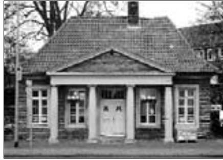
Klassizistisches Torhaus von 1778 als Domizil für den Stadtheimatbund Münster e.V.

Erbaut als sgt. „Wachthaus“ wie sein Pendant auf der gegenüberliegenden Seite, die „Torschreiberei“, von dem münsterschen Baumeister Wilhelm Ferdinand Lipper (1733 – 1800), der nach dem Tode des berühmten Barockbaumeisters Johann Conrad Schlaun (1695 – 1773) auch den Bau des Fürstbischöflichen Residenzschlosses zu Münster zum Abschluss gebracht hat, wird dieses der Stadt Münster gehörende Torhaus demnächst Vereinsdomizil mit Ausstel-