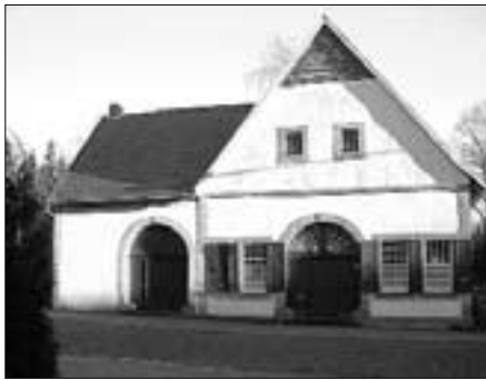
Das Beccard'sche Haus aus dem Jahre 1648.

Die NRW-Stiftung wurde um Beihilfe gebeten. Eine außerordentliche Mitgliederversammlung sollte den Kauf beschließen. Einzelne Mitglieder spendeten dabei privat bis 500 €. Und dann endlich kam der Beschluss der NRW-Stiftung: 150000 € sollten aus Düsseldorf nach Lengerich fließen. Es kam Tinte unter den Vertrag. Damit indes begann die eigentliche Arbeit für den Heimatverein. Eine Nutzungsänderung war möglich, aber unter den strengen Augen der Oberen Denkmalbehörde. Viele hundert ehrenamtliche Arbeitsstunden liegen nun hinter den fleißigen Helfern. Der Umbau ist geschafft, das Ackerbürgerhaus mit dem schmucken Kamin und einer Raumhöhe von teilweise drei Metern ist im Februar endgültig bezogen worden. Es ist ein geschichtliches Schmuckstück in jeder Hinsicht, nicht nur das Fachwerk oder die Sandsteinplatten des Fußbodens lassen die Vergangenheit lebendig werden. Selbst der alte Torbalken aus dem Jahr 1648 ist noch da. Und übrigens auch die große Solidarität und Spendenbereitschaft der Lengericher. Denn alle wissen: Solch ein altehrwürdiges Haus ist ein ewiger Pflegefall. Nach der offiziell-