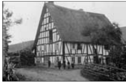
Strohdach auf einem Doppelhaus in Grund.

Zudem waren beim westfälischen Haus die mächtigen Holzständer im Inneren maß- und formgebend für den ganzen Bau, und die Außenwände bildeten nur den Abschluss. Dagegen trugen beim fränkischen gerade die Außenwände die ganze Last des Daches. Unser Siegerländer Bauernhaus gehörte nun, da es neben der Küche mit dem Herd noch eine selbstständige Stube mit einem Ofen