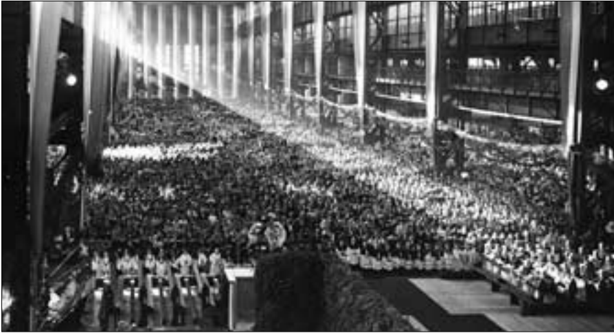
Bochumer Katholikentag 1949 in der Halle des Bochumer Vereins (AG)