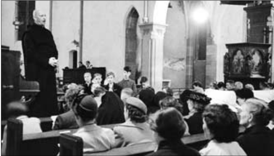
Volkschoralkurs in Düsseldorf-Oberbilk 1953 (AG)

gewann 39 . In Herten-Langenbochum schien ihm „jedes neue Bergmannshaus ... eine Fernsehanlage zu haben ... Als ich eines Abends die Anwesenden freundlich fragte, wo wohl die anderen Gemeindeglieder seien, kam von zwei Seiten die Antwort: ‚Beim Fernsehen.‘“ 40