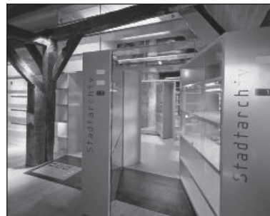
Die neuen Räumlichkeiten vor dem Einzug

gestalten« die Wichtigkeit des Erinnerns und Erzählens der regionalen Geschichte, um die Identifikation mit der Heimatregion zu ermöglichen. Bei abnehmender Bevölkerung sei die Regionalgeschichte ein wichti-