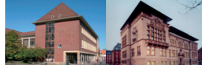
Fürstenberghaus und LWL-Landesmuseum für Kunst und Kulturgeschichte