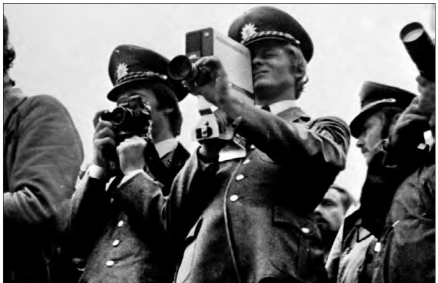
Deutschland im Herbst.

jungen Filmemacher/innen von der verunsicherten Bonner Republik hatten. Ein umstrittener Kommentar, aber auch ein eindrucksvolles Zeitdokument, das uns heute einen unmittelbaren Zugang in das Jahr 1977 ermöglicht und die Stimmung jener Zeit nachvollziehbar macht. Zugleich provoziert der Film auch heute noch Diskussionen.