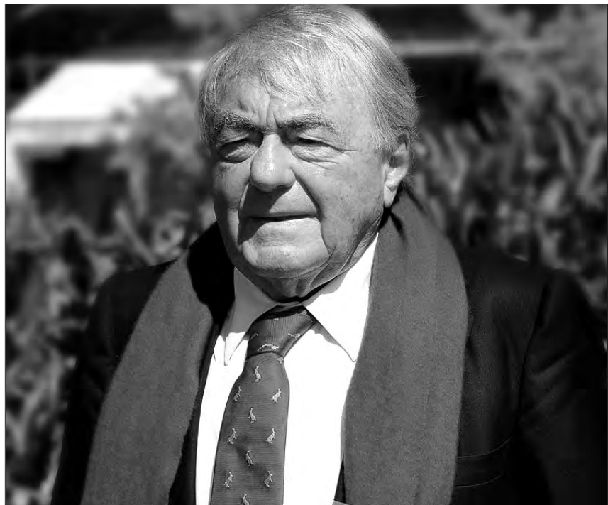
Shoah-Regisseur Claude Lanzmann 2011.

Lanzmanns Hoffnung, dass sein Film in Deutschland „eine absolut positive Wirkung haben“ könne, erfüllte sich