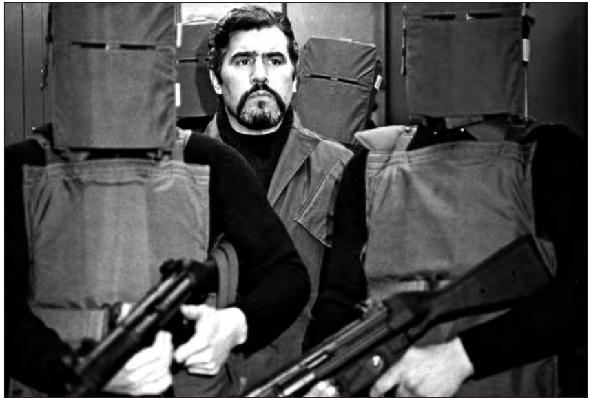
Mario Adorf in „Die verlorene Ehre der Katharina Blum“.

Im zweiten Filmforum widmeten wir uns einem Film, der in keine Schublade so recht passen will. „Deutschland im Herbst“ enthält neben dokumentarischen Teilen auch Spielfilmelemente. Es handelt sich um ein Gemeinschaftsprojekt von zahlreichen namenhaften Vertreter/innen des Neuen Deutschen Films wie Rainer Werner Fassbinder oder Alexander Kluge. In mehreren Episoden werden unmittelbar nach den Ereignissen von 1977 die Eindrücke veranschaulicht, die die