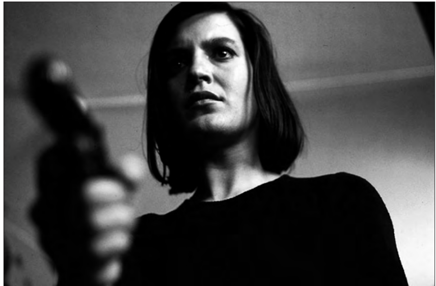
Die verlorene Ehre der Katharina Blum.

Darüber hinaus wird seit einigen Jahren auch über die „richtige“ Form des Erinnerns gestritten. Häufig wird von dem „Mythos RAF“ gesprochen, der gerade durch Journalisten/innen und Filmemacher/innen geschaffen worden sei, oftmals Leute, die dem Sympathisantenkreis der Terroristen/innen angehört hätten. So schreibt die Publizistin Bettina Röhl, die Tochter von Ulrike Meinhof, in ihrem Essay aus dem Jahr 2007: