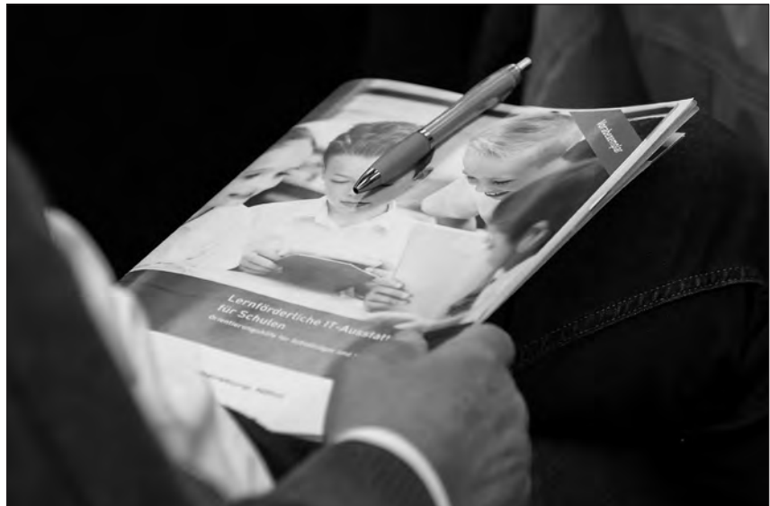
Die Orientierungshilfe zur lernförderlichen IT-Ausstattung an Schulen soll Schulen und Schulträgern als Hilfe dienen.

Um aber eine Orientierung zu bekommen, die hilft, diese Wege zu finden, veröffentlichte die Medienberatung NRW vor Kurzem die gut vierzigseitige Broschüre „Lernförderliche IT-Ausstattung für Schulen – Orientierungshilfe für Schulträger und Schulen in NRW“. Die Reaktionen auf und nach der Schulträgetagung am 17. Januar 2017 (s. Bericht von Birgit Giering in diesem Heft), als den Anwesenden ein Vorabdruck übergeben wurde, zeigen sehr deutlich, dass die Schrift genau zum richtigen Zeitpunkt fertig gestellt wurde. Nicht zuletzt aufgrund des Investitionsprogrammes „Gute Schule 2020“, das zu Beginn des Jahres angelaufen ist und durch das vor allem der Ausbau