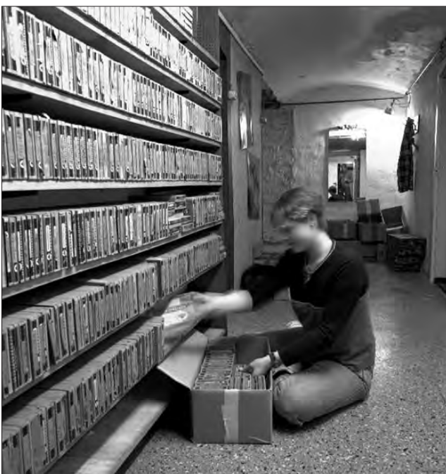
Im Keller des Fotostudios Viegener werden die Fotoglasplatten für den Transport verpackt.

ge Volumen nicht unterbringen – und so rettet man in Münster die wertvolle Sammlung vor der Müllhalde.