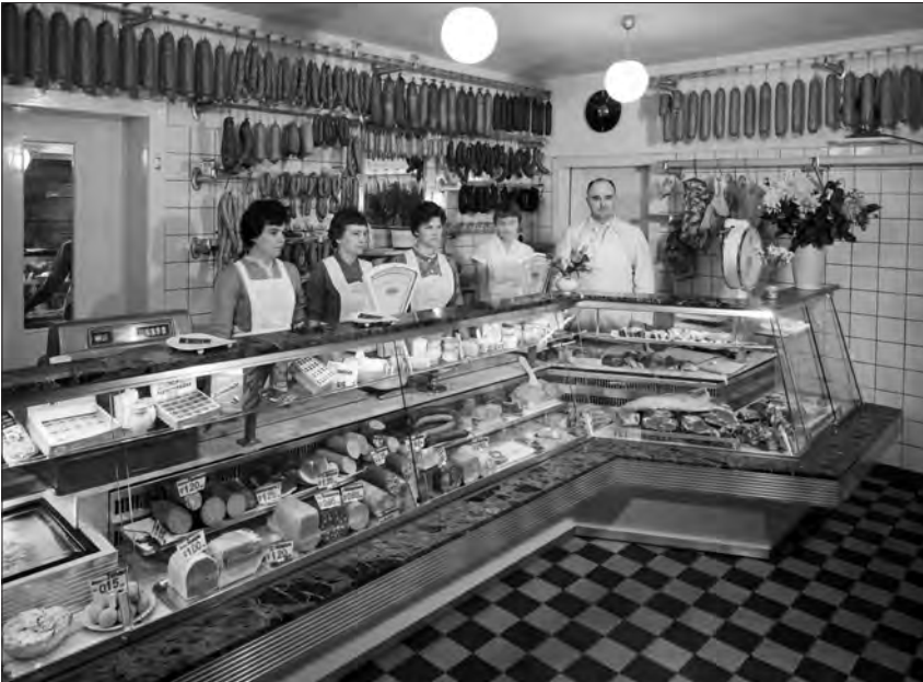
Fleischerei in Hamm.