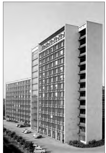
Oberlandesgericht Hamm, Neubau von 1958.