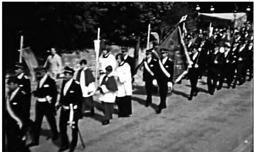
Nepomuk-Prozession, 1971 (Standbild)

Der Schützenverein existiert seit 1596, besitzt eine eigene Schützenhalle und das Schützenfest stellt das größte Ereignis des Jahres dar. Der heilige Nepomuk wird als Schutzpatron von den örtlichen Schützen verehrt. So findet das mehrtägige Schützenfest nicht nur jährlich um den 16. Mai, dem Tag des heiligen Nepomuk, statt, sondern zum Ablauf des Festes zählt auch eine große Nepomuk-Prozession.