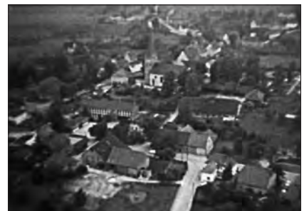
Mellrich, 1974 (Standbild)