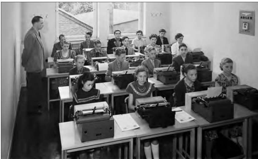
Schreibmaschinenkurs.