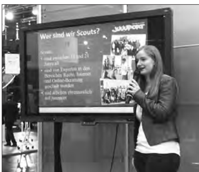
Einige Scouts engagieren sich als juuport-„Botschafter“, indem sie auf Messen oder Veranstaltungen juuport-Vorträge halten, Infostände betreuen oder Ansprechpartner für die Presse sind – wie hier auf der didacta 2016.

juuport ( www.juuport.de ) wurde im April 2010 von der Niedersächsischen Landesmedienanstalt ins Leben gerufen. Getragen wird die Plattform von dem Verein juuport e.V., dessen Mitglieder neben der NLM folgende Landesmedienanstalten sind: Bremische Landesmedienanstalt, Landesanstalt für Kommunikation Baden-Württemberg, Landesanstalt für Medien Nordrhein-Westfalen, Landeszentrale für Medien und Kommunikation, Medienanstalt Mecklenburg-Vorpommern, Medienanstalt Sachsen-Anhalt.