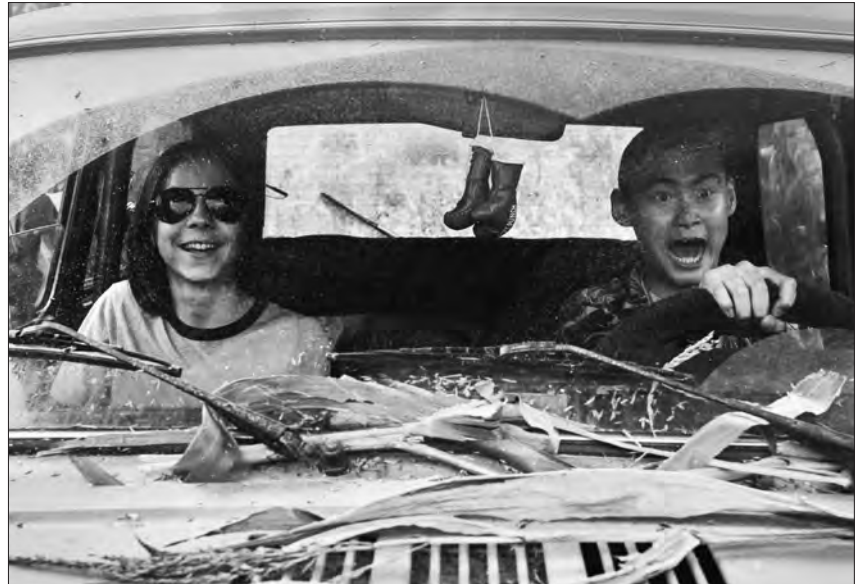
„Tschick“ – der meistgesehene Film bei den SchulKinoWochen 2017.

„Nicht zu lange nachdenken, einfach machen!“, das ist nicht nur das Wesen von Tschick, so lautete auch das Motto von Regisseur Fatih Akin beim Dreh des Kinofilms. Dadurch ist „Tschick“ mehr als eine literarische Heldenreise oder ein Buddy-Movie nach Schema F geworden, vor allem nämlich eine glaubwürdige Auseinandersetzung mit jugendlichen Gefühlen. Trotz einiger Übertreibungen ist „Tschick“ kein überdrehter Teenie-Film, sondern im Kern authentisch, und ermöglicht Jung und Alt die Identifikation mit dem Protagonisten Maik. Die tatsächlich extremen Charaktere Tschick und Isa sind die Katalysatoren seiner Entwicklung. Das unmittelbar wirkende Spiel der talentierten jungen Darsteller wird getragen von einer Bilderwelt, in der