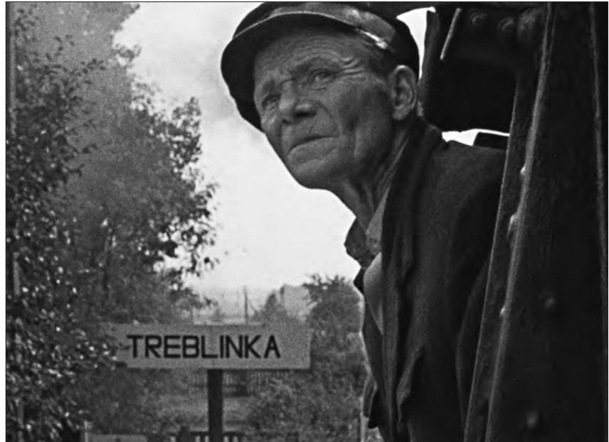
Einfahrt in Treblinka – Standbild aus dem Film „Shoah“.

Die Arbeit an seinem Hauptwerk „Shoah“ nahm Lanzmann 1974 auf. Über zehn Jahre lang reiste er durch die USA, Israel und Europa, um Zeitzeugen zu befragen, v.a. in Polen, wo er auch die Schauplätze der Vernichtung in Treblinka, Sobibor, Auschwitz, Chelmno und Warschau ablichtete. Der Filmemacher führte intensive Zeitzeugen-Interviews, sowohl mit Opfern als auch Tätern und „Zuschauern“ des Holocaust, außerdem mit dem österreichisch-amerikanischen