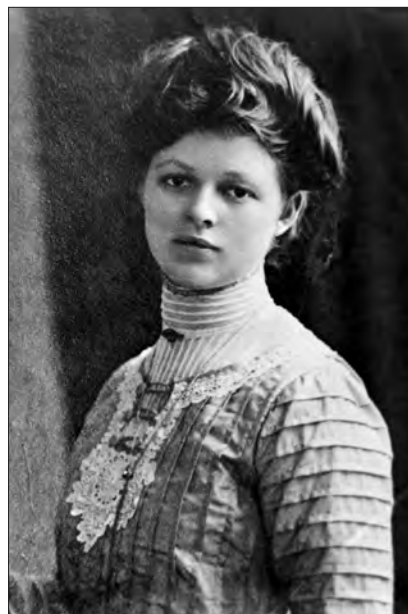
Porträt einer Dame.