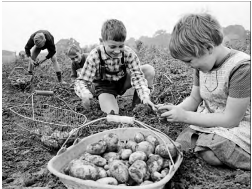
Kinder beim „Kartoffelstoppeln“ in den 1960er Jahren bei Castrop-Rauxel-Obercastrop.

Neu ins Bildarchiv übernommen hat das LWL-Medienzentrum zuletzt die Sammlungen des Ruhrgebietsfotogra-