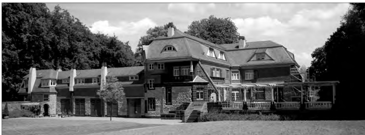
Der Hohenhof – das ehemalige Wohnhaus von Karl Ernst Osthaus in Hagen-Eppenhäusen.

Der Hagener Museumsgründer Karl Ernst Osthaus im Filmporträt