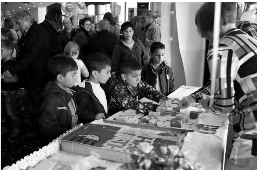
Nach dem Film wurde an alle Kinobesucher ein Stück von der Geburtstagstorte verteilt.

Das 30. Kinderfilmfest in Hamm war ein voller Erfolg