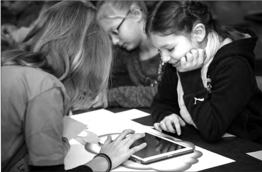
Vor allem Kinder- und Jugendliche tippen, klicken und wischen sich durch eine von bewegten Bildern dominierte Welt.

Mit Erklärvideos zu einer grundlegenden Filmkompetenz