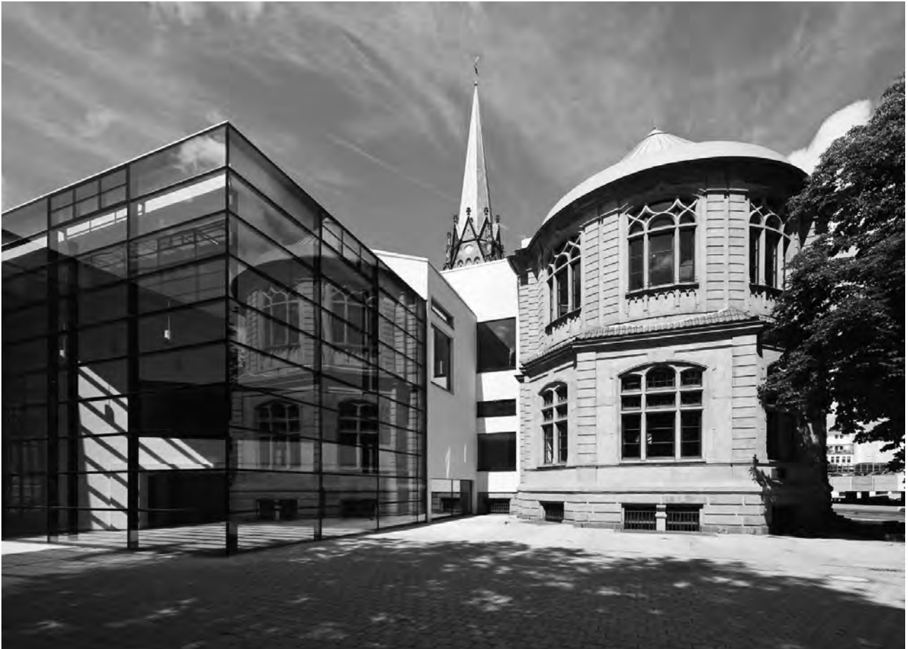
Das Osthaus Museum Hagen – Alt- und Neubau.

fruchtbar war die Zusammenarbeit mit dem belgischen Architekten Henry van de Velde. Der Erste Weltkrieg markierte eine Zäsur in Osthaus' Schaffungsprozess und machte viele Ideen und Projekte zunichte. 1921 starb er mit nur 46 Jahren infolge einer Tuberkulose, an der er als Soldat erkrankt war.