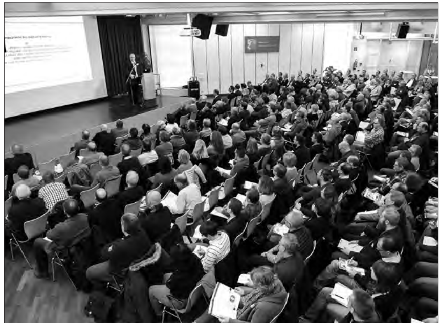
Gut 340 Teilnehmerinnen und Teilnehmer folgen mit Interesse den Vorträgen.

Geübt und geprägt durch die Erfahrungen der letzten Jahre bilden sich auf der Stirn des Organisationsteams trotz der durchaus deutlichen Überschrei-