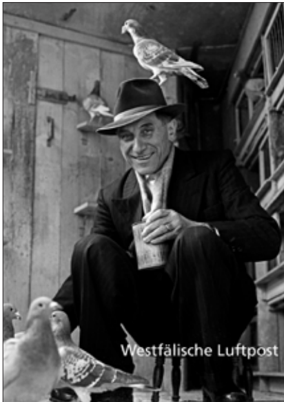
Brieftaubenzüchter, Castrop-Rauxel 1967