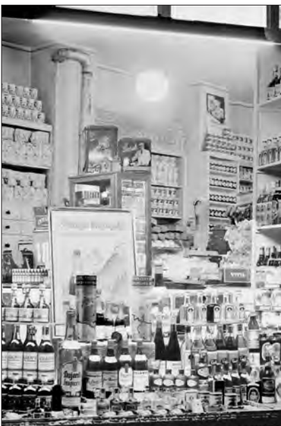
Schaufenster eines Lebensmittelladens.

die Orts-, Wirtschafts- und Gesellschaftshistorie der Stadt Hamm seit 1925. Und: bei den Beständen mangelt es an Erschließungsinformationen. Bildangaben auf Hüllen oder Kästchen sind nur selten vorhanden und die Findbucheinträge folgen keinem konsequenten Schema. Jede noch so