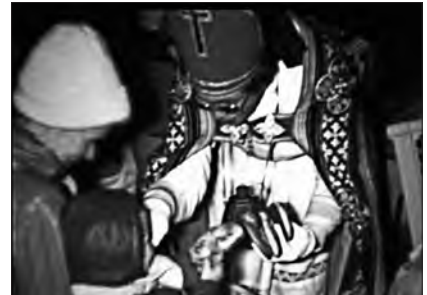
St. Martin in Mellrich, 1981 (Standbild)

Dank des unermüdlichen Einsatzes von Amateurfilmer Reinhard Priesnitz bilden die gut 13 Filmstunden ein Abbild dörflichen Lebens in Westfalen über einen sehr langen Zeitraum. So kann ebenso