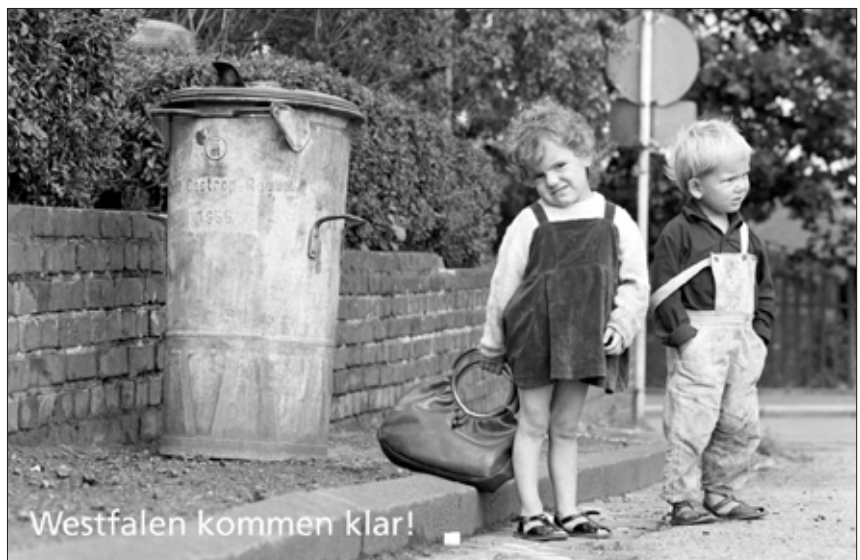
Zwei an der Mülltonne, Castrop-Rauxel 1960er Jahre

Vier der Motive stammen aus der Sammlung des Castrop-Rauxeler Pressefotografen Helmut Orwat (geb. 1938). Dieser hat seit den 1950ern über viele Jahre das Alltagsleben im Ruhrgebiet dokumentiert und in unzähligen Aufnahmen ein persönliches und authentisches Porträt der Bewohner gezeichnet. Das fünfte Motiv fotografierte der Raesfelder Dorfchronist Ignaz Böckenhoff (1911-1994), dessen