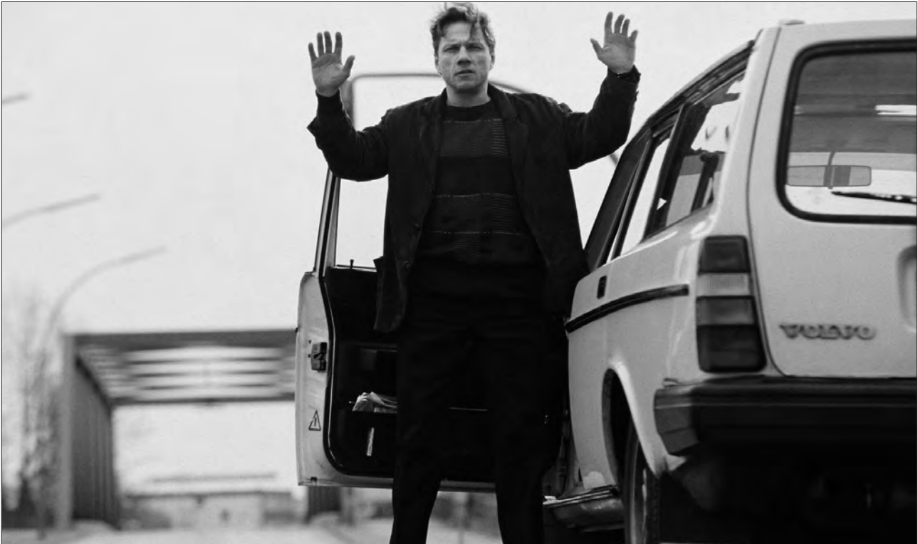
Richy Müller in „Die innere Sicherheit“ – Ein Film von Christian Petzold.

verändern. Der Film orientiert sich an den Biografien von der RAF-Terroristin Gudrun Ensslin und ihrer Schwester Christiane Ensslin, die eine der Mitbegründerinnen der feministischen Zeitschrift Emma war.