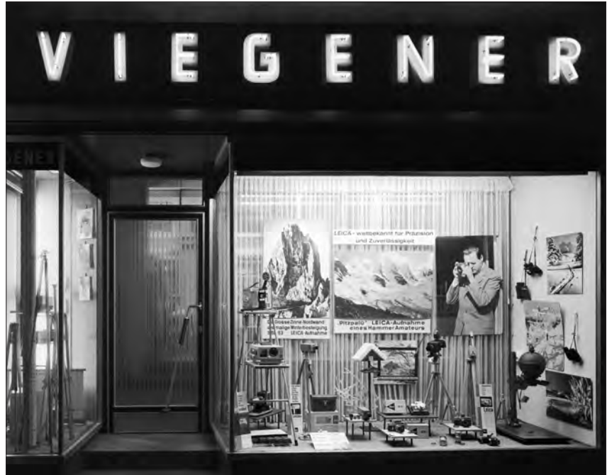
Fotogeschäft Viegener an der Hammer Oststraße, 1925 gegründet.