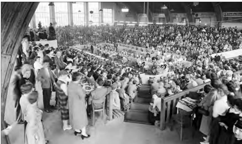
Friseur-Wettbewerb, Hamm.

aufwändige Recherche erbringt kaum mehr als Zufallstreffer. Ein dichtes, vielversprechendes Werk lokaler Überlieferung – und doch kaum zugänglich, schon gar nicht für Ortsfremde ... der denkbar schwierigste Fall für die Verantwortlichen im Bildarchiv.