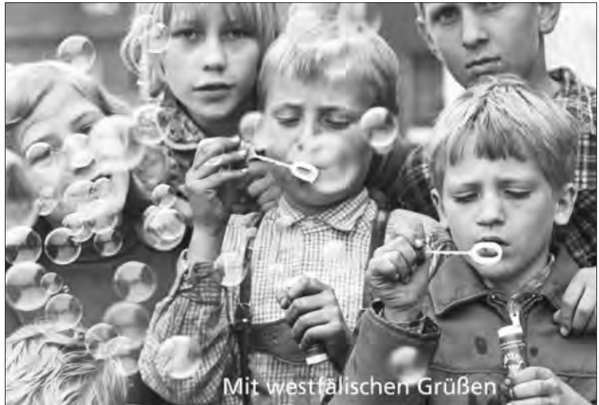
Pustefix-Vergnügen, Ruhrgebiet 1960er Jahre

Gemeinsam mit der Stiftung Westfalen-Initiative hat das LWL-Medienzentrum für Westfalen zum zweiten Mal eine Postkartenserie mit historischen Fotografien veröffentlicht. Fünf verschiedene Westfalen-Postkarten zeigen Alltagssituationen und Porträts „echter Westfalen“ aus den 1930er bis 1960er Jahren, die jeweils um witzig-amüsante „Westfalensprüche“ wie „Westfalen sind nicht zu bremsen“ und „Westfalen rockt“ ergänzt worden sind.