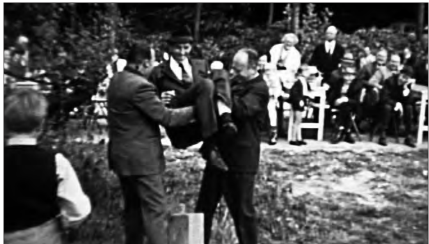
Schnadgang, 1971 (Standbild)

Wie lokalen Internetseiten entnommen werden kann, hat der Brauch des „Schnadgangs“ auch im 21. Jahrhundert weiterhin Bestand. Aus demselben Jahr und ebenfalls mit Ton erhalten, ist der zweiteilige Film über das Jubiläumsschützenfest von 1971 in Mellrich. Die Schützen bilden den größten und traditionsreichsten Verein in Mellrich.