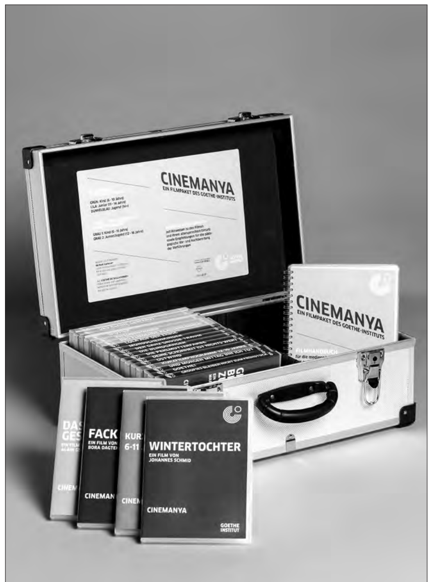
15 Filmkoffer stehen für Filmvorführungen mit pädagogischen Begleitaktionen zur Verfügung.

Als externen Kooperationspartner für die Durchführung des Projektes, welches zudem von der Japan Art Association unterstützt wurde, konnte das Goethe Institut den Bundesverband Jugend und Film e.V. (BJF) gewinnen. Aus dessen rund 1.000 Mitgliedern der kulturellen Kinder- und Jugendfilmarbeit wurden für jedes Bundesland sogenannte „Kofferpatinnen“ und „Kofferpaten“ generiert, die als Ansprechpartnerinnen und Ansprechpartner für Kulturzentren, Schulen oder Einrichtungen für Geflüchtete fungieren, diese gleichsam aufsuchen und vor Ort Filmvorführungen mit pädagogischen Begleitaktionen durchführen.