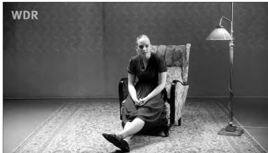
In der Unterrichtsreihe „Was geht mich das an?“ ermöglichen Protagonisten den Jugendlichen einen emotionalen Zugang und motivieren zur Auseinandersetzung mit dem Thema.

Filme, Lernspiele und Arbeitsblätter – alles finden Lehrerinnen und Lehrer gesammelt auf der Internetseite von Planet Schule. Sämtliche Filme sind auch bei Edmond NRW für den Einsatz im Unterricht erhältlich. Die Seite von Planet Schule ist für alle offen – Schülerinnen und Schüler können sie auch zu Hause nutzen. Zum Einsatz von Planet Schule-Filmen und Multimedia-Elementen im Unterricht bietet der WDR interessierten Schulen und Fortbildungseinrichtungen kostenfreie Seminare und Workshops an.