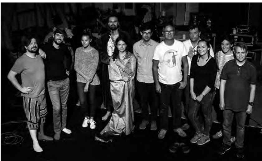
Das Filmteam mit den Schauspielern und Statisten im Studio des LWL-Medienzentrums