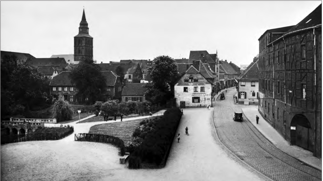
Am Nordring, in den 1930er Jahren angelegte Parkanlage in der Innenstadt von Hamm zwischen Nordstraße und der Straße Nordring.

Es dauert zwei Jahre, bis ein junger Historiker nach monatelangem Sichten und Sortieren erste Strukturen im Chaos erkennt und protokolliert und erste Margen hochgefährdeter Glasplatten ausmacht, die durch ein Spezialunternehmen gereinigt werden. Zwölf Schwerlaststahlschränke werden