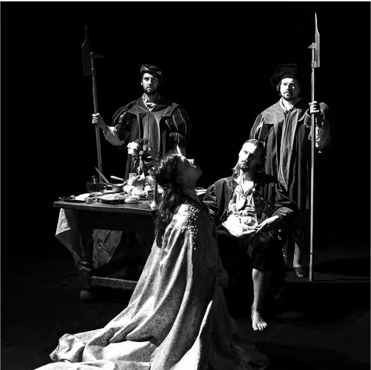
Innerhalb der 1. Episode der Kurzfilmreihe wird besonders mit Spielfilmelementen gearbeitet, u. a. in Form eines sogenannten Reenactments.

Einsatz kommen. Daher ist die Auswahl der Themen an den Anforderungen des Kernlehrplans NRW ausgerichtet. Die Kurzfilme sollen dazu beitragen, Bezüge von Mikro- (Westfalen) zu Makrogeschehen (Deutschland, Europa, die Welt) herzustellen, sodass anhand der regionalhistorischen Geschehen auf allgemeinere historische Dimensionen und Phänomene eingegangen werden kann. Die Geschichte der Täufer von Münster etwa verdichtet, was an politischen, religiösen, wirtschaftlichen und sozialen Spannungen eine ganze