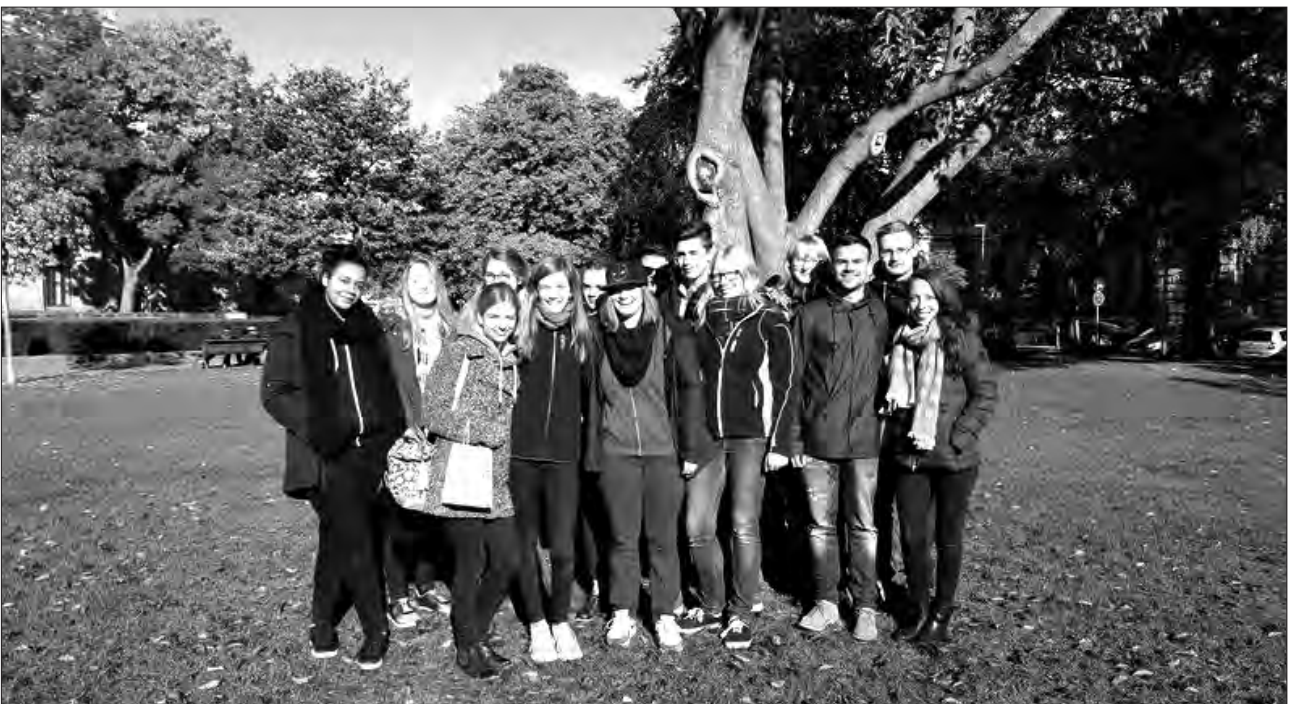
Die Scouts, Jugendliche zwischen 15 und 21 Jahre alt, arbeiten ehrenamtlich auf juuport.

Für Jugendliche, die Hilfe und Rat suchen, sind die juuport-Scouts da.