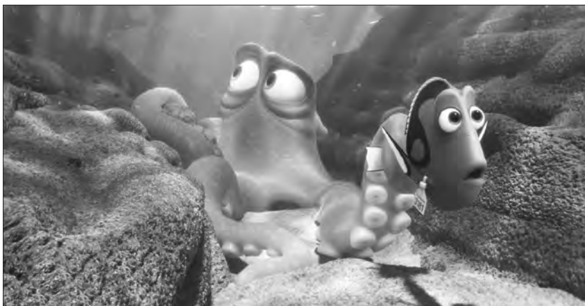
Erfolgreicher Animationsfilm bei den SchulKinoWochen: „Findet Dorie“.