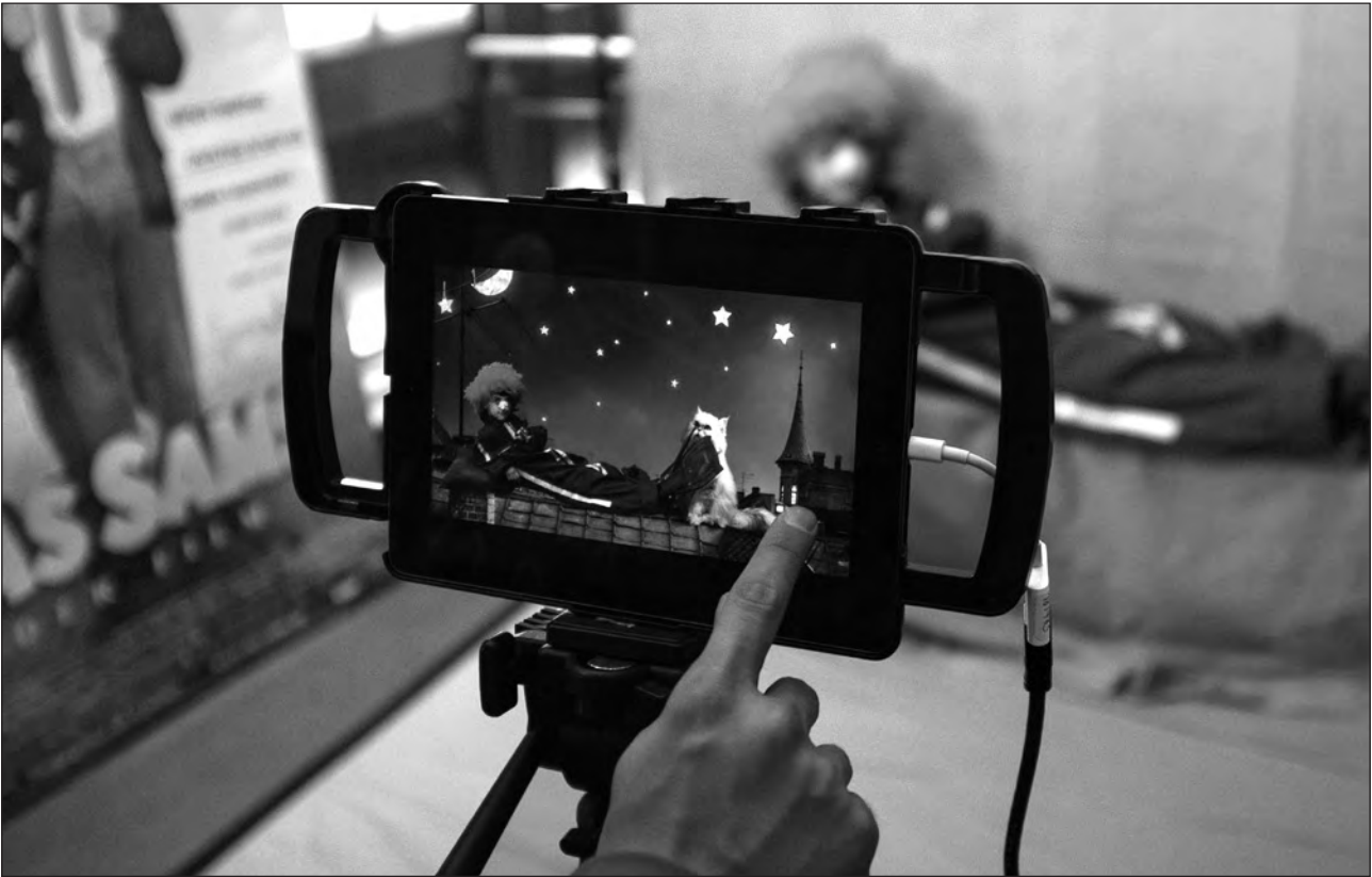
Nach dem Film durften sich die Kinder als „Sams“ verkleiden.

„Findet Dorie“ kamen ausgesprochen gut beim jungen Kinopublikum an.