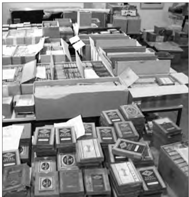
Die große Sammlung „flutet“ das Magazin des Bildarchivs.