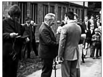
Einfangen des O-Tons, 1971 (Standbild)

das Bewahren von traditionsreichem Brauchtum entdeckt wie Veränderungen registriert werden. Vom lokalen „Schnadgang“ bis zum jährlichen Schützenfest, von Prozessionen bis zur Ausgestaltung vom Vereinsleben. Die regelmäßigen Ausflüge in das nähere und fernere Umland, sei es von der Kameradschaft ehemaliger Soldaten, sei es vom Heimatverein, vom Sportverein oder von den Ministranten lassen dabei den Blick nicht nur auf Mellrich verharren. So kamen z. B. auch Aufnahmen aus dem LWL-Freilichtmuseum in Detmold vor genau 30 Jahren zustande, wo der Heimatverein einen wiederaufgebauten Kirchhofspeicher aus Mellrich besichtigte.