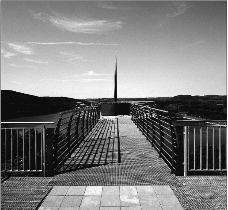
Die Aussichtsplattform „Biggeblick“ an der SGV-Hütte Attendorn bietet einen besonderen Ausblick über den Biggensee.

und an die Vielen namentlich hier nicht genannten für ihre Unterstützung während der Dreharbeiten.