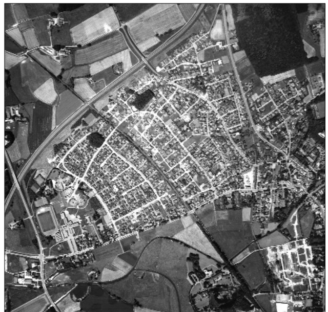
Siedlungsform: Schachbrettsiedlung bei Borken-Gemen