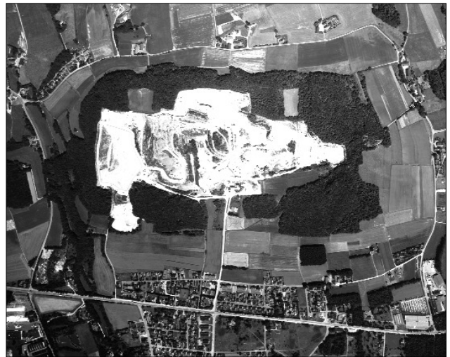
Kalksteinbruch bei Halle-Künsebeck

Der Laie betrachtet sie eher befremdet, Geographen lieben sie – auch Stadt- und Landschaftsplaner, Liegenschaftsämter, Kartenhersteller und die Fernerkundung können sie nicht mehr entbehren: die „Messbilder“, Steil- oder auch „Senkrechtaufnahmen“ eines Erdausschnittes vom Flugzeug aus. Messbilder werden mit einer speziellen Messbildkamera aufgenommen – einzeln oder zum Bildstreifen verbunden als Reihenmessbild. Das Besondere: Unter einem Stereoskop lassen sich alle Details einer Landschaft oder Siedlung bis hin zum Dorfbrunnen in dreidimensionaler Optik betrachten. Kein anderes fotografisches Medium bietet eine derart dichte Information über