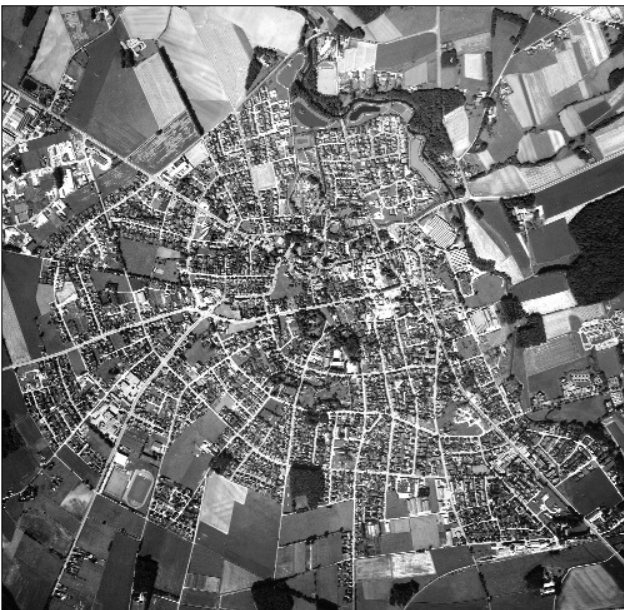
Siedlungsform: Konzentrische Stadtentwicklung bei Gescher