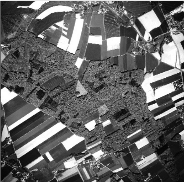
Flurformen bei Havixbeck

die Verteilung und Entwicklung von Flächennutzungen im Raum. Und: Erstellt man die Aufnahmen in Falschfarbentografie, visualisieren sie zudem verborgene Informationen wie den Verlauf ökologischer Prozesse oder die Verbreitung von Erd- und Gewässerbelastungen und vieles mehr.