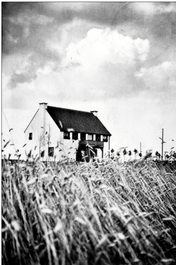
Das Haus auf der Haar