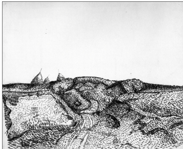
Wilhelm Wulff: Soester Landschaft mit Heuhaufen (Federzeichnung 1912)