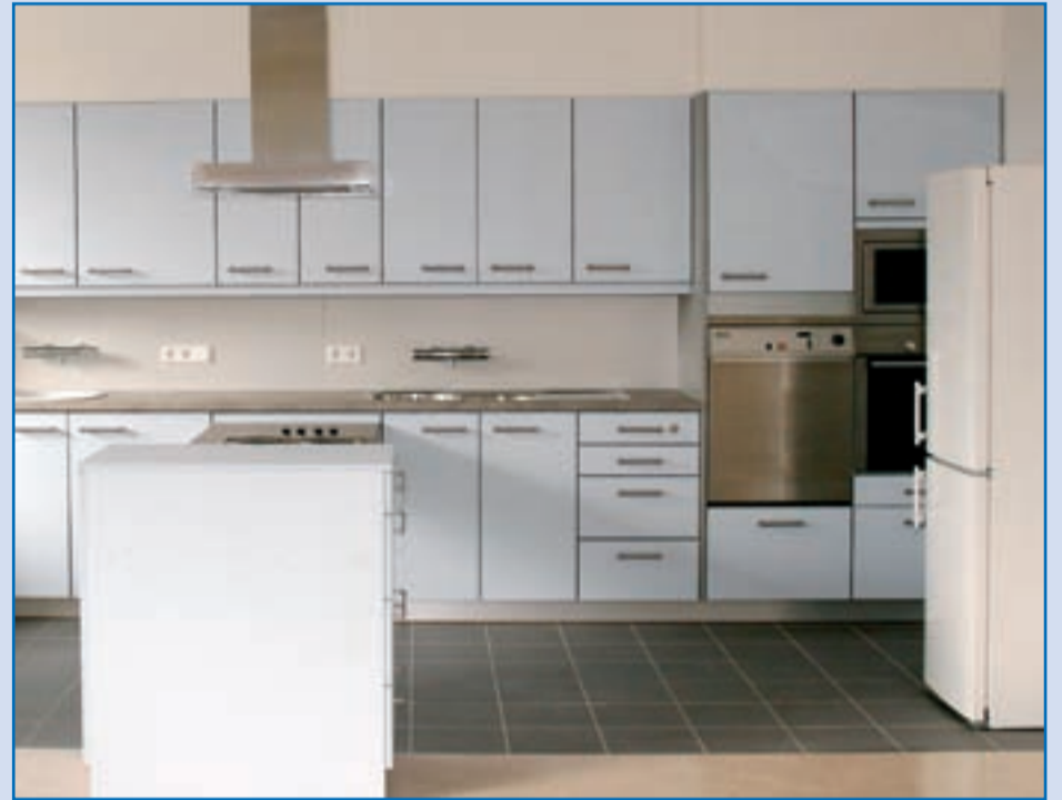
Aktionen wie Kochen oder Backen in der Therapieküche stärken das Gemeinschaftsgefühl