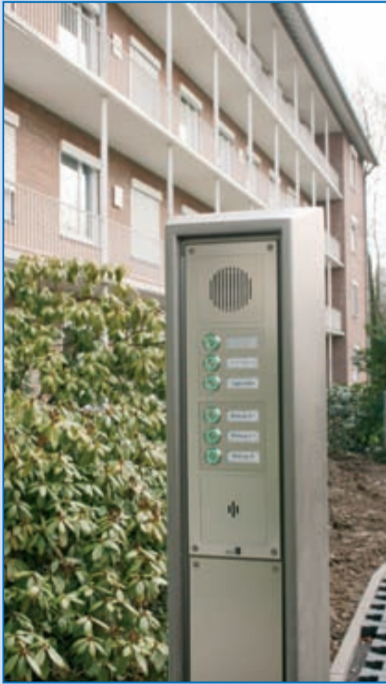
An der modernen Stele im Eingangsbereich erhalten Besucher Zugang zu den einzelnen Wohngruppen.