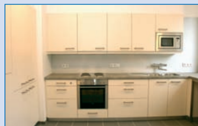
Die Bewohner leben in Wohngruppen zusammen, die über eine eigene Küche, ein Esszimmer und Wohnzimmer verfügen.

Wir machen Ihr Haus fit für die Zukunft!