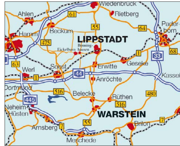
Lageplan der LWL-Einrichtungen Warstein: