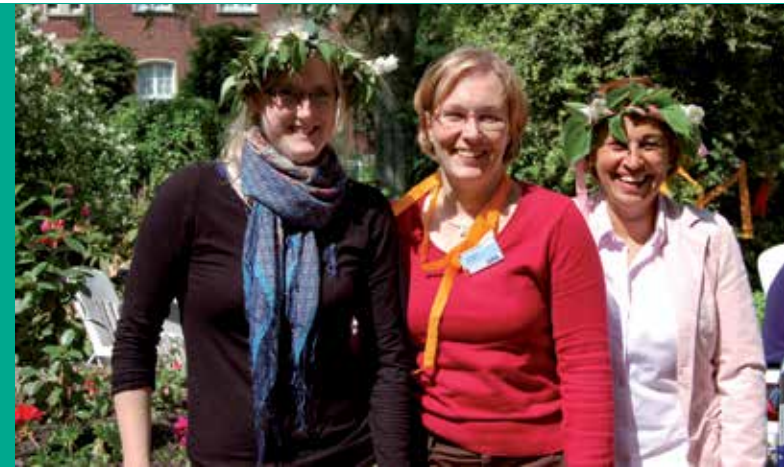
Mitarbeiterinnen beim Maifest