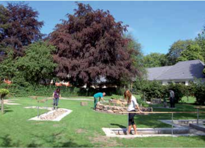
Barfußpfad auf dem Klinikgelände