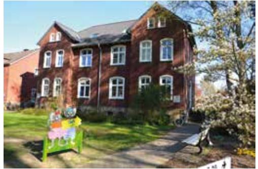
Kita „Die Klinikmäuse“