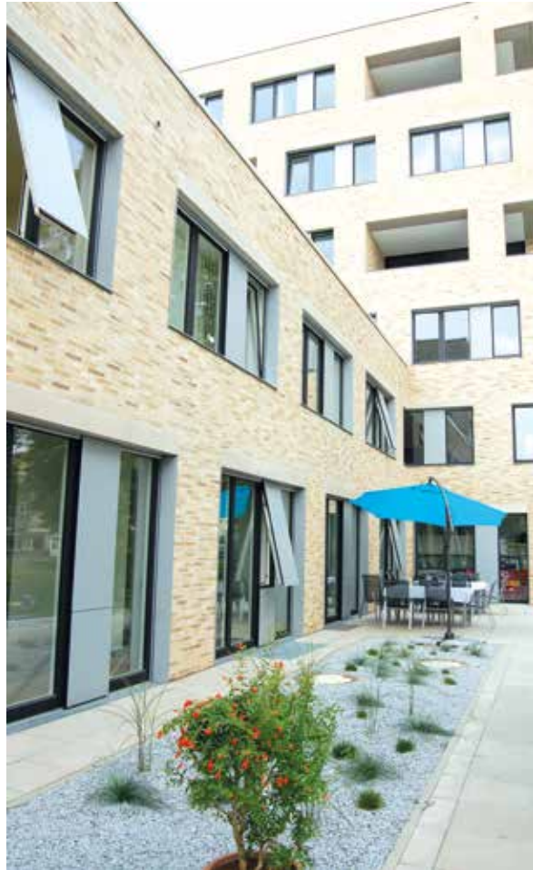
LWL-Tagesklinik für Spezielle Psychotherapie