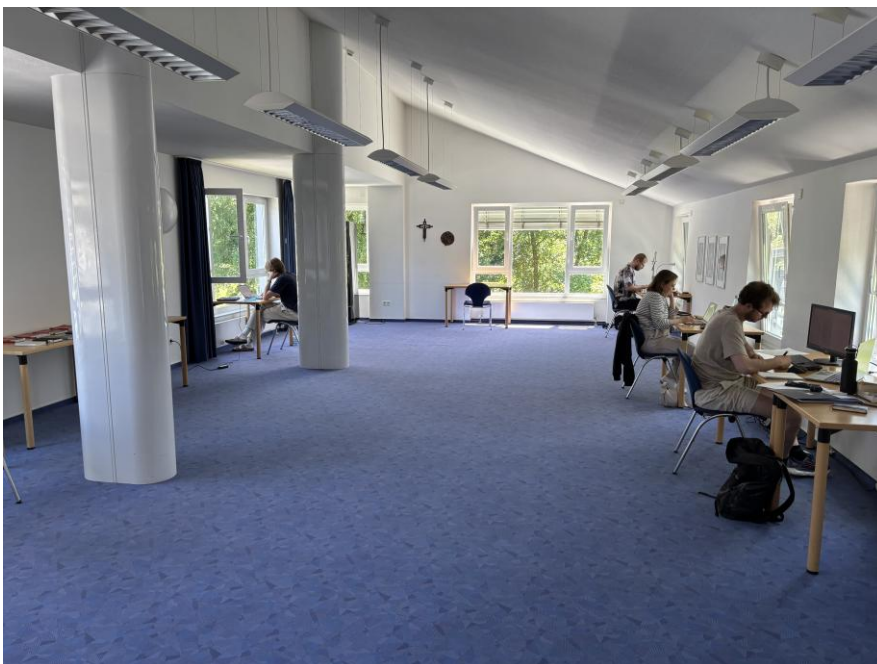
Trotz Ausweichmöglichkeiten konzentrierten sich unsere Schreibeinheiten im Raum „Ruhrtblick“.