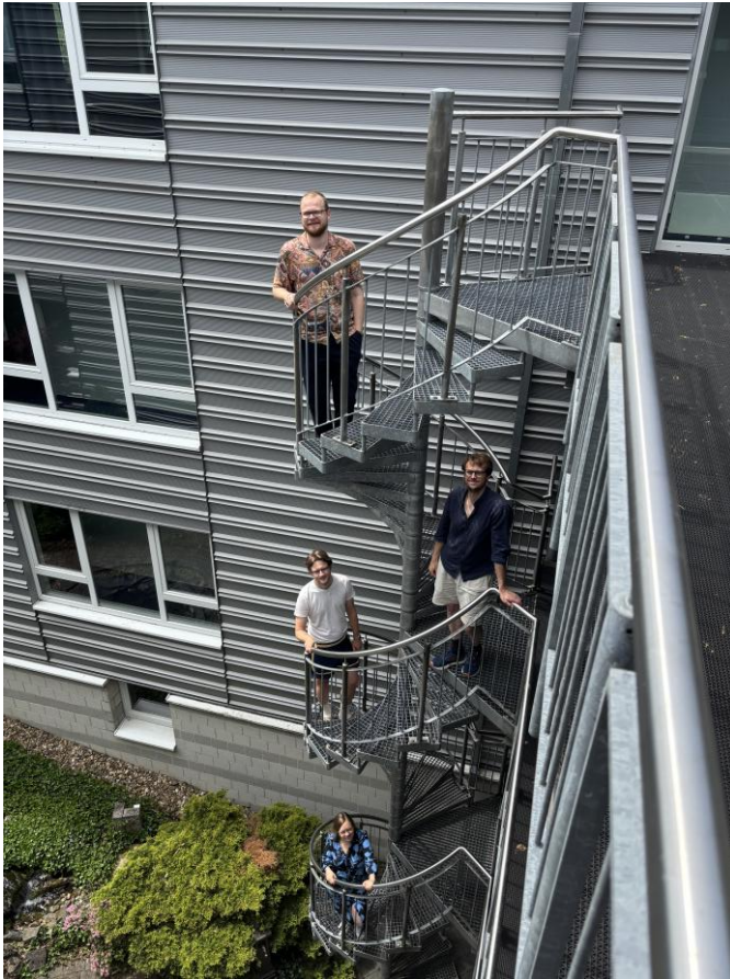
Pünktlich zum Ende der Mittagspause: gemeinsam rauf in den Elfenbeinturm...

Unterschieden in den Projekten und ihren Rahmenbedingungen erwies sich das Schreiben an einer Doktorarbeit auch hier als verbindende Erfahrung.