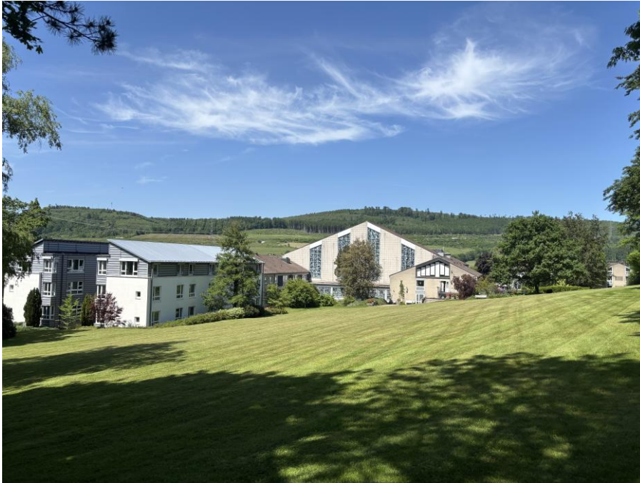
Eine sonnige Dissertations-Pfingstwoche in Bestwig: Südansicht des Bergklosters.

Gesamtpaket zu entrichten hatten, belief sich auf hundert Euro. Gut zwei Drittel der Kosten übernahm die Historische Kommission.