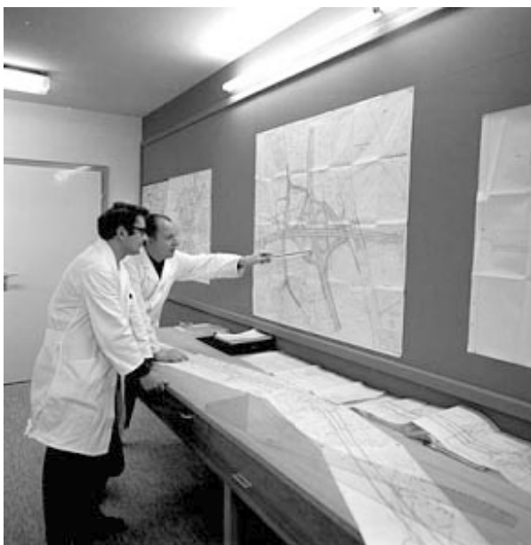
Landesstraßenbauamt Bielefeld: Bauingenieure oder Technische Zeichner vor dem Plan eines Autobahnkreuzes.

Für die Straßenbauverwaltung des Landschaftsverbands standen in den ersten Nachkriegsjahren die Beseitigung der Kriegsschäden an den Straßen und Brücken sowie der Erhalt der vorhandenen Straßensubstanz im Vordergrund. Mit dem beginnenden wirtschaftlichen Aufschwung und der Zunahme des Verkehrs stieg vor allem seit Mitte der 1960er Jahre die Zahl der Neu-, Um- und Ausbaumaßnahmen von Autobahnen, Bundes- und Landstraßen erheblich an. Der Bau und die Unterhaltung von Bundesautobahnen und Bundesstraßen erfolgten im Auftrag des Bundes. Regional von Bedeutung blieb der Ausbau der Landstraßen, der insbesondere der Erschließung verkehrsgünstig gelegener