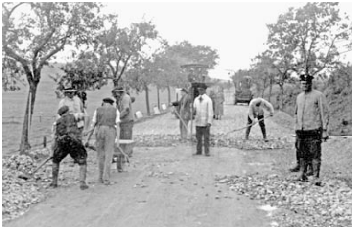
Arbeitsdienst: Einsatz einer Patientenkolonne der Provinzial-Heilanstalt Eickelborn im Straßenbau.

Besonders gravierende Auswirkungen hatten die Umwälzungen des Dritten Reiches dagegen im Bereich der Anstaltspsychiatrie: Nach dem Dogma der Rassenideologie besaßen nur arbeitsfähige Menschen ein Lebensrecht. Die Umsetzung der nationalsozialistischen Rassen- und Gesundheitspolitik in den westfälischen Provinzialheilanstalten führte zur Zwangssterilisation und Ermordung tausender Patientinnen und Patienten. Schon im Juli 1933 wurde die