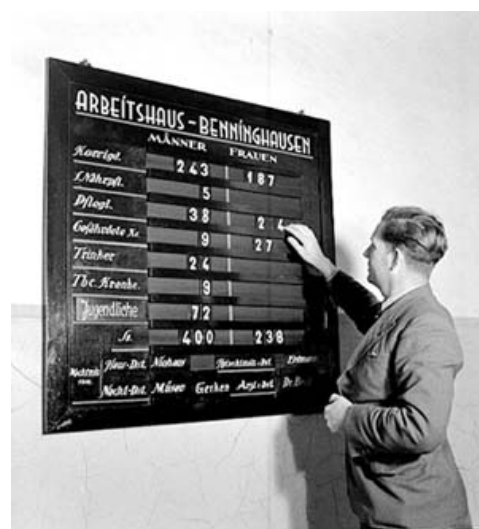
Ein Anstaltswärter an einer Belegtafel in der Landespflegeanstalt Benninghausen, dem ehemaligen Provinzial-Landarmen- und Arbeitshaus.

mit psychisch kranken und behinderten Menschen fanden in den 1950er und 1960er Jahren erste Reformen im Bereich der Psychiatrie statt. Medizinische Fortschritte führten zu einer Veränderung der Behandlungsmethoden: Erfolgreich war insbesondere die Einführung von Psychopharmaka zur medikamentösen Therapie psychischer Erkrankungen. Aus der Arbeitstherapie entwickelte sich die Beschäftigungstherapie. Zunehmend Verbreitung fand die Psychotherapie. Weiterhin gab es erste Ansätze zu einer Verbesserung der Unterbringungsverhältnisse in den Kliniken. Die großen Bettensäle wurden nach und nach aufgelöst. Wichtige Impulse für die weitere Entwicklung gingen von der allgemeinen Psychiatrie-Reform in den 1970er Jahren