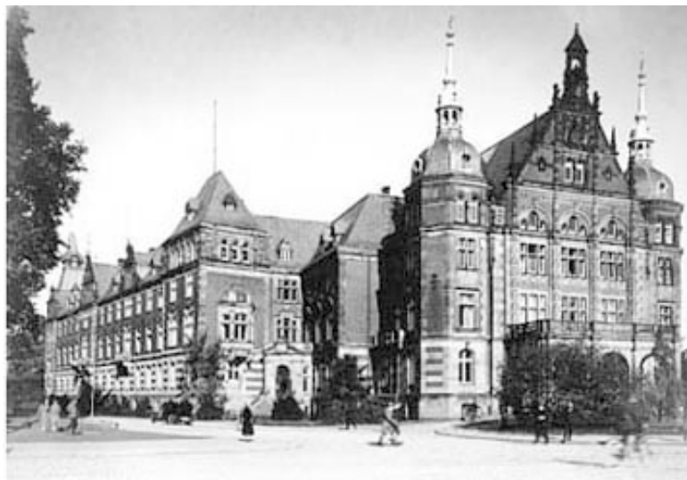
Das Landeshaus im Jahr 1928.

In der Weimarer Republik wurde die provinzielle Selbstverwaltung demokratisiert und ihre Stellung im Staat gestärkt. Mit der Einführung allgemeiner, gleicher, unmittelbarer und geheimer Wahlen veränderte sich die Zusammensetzung des Provinziallandtags grundlegend: Im September 1919 wurden erstmals sozialdemokratische Abgeordnete in den Provinziallandtag gewählt. Mit der neuen Verfassung des Freistaates