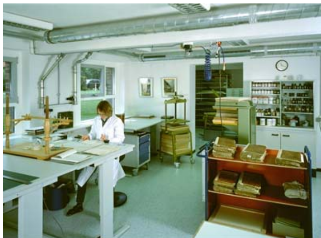
Die Restaurierungswerkstatt im LWL-Archivamt für Westfalen in der Jahnstraße in Münster.

Die bereits 1928 gegründete Landesbildstelle entwickelt sich seit den 1970er Jahren zu einer modernen Medienzentrale: Neben ihren traditionellen Aufgaben, der Sammlung historischer Bild-, Film- und Tondokumente, der Aus- und Weiterbildung von Pädagogen und der Bereitstellung von Arbeitsmaterialien für den Schulunterricht, wurde die Einrichtung zunehmend auch in der Produktion audiovisueller Medien zur Vermittlung von Geschichte und Gegenwart Westfalens aktiv. Auch die übrigen wissenschaftlichen Einrichtungen, die Ämter für Denkmalpflege, für Landes- und Baupflege bzw. für Landschafts- und Baukultur sowie das Archivamt haben ihre Tätigkeit und ihr Beratungsangebot sukzessive erweitert.