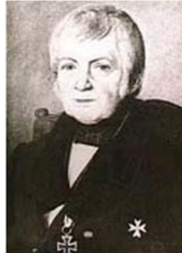
Oberpräsident und Landtagskommissar Ludwig Freiherr von Vincke (1774-1844) eröffnete 1826 den 1. Westfälischen Provinziallandtag.

Nach der Reichsgründung 1871 wurden die Befugnisse der Provinzialstände erheblich erweitert. Bereits Ende der 1860er Jahre waren auch in Westfalen die Überführung aller Provinzialinstitute in die Selbstverwaltung und die Überweisung staatlicher Zuschüsse für provinzielle Zwecke gefordert worden. Seit 1871 konnten die Provinzialstände über die Provinzialhilfskasse, die Provinzialfeuersozietät (Feuerversicherung) und den Landarmenverband entscheiden. Der Provinziallandtag wählte zudem einen Landarmendirektor, der das Landarmenwesen leitete und erster Verwaltungschef der Provinzialverwaltung wurde. Um die Provinzialanstalten und das Vermögen der Provinz zu verwalten, wurde ein durch den Provinziallandtag gewählter ständischer Verwaltungsausschuss – ein Vorläufer des heutigen Landschaftsausschusses