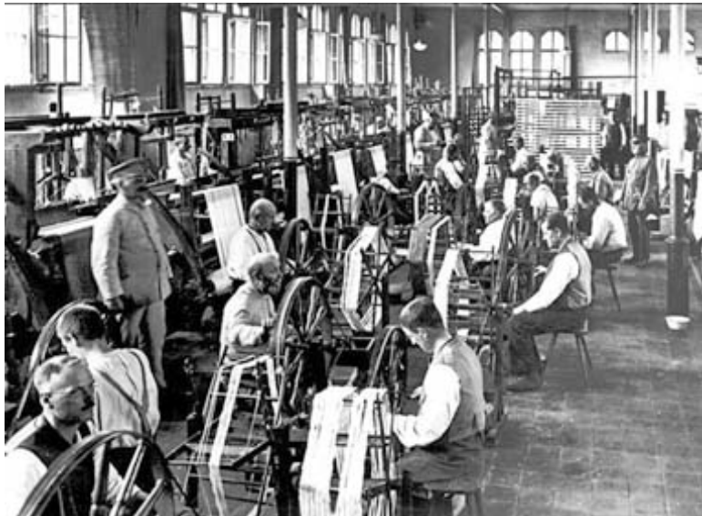
Männer beim Arbeitsdienst in der Weberei im Provinzial-Landarmen- und Arbeitshaus Benninghausen (um 1900).

Seit seiner Gründung war der gewichtigste Zuständigkeitsbereich des Provinzialverbands die Fürsorge für sozial schwache und kranke Menschen, insbesondere für psychisch kranke, geistig und körperlich behinderte, gehörlose und blinde Menschen. Bereits 1842/43 war die Provinz zum Landarmenverband erklärt worden und war damit für die Fürsorge aller bedürftigen Menschen zuständig, für die nicht die Gemeinden aufkommen mussten. Nach 1872 wurde