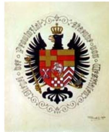
Ein Siegelentwurf für die Provinzialstände aus dem Jahr 1878.