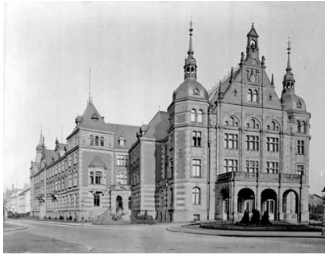
Das Landeshaus der Provinz Westfalen am Freiherr-vom-Stein-Platz um 1910.

Der Landschaftsverband Westfalen-Lippe ist ein Verband mit langer Tradition – seine historischen Wurzeln reichen bis ins 19. Jahrhundert zurück: Sein Vorgänger, der Provinzialverband Westfalen, wurde im Jahr 1886 gegründet. 1826 begann die parlamentarische Tätigkeit des Westfälischen Provinziallandtags. Das war die erste politische Gesamtvertretung Westfalens und Vorläufer der Landschaftsversammlung Westfalen-Lippe. Die Geschichte des Landschaftsverbands Westfalen-Lippe und des Provinzialverbands Westfalen ist eng mit der Entwicklung Westfalens und der Geschichte der kommunalen Selbstverwaltung verbunden.