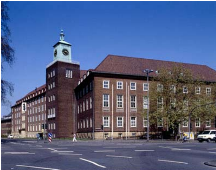
Das Landeshaus am Freiherr-vom-Stein-Platz..

Der in der Landschaftsverbandsordnung von 1953 festgeschriebene Aufgabenkatalog spiegelte das Aufgabenspektrum der früheren preußischen Provinzialverbände wider und umfasste die Bereiche Soziales, Jugendhilfe und Gesundheitsangelegenheiten, Straßenwesen, landschaftliche Kulturpflege, Landes- und Landschaftspflege sowie Kommunalwirtschaft. Nach 1953 gab es mehrere Modifikationen der Landschaftsverbandsordnung, die vor allem die Zuständigkeiten betrafen: Bereits in den 1950er Jahren