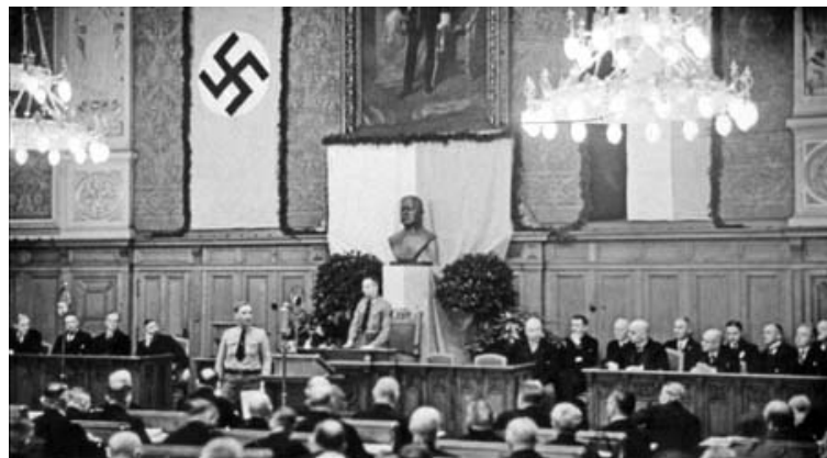
Eröffnung des 79. Westfälischen Provinziallandtags am 10. April 1933.