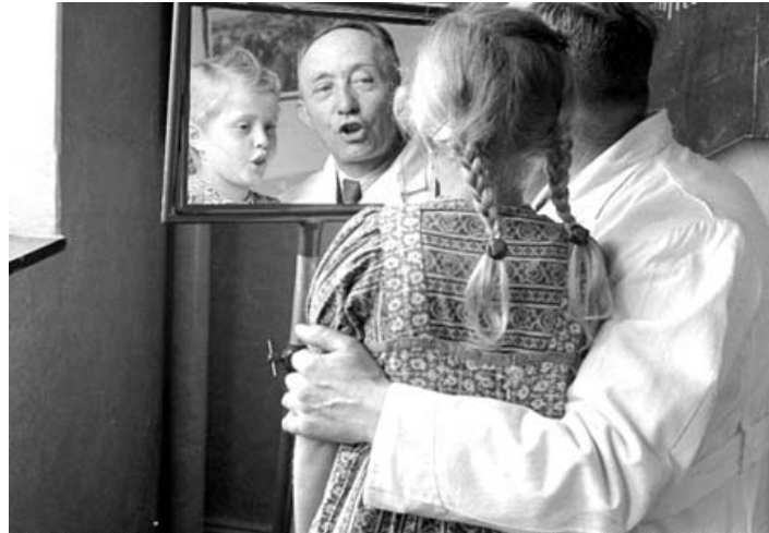
Provinzial-Taubstummenanstalt Langenhorst: Mädchen bei Artikulationsübungen vor dem Spiegel.

Bereits kurz nach Kriegsende nahm das Landesjugendamt seine Arbeit wieder auf. Im Mittelpunkt seiner Tätigkeit stand in den ersten Nachkriegsjahren zunächst die Bekämpfung der akuten Notlagen zahlreicher Kinder und Jugendlicher in der Trümmergesellschaft, die beispielsweise aus materiellem Mangel, dem Fehlen der Väter, der Zerrüttung zahlreicher Familien oder der kriegsbedingten Entwurzelung resultierten. Das Landesjugendamt sorgte für die Unterbringung alleinstehender Kinder und Jugendlicher bis zu einer Wiedervereinigung mit ihren Angehörigen in Auffangheimen. Im Jahr 1949 richtete es eine überbezirkliche Adoptionsvermittlungsstelle ein, die die aufgrund von Armut und Wohnungsnot gestiegene Zahl von Schwangerschaftsabbrüchen eindämmen sollte.