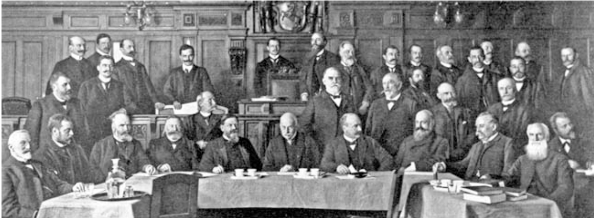
Sitzung des Provinzialausschusses im Sitzungssaal des Landeshauses der Provinz Westfalen (1905).

Durch die Reform der Provinzialverfassung seit 1875 erhielt die provinzielle Selbstverwaltung in Preußen eine neue Qualität. Mit der Einführung der neuen Provinzialordnung in Westfalen am 1. August 1886 wurde an Stelle der bisherigen Provinzialstände ein kommunaler Provinzialverband errichtet, dessen Mitglieder die kreisfreien Städte und Landkreise waren. Organe des neuen Provinzialverbands waren die Provinzialversammlung, der Provinzialausschuss und der Landeshauptmann – damit entsprach seine Verfassung bereits weitgehend der des heutigen Landschaftsverbands Westfalen-Lippe (LWL). Gewählt wurden die Abgeordneten der Provinzialversammlung durch die Parlamente der Kreise und Städte. Entsprechend änderte sich damit der Charakter des Provinziallandtags. Er entwickelte sich von einer Interessenvertretung der Stände zu einer Vertreterversammlung der Kreise und Städte. Da die Kommunalwahlen nach dem preußischen Dreiklassenwahlrecht von 1849/50 erfolgten, das die besitzende Klasse bevorzugte, setzte sich auch der Provinziallandtag bis 1918 ausnahmslos aus bürgerlich-konservativen Parteien und Mitgliedern zusammen. Ein Spiegelbild der tatsächlichen politischen Kräfte und Strömungen war das Gremium daher nicht.