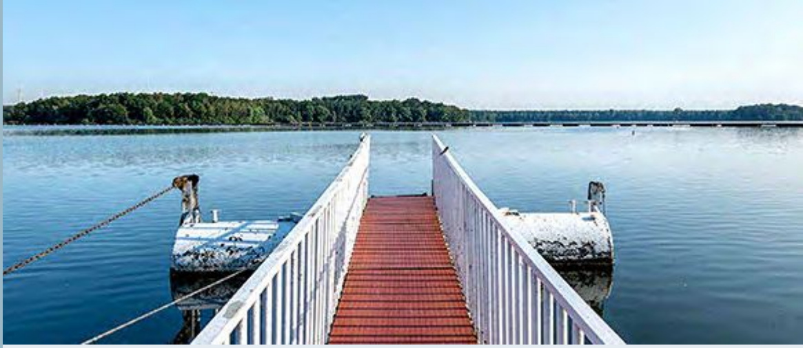
Steg am Haltener Stausee