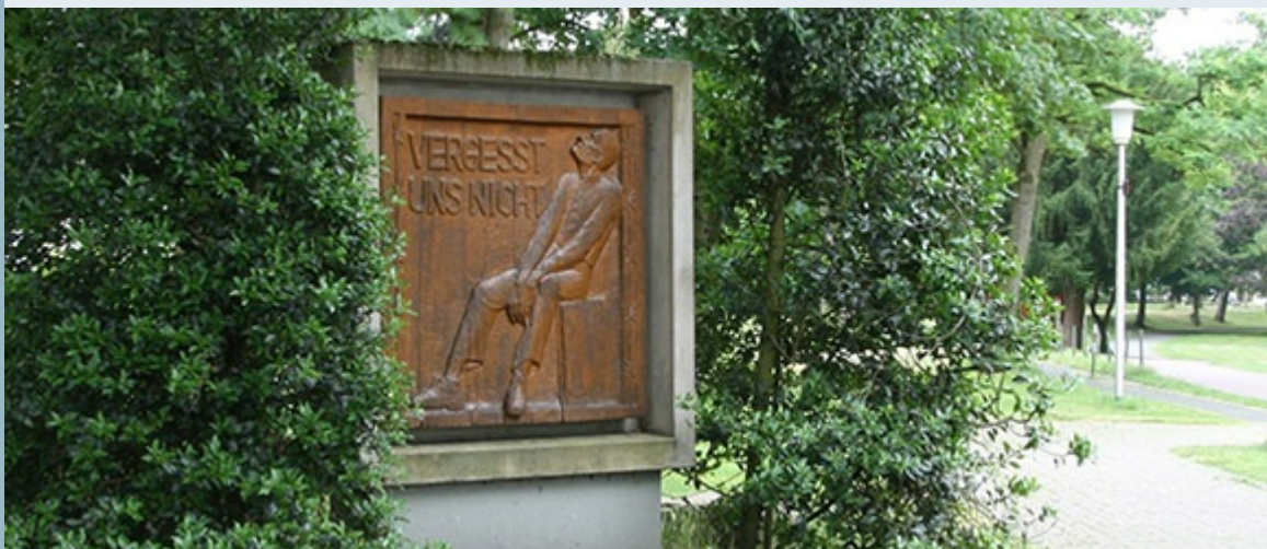
Das Heimkehrer-Mahnmal in Hamm, Foto: LWL/Otten