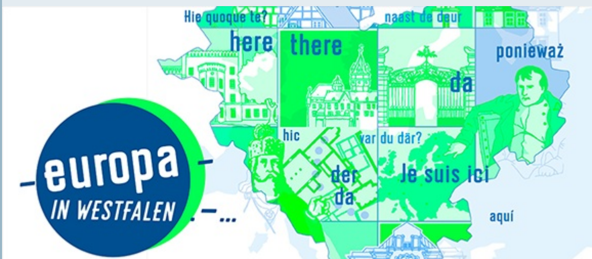
Publikation "Europa in Westfalen"

>> Weitere Informationen zur Publikation und Bestellmöglichkeit.