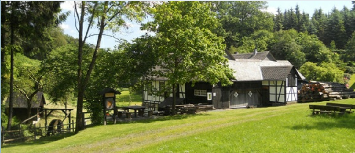
Das Sägemühlen-Museum Remblinghausen eingebettet in der Kulturlandschaft

>> Hier finden Sie Informationen und die Anmeldemöglichkeit zur Baukulturrexkursion.