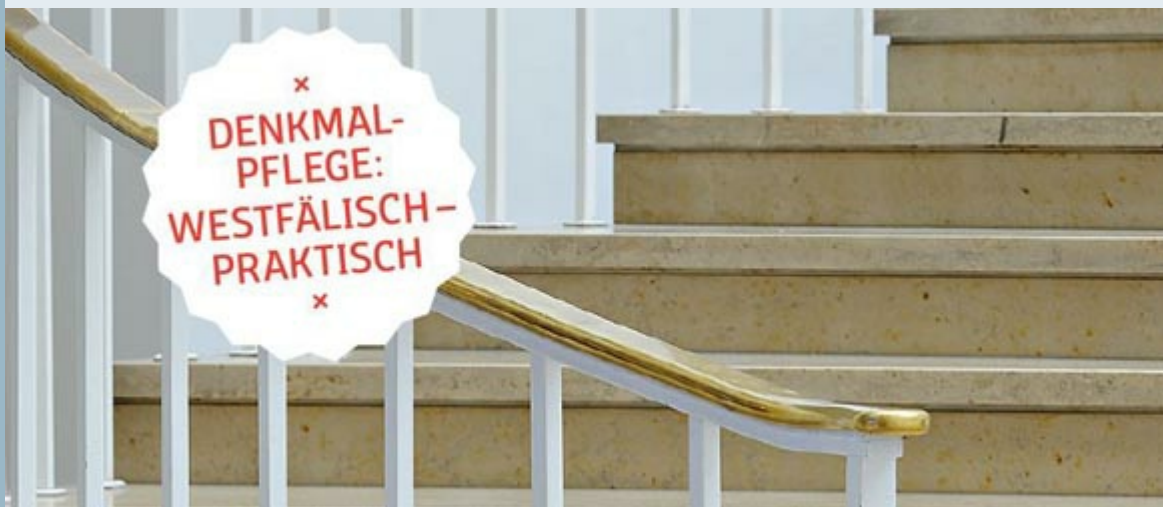
Treppenstufen in der Bürgerhalle des LWL-Landeshauses

>> Hier finden Sie weitere Informationen zum Tag des offenen Denkmals.