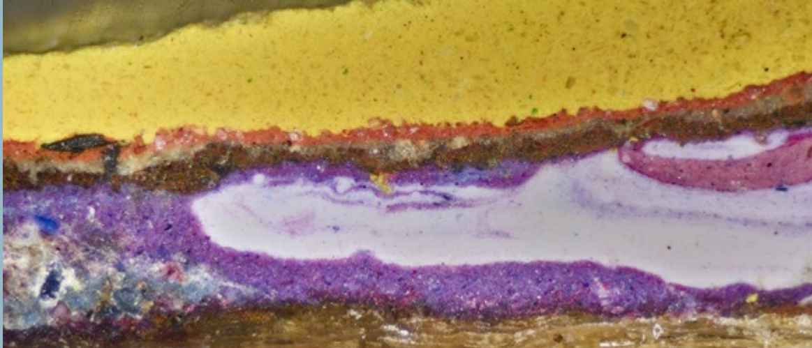
Mikroskopisch kleine Probenanschliffe von Farbfassungen werden in der Restaurierungswerkstatt des LWL angefertigt und analysiert, Foto: LWL/Dreyer

>> Hier finden Sie weitere Informationen und die Anmeldemöglichkeit zu Denkmalpflege: Westfälisch – Praktisch