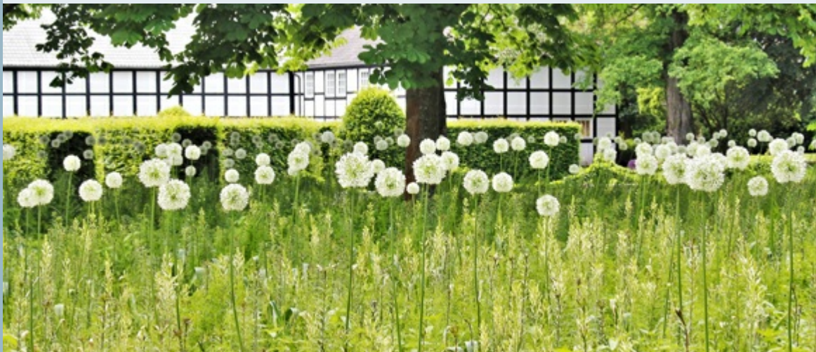
Ausschnitt aus dem Gewinner-Bild "Schneebälle im Sommer?"

>>Hier finden Sie weitere Informationen zum Online-Portal " neues-bauen-im-westen.de ".