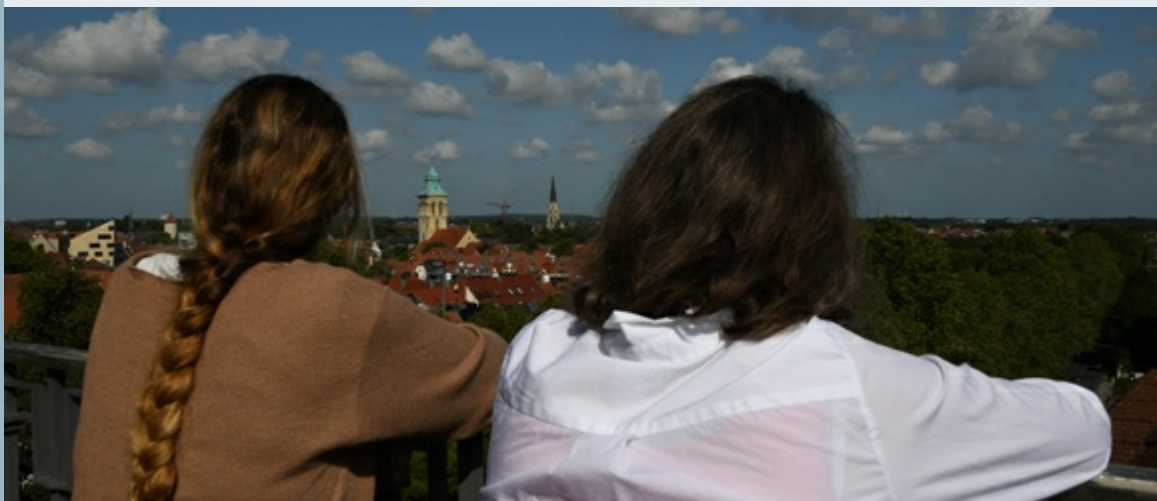
Aussicht vom Turm des LWL-Landeshauses

Vorträge unserer Expertinnen und Experten