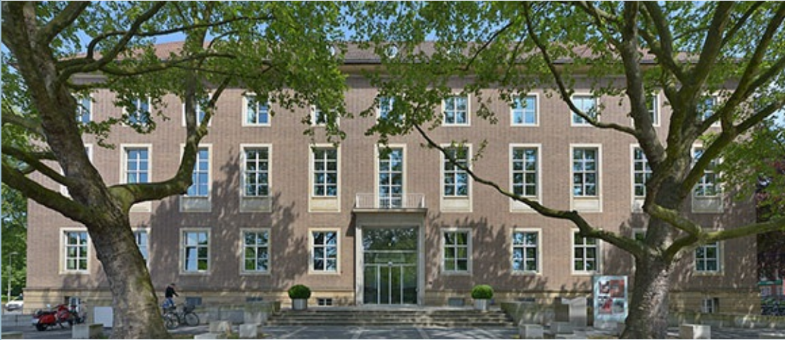
LWL-Landeshaus, Münster, Blick auf das Hauptgebäude.

>> Hier können Sie die Zeitschrift "Denkmalpflege in Westfalen-Lippe" als PDF herunterladen.