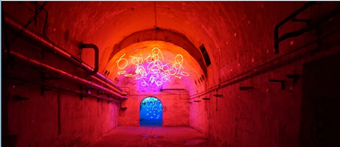
Keith Sonnier, Tunnel of Tears. Zentrum für internationale Lichtkunst Unna.

>> Hier finden Sie mehr Informationen zu "Architektur im Kontext".