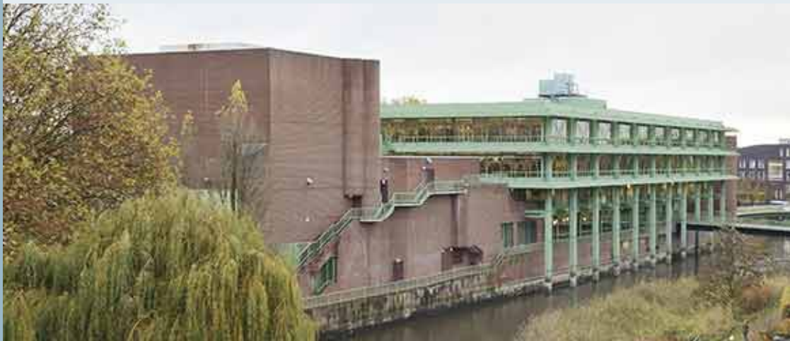
Das Rathaus in Bocholt.

>> Hier finden Sie mehr Informationen zum Tag der Gärten und Parks 2017.