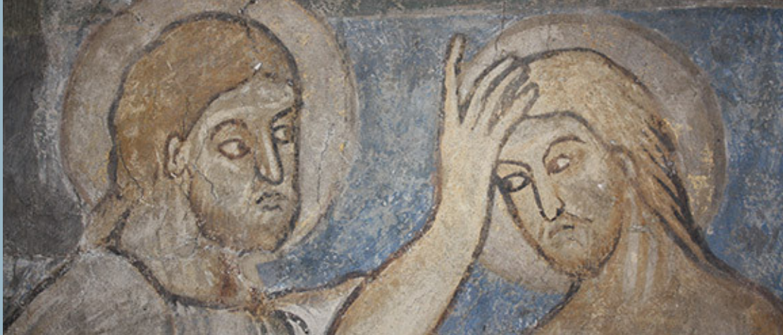
Schmallenberg-Berghausen, kath. Kirche St. Cyriacus, Wandmalerei, Taufe Christi, Ausschnitt.