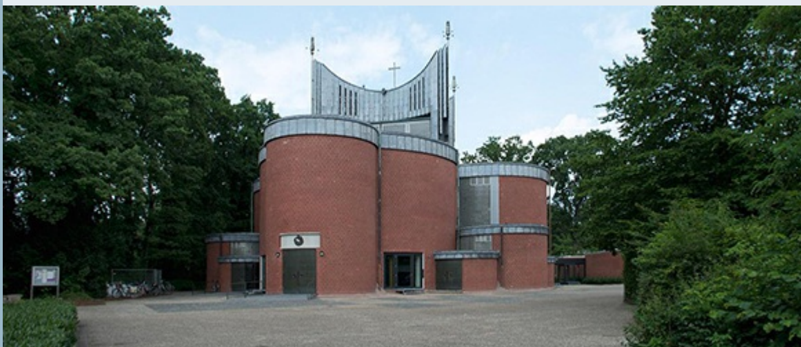
Die ehemalige St. Johanneskirche nach der Umnutzung zum Gemeindezentrum.

Vorträge unserer Expertinnen und Experten