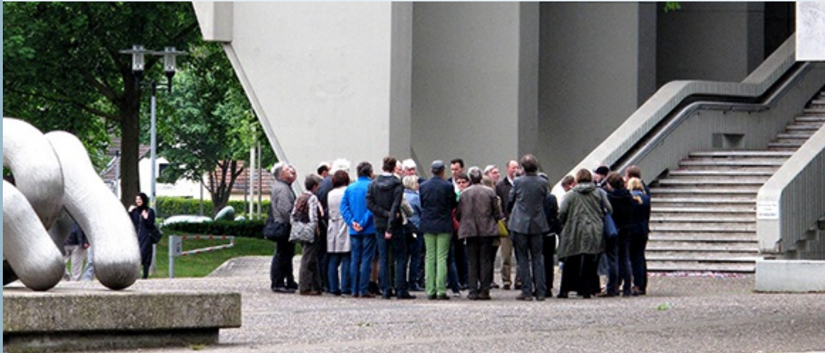
Beim 7. Westfälischen Tag für Denkmalpflege 2016 führten die Exkursionen zu Baudenkmalern der Moderne 1960+, z.B. zum Rathaus der Stadt Marl.

>>Hier finden Sie weitere Informationen zur Präsentation des Kulturlandschaftlichen Fachbeitrags.