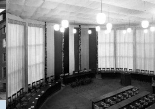
Abb. 8: Neues Landeshaus, Lichthof, 1950er Jahre. Abb. 9: Neues Landeshaus, Sitzungssaal des Landesparlamentes, 1950er Jahre.