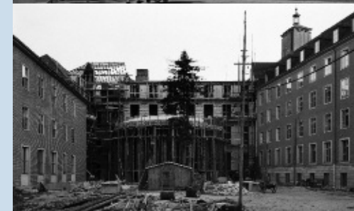
Abb. 5: Flügel an der Fürstenbergstrasse 15–17, um 1952.