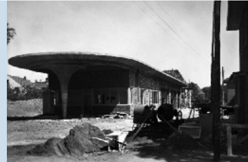
Abb. 10: Neues Landeshaus, Tankstelle des Garagenhofes, um 1951.

Erweiterungsbau an der Piusallee 1–3 und entschied sich gegen einen verglasten Stahlskelettbau. Nicht nur das Äußere, auch Innenstruktur und Ausstattung des Landeshauses dokumentieren auf anschauliche Weise einen zeittypischen Verwaltungsbau der frühen 1950er Jahre. Bis auf den Hauptbau, der in stärkerem Maße durch die Innenstruktur des Vorgängerbaus bestimmt wird, wählte March für die Gebäudeflügel eine für den Verwaltungsbau seit dem frühen 20. Jahrhundert sich durchsetzende Grundrisslösung aus breitem Mittelflur und zwei gleich tiefen Raumfluchten mit Büroräumen. Wandfeste Ausstattung konzentrierte er auf Flure und Treppenhäuser, wo die Türöffnungen mit Rahmen aus hellem Kunststein verkleidet und die Böden bzw. Treppen ebenfalls mit Kunststein- oder aber Natursteinplatten belegt sind. Der programmatische Duktus des Klaren und Schlichten in Verbindung mit einer hohen Qualität von Material und bautechnischer Ausführung bestimmt nicht nur das Äußere, sondern auch die Gestaltung aller Innenräume des Landeshauses.