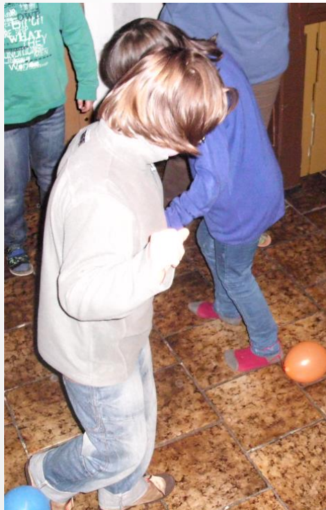
... in der Disco