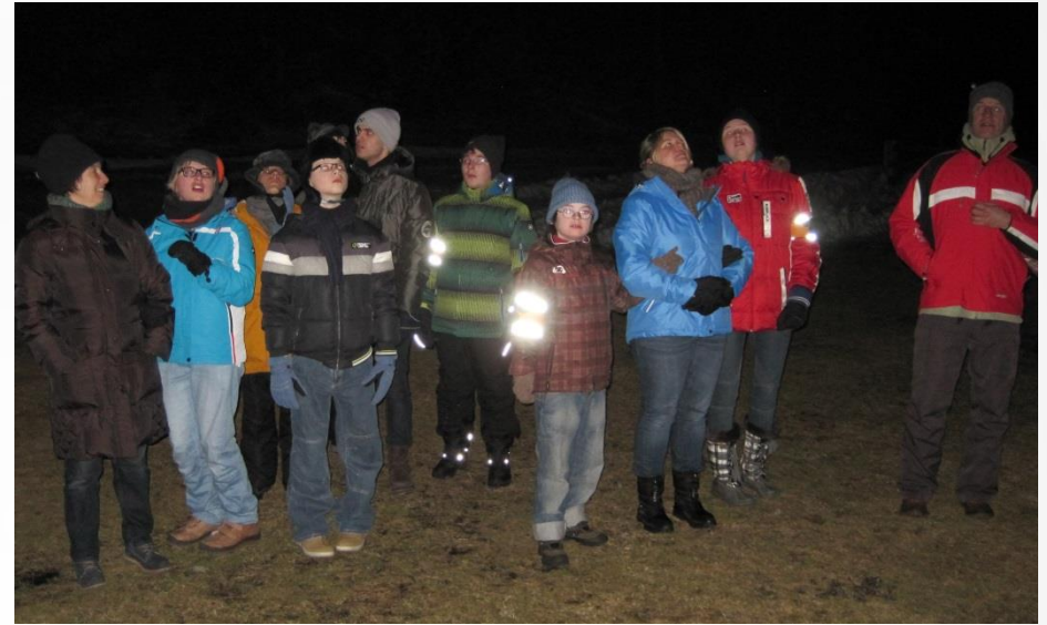
... bei der Nachtwanderung