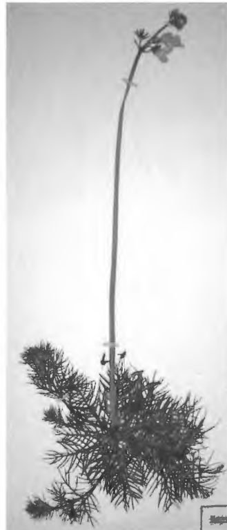
Abb. 1: Hottonia palustris (Wasserfeder), gefunden von Arno Roschewitz 1966 bei Warendorf nahe der Ems