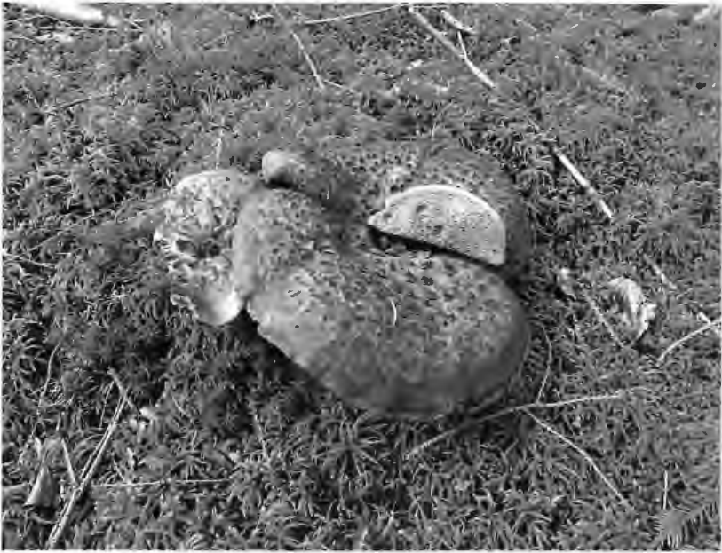
Abb. 6: Frisches Exemplar des in NRW sehr seltenen Habichtspilzes Sarcodon imbricatus , im September 2010 bei Egloffstein in der Fränkischen Schweiz gefunden.