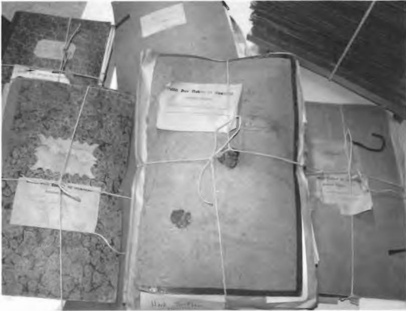
Abb. 7: Das Pilzherbarium von Conrad Beckhaus, das vermutlich weitgehend vollständig in Münster (MSTR) vorhanden ist, wurde über viele Jahrzehnte in unterschiedlichen Mappen gelagert.