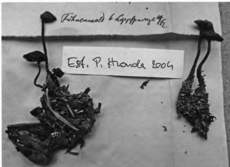
Abb. 4: Präparat des Ohrlöffelstachelpilzes, Auriscalpium vulgare , gefunden von Beckhaus in „Föhrenwald bei Lippspringe im September 1862, überprüft von P. Honda 2004; MSTR P 6798.

2004 hat Peter Honda einige Präparate der Gattung Hydnum (Stoppelpilze) nachbestimmt (Nos. 6791 ff.); Abb. 4 zeigt das Präparat eines von Honda überprüften Ohrlöffelstachelpilzes.