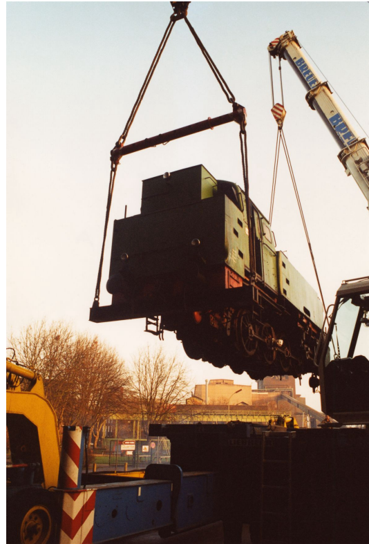
Dampflok am Haken, 1994.

Von Beginn an verfolgte das Westfälische Industriemuseum das Ziel, Maschinen, Lokomotiven oder Schiffe wieder funktionstüchtig zu machen und Schauproduktionen einzurichten. Das verlangt neben den entsprechenden Exponaten auch nach Ersatzteilen wie Motoren, Transmissionsriemen, Nieten, Dampfkessel. Die museumseigene Fachwerkstatt entwickelte sich vor diesem Hintergrund zum überregional anerkannten Kompetenzzentrum Dampf . Dampfmaschinentechnik und das dazu gehörende Know-how sammelt das Museum nicht von ungefähr: ohne Dampfkraft keine Industrialisierung. Vorrangig zu nennen sind die Dampffördermaschine auf der Zeche Hannover (Baujahr 1893), im Ruhrgebiet die älteste am Originalstandort erhaltene, und die von der Bottroper Zeche Franz Haniel stammende Dampffördermaschine auf der Zeche Nachtigall (Baujahr 1887) sowie die