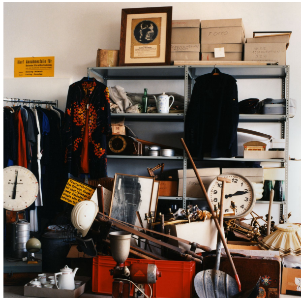
Dinge im Westfälischen Industriemuseum – Exponatannahmestelle, 1991.

Im Museum begegnen Besucher den Dingen vorrangig in Ausstellungen – auch im Industriemuseum. Die Ausstellungen sind sozusagen die Bühnen, auf denen die Dinge als historische Zeugnisse tragende Rollen innehaben und vergangene Lebenswirklichkeiten interpretieren. Ausstellungen und Inszenierungen zeigen nicht die Realität, auch wenn die Dinge real sind. Sie spiegeln sie allenfalls in Ausschnitten wider. Die Zeugenschaft der Dinge und ihre Inszenierungen sind vielschichtig. Sie können verständlich oder missverständlich, wahr oder falsch, umfassend oder karg, vertraut oder befremdlich sein. Eigenheiten der Ausstellungsmacher und Zeitgeist schwingen allenthalben mit. Vieles entwickelt sich im Dialog mit dem Betrachtenden. Die Frage von Ernst Bloch 1 - „Schauspielern denn sogar die Dinge?“ – bringt all dies auf den Punkt.