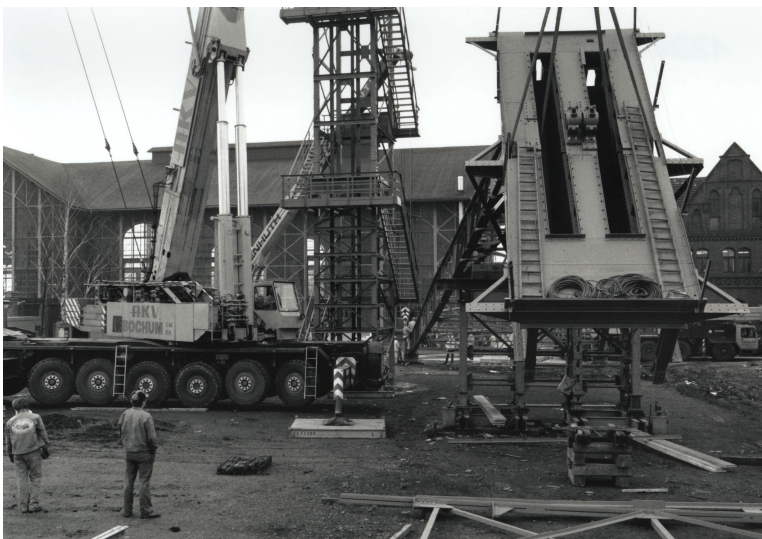
Aufstellen des Fördergerüsts auf der Zeche Zollern, Schacht II, 1987.

Als zentrale Exponate wurden die Industriedenkmäler und – wenn vorhanden – überliefertes Originalinventar sichergestellt. Glücksfälle dieser Art waren die Maschinenhalle der Zeche Zollern II/IV, in der unter anderem eine der ersten elektrischen Fördermaschinen der Welt erhalten ist, die Ziegelei Lage mit dem noch kompletten Maschinenstrang zur Ziegelherstellung und die Henrichshütte in Hattingen, bei der Maschinen und Geräte bereits in der für die Betroffenen schmerzhaften Phase der Betriebschließung übernommen wurden. Ganz aktuell erfolgt dort die Bergung von Exponaten aus dem zum Abriss anstehenden Stahlwerk und ihre Überführung auf das Museumsgelände.