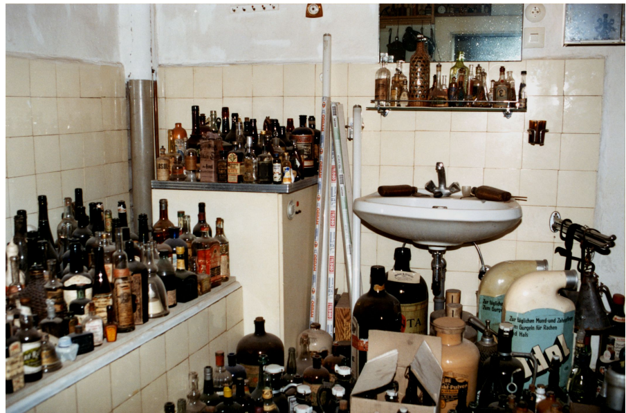
Vor Übernahme der Sammlung Schwiezer, 1994.

Die Branchensammlungen sind geprägt durch die zahlreichen Betriebsstilllegungen als Folge des unaufhaltsamen Strukturwandels in den Anfangsjahren des Westfälischen Industriemuseums: Zechen wurden geschlossen, Textilbetriebe und Glasfabriken wanderten ab. In sehr kurzer Zeit mussten wir bei diesen Anlässen, gewissermaßen auf Zuruf, zahlreiche sonst