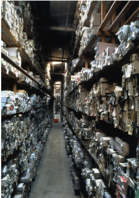
Blick in die Etikettenfabrik Saatweber & Sieper in Wuppertal, 1995.