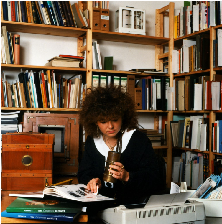
Bei der Objektdokumentation, 1991.

gut 15.000 Datensätze vor. Das Projekt Inventarisierung und Dokumentation mit zusätzlich eingerichteten Stellen musste jedoch leider angesichts der schwierigen Finanzsituation der öffentlichen Hand bereits nach zwei Jahren wieder auf Eis gelegt werden. Dadurch werden der weitere Aufbau der Datenbank und mit ihr die inhaltliche Erschließung der Sammlung erheblich verlangsamt.