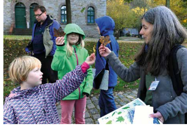
Die Zechen-Safari ist ein Angebot für kleine und große Entdecker mit Spaß und Interesse an der Natur.

Buchen Sie unsere Naturprogramme auch für Schulklassen, Kindergärten, Betriebsausflüge, Geburtstage oder Seniorengruppen! Kosten: ab 70,00 EUR plus Museumseintritt