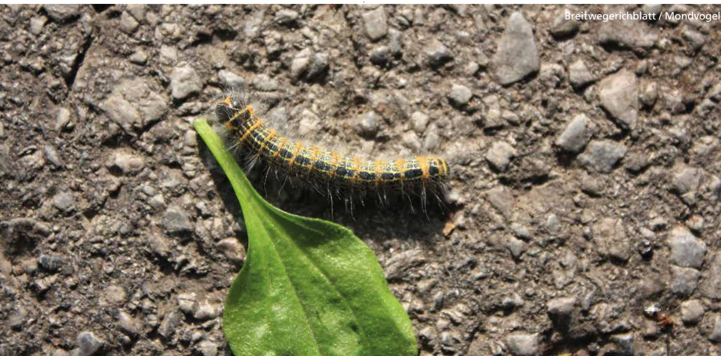
Breitwegerichblatt / Mondvogel