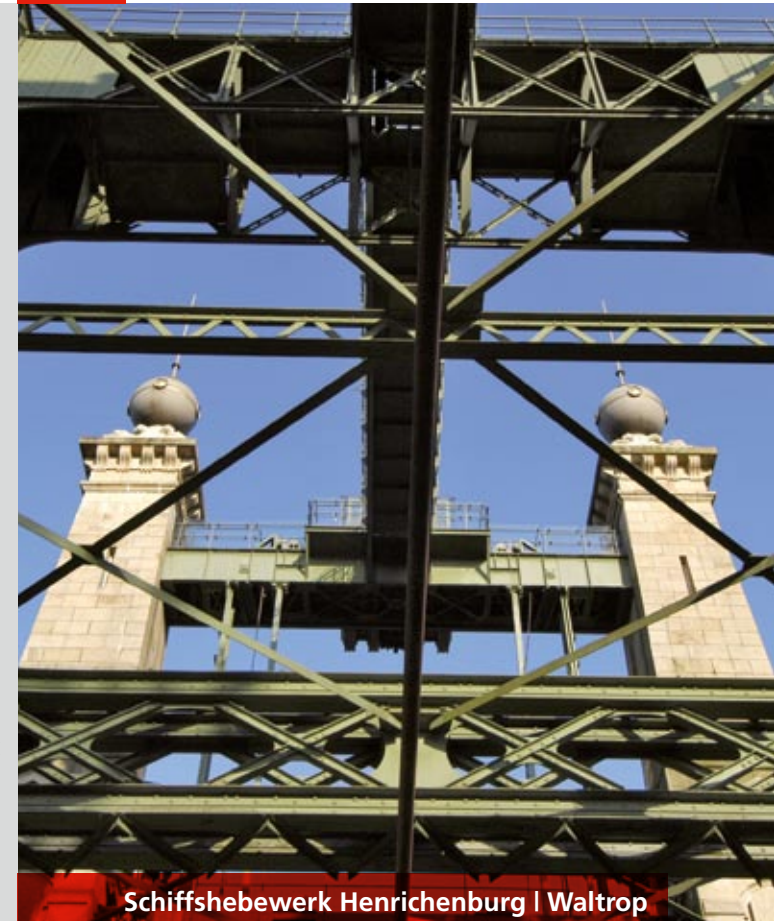
Schiffshebewerk Henrichenburg | Waltrop