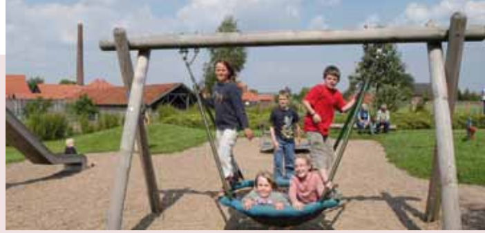
Spielplatz am Museumscafé