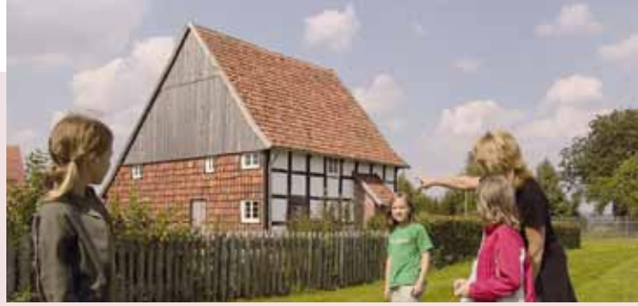
Vor dem Zieglerkotten