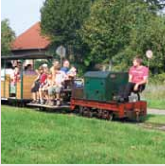
Fahrten mit der Feldbahn