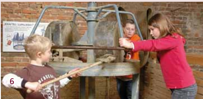
So funktioniert der Kollergang

Lerninhalte: Schüler- und handlungsorientiertes Erkunden der Maschinenziegelei, handlungsorientiertes Erkennen der Mechanismen der Maschinen an Experimentierstationen, aufmerksames Zuhören, Gruppenarbeit