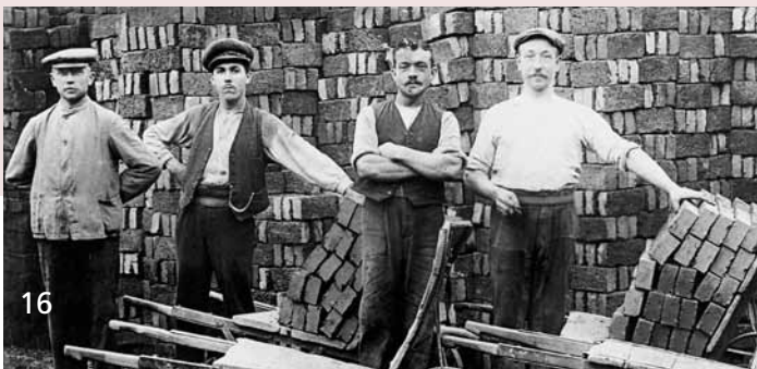
Lippische Ziegler um 1920

Diese Führung bietet sich speziell bei schlechtem Wetter an und ist weitgehend barrierefrei.