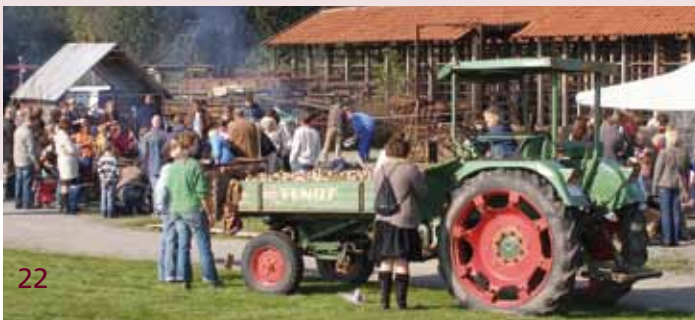
Oldtimertreffen im Ziegeleimuseum

Bitte nehmen Sie mindestens 14 Tage vor dem geplanten Besuch mit uns Kontakt auf. Sie bekommen von uns eine schriftliche Bestätigung mit weiteren Informationen zu Ihrer Buchung.