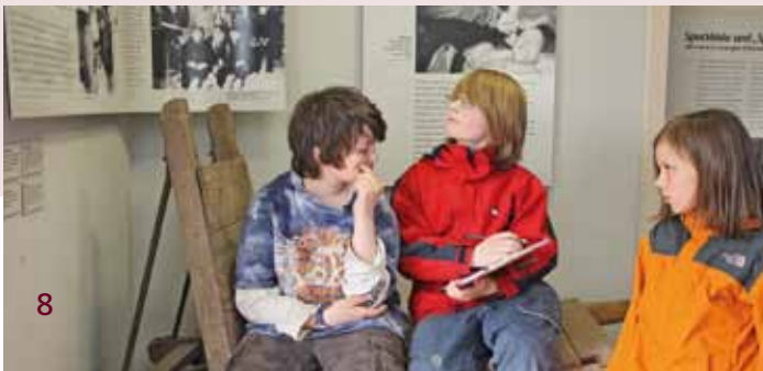
Erkunden der Dauerausstellung

Lerninhalte: Schüler- und handlungsorientiertes Erkunden des Museums, Förderung der Wahrnehmungs- und Orientierungsfähigkeit sowie motorischer und kreativer Fertigkeiten