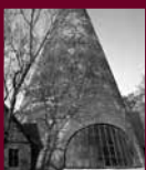
Glashütte Gernheim Petershagen