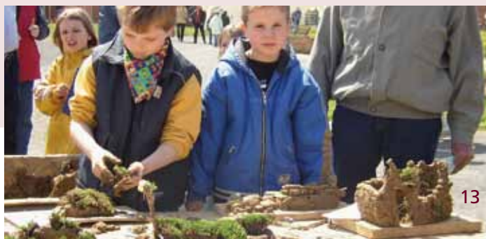
Stadt aus Lehm

aus Lehm. Auch die alten Fachwerkhäuser in unseren Regionen sind mit Lehm gebaut. Die Kinder bauen eine große Stadt aus Lehm. Gemeinsam planen sie, was alles zu ihrer neuen Metropole dazugehört.