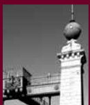
Schiffshebewerk Henrichenburg Waltrop