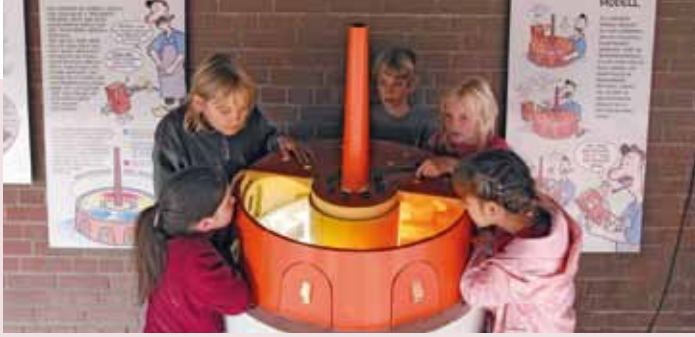
Modell des Ringofens