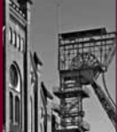
Zeche Zollern Dortmund