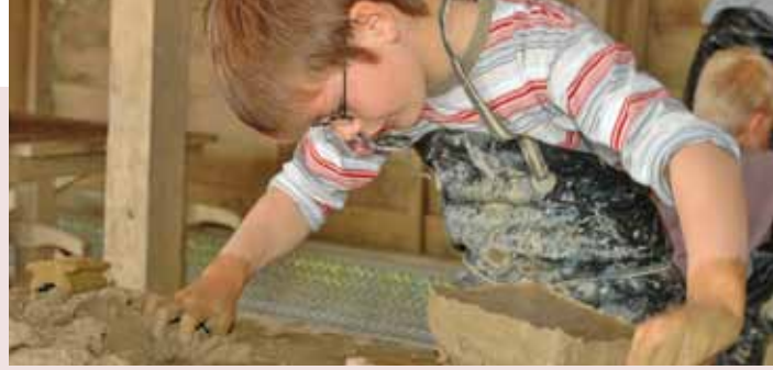
Ziegelproduktion in Handarbeit

Wir sind gerne bereit, auch mehrtägige museumspädagogische Programme und Übernachtungsbesuche individuell für Ihre Schulklasse auszuarbeiten. Bitte sprechen Sie uns an.