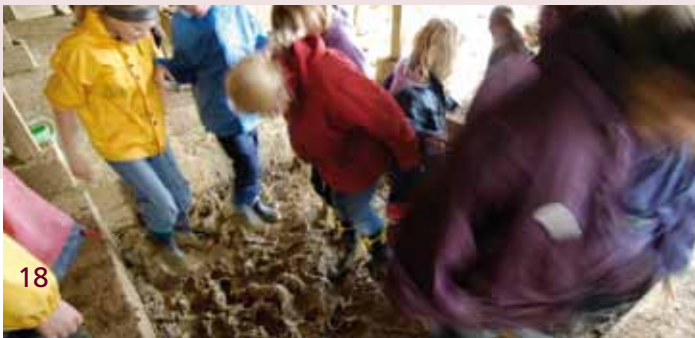
Spaß in der Maukegrube

Die entsprechenden Programme können im Museum abgefragt werden. Unser Museumspersonal berät Sie gerne.