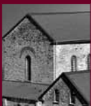
Zeche Nachtigall Witten