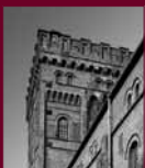
Zeche Hannover Bochum