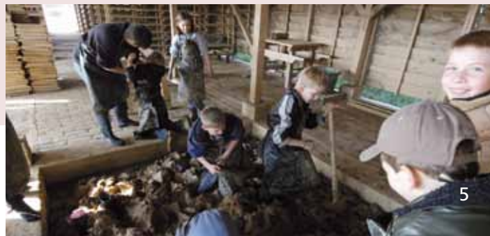
In der Maukegrube

Lerninhalte: Erlebnis- und problemorientiertes Handeln, Umgang mit authentischem Material, Teamwork, Erkennen von Abläufen in der Arbeitswelt