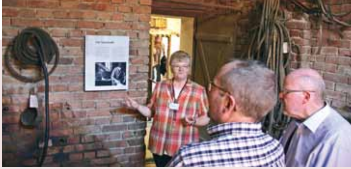
Führung im Maschinenhaus