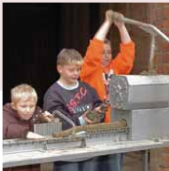
Modell der Strangpresse