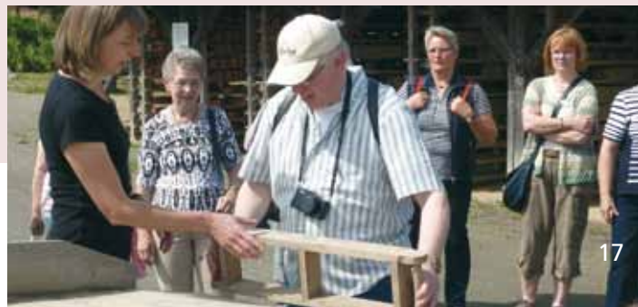
Führung für Senioren

Auf Anfrage kann dieses Programm auch für die jeweilige Sonderausstellung gebucht werden.