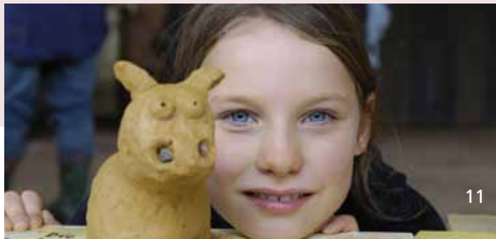
Kindergeburtstag im Industriemuseum

Für die Geburtstagsgäste können Sie ein Picknick mitbringen oder Speisen und Getränke im Café „Tichlerstoben“ bestellen (s. Seite 21).