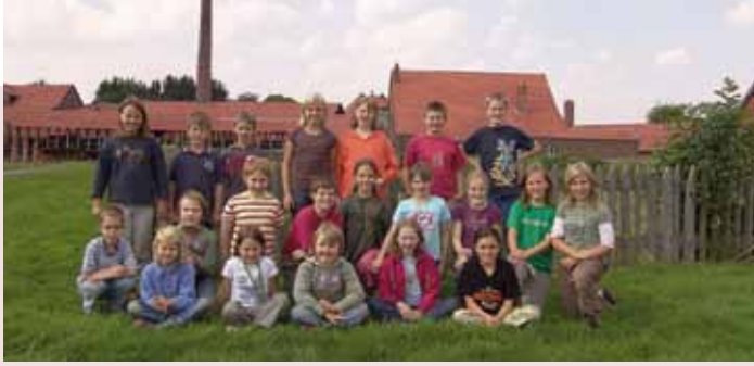
Klassenfoto vor historischer Kulisse