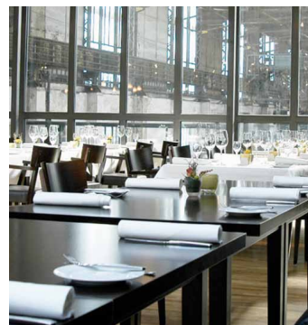
Restaurant HENRICH'S, LWL-Industriemuseum