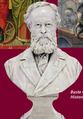
Buste van Alfred Krupp