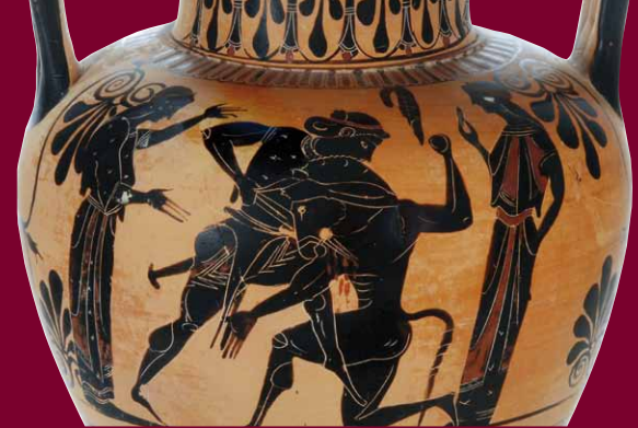
Theseus doodt de Minotaurus, amfoor (detail), Martin von Wagnermuseum van de Universiteit Würzburg

Hoewel de helden uit het verleden en uit het heden eeuwen van elkaar verwijderd zijn, zult U toch veel overeenkomsten ontdekken. En U zult verstand staan: meer dan 800 waardevolle objecten uit heel Duitsland, uit naburige landen in Europa en uit overzeese gebieden hebben wij ten tonele gevoerd. Het spectrum loopt uiteen van de uitrusting van een ridder tot de jas van commissaris Schimanski uit de televisieserie Tatort, van een 2000 jaar oude zuigfles tot de zilveren doos van Winnetoe. Van