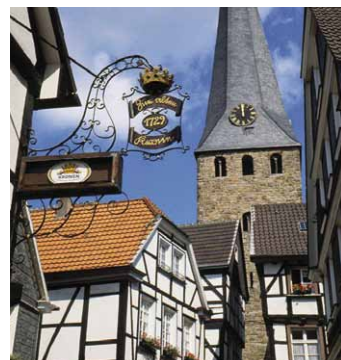
Historisch centrum met kerktoren van de St.-Georgius