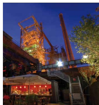
Henrichshütte Hattingen 's avonds, foto: A. Specht, www.fotorevier.net