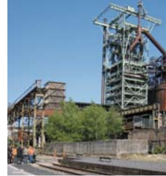
Henrichshütte Hattingen, LWL-Industriemuseum