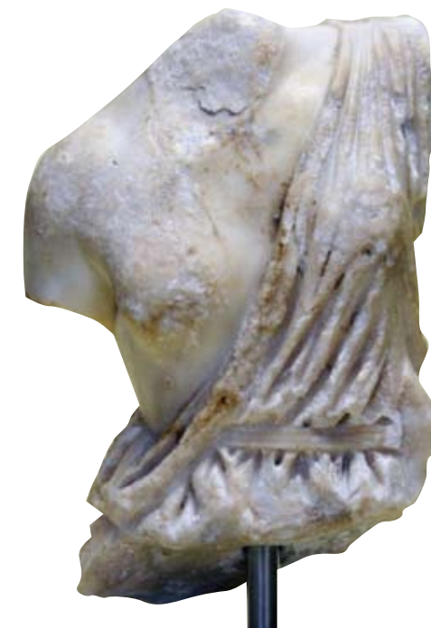
Torso einer Amazone, Sammlung Antiker Kleinkunst der Friedrich Schiller Universität Jena, Foto: D. Graen.

Dokumentation der interdisziplinären Fachtagung „Die Helden-Maschine. Zur Tradition und Aktualität von Helden-Bildern“, 24 meist farbige Abb., ca. 200 Seiten, Hardcover, 19,95 €