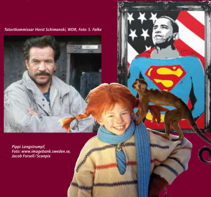
Tatortkommissar Horst Schimanski, WDR