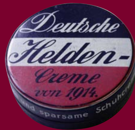
„Helden-Creme“, Landesmuseum Württemberg, Stuttgart

Wir erzählen Ihnen spannende Geschichten von großen und kleinen Heldinnen und Helden, von Machern und Medien, mutigen Rittern, religiösen Vorbildern,