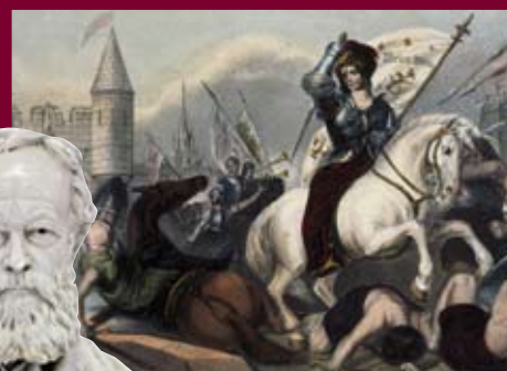
Jeanne d'Arc in der Schlacht, Lithographie aus dem 19. Jh.