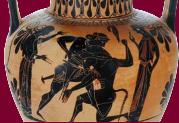
Theseus tötet den Minotaurus, Amphora (Ausschnitt) Martin von Wagner Museum der Universität Würzburg, Foto: P. Neckermann

Obwohl Jahrhunderte die Helden von einst und jetzt trennen, werden Sie viele Gemeinsamkeiten entdecken. Und Sie werden staunen: Über 800 wertvolle Exponate aus ganz Deutschland, den europäischen Nachbarlän-