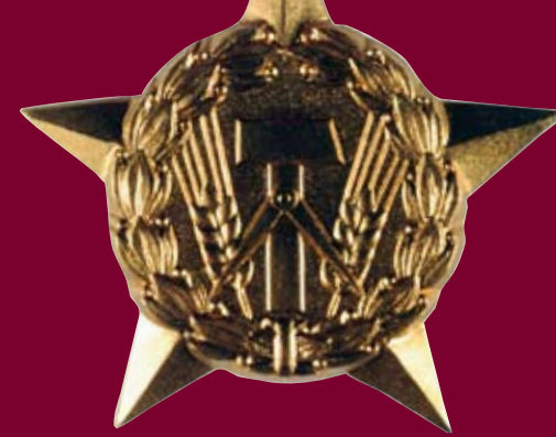
DDR-Orden: „Held der Arbeit“ mit Bandschnalle (Ausschnitt), LWL-Industriemuseum

Was junge Menschen heute mit dem Thema Helden verbinden, zeigen Arbeiten von Schülern, die in die Ausstellung integriert sind. Das Gesamtergebnis des begleitenden Schulprojektes „HELDEN-Werkstatt“ ist in einer eigenen Schau auf der Henrichshütte zu sehen.