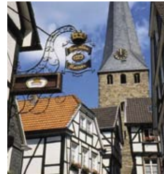
Stadtsicht Hattingen, Altstadt mit Kirchturm von St. Georg, Foto: Ruhr Tourismus GmbH