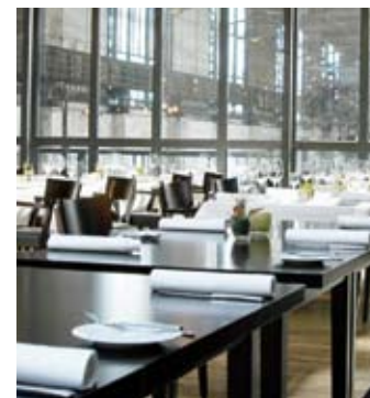
Restaurant HENRICHS, LWL-Industriemuseum