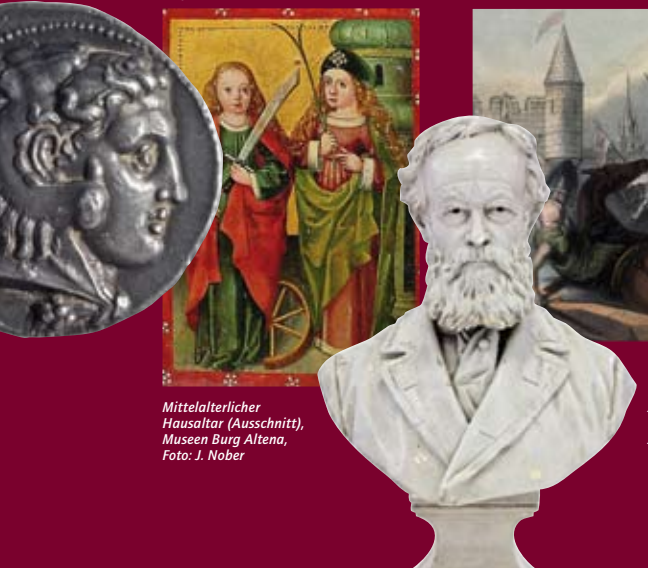
Mittelalterlicher Hausaltar (Ausschnitt), Museen Burg Altena