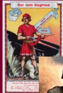
„Der rote Siegfried“, Ansichtskarte, LWL-Industriemuseum