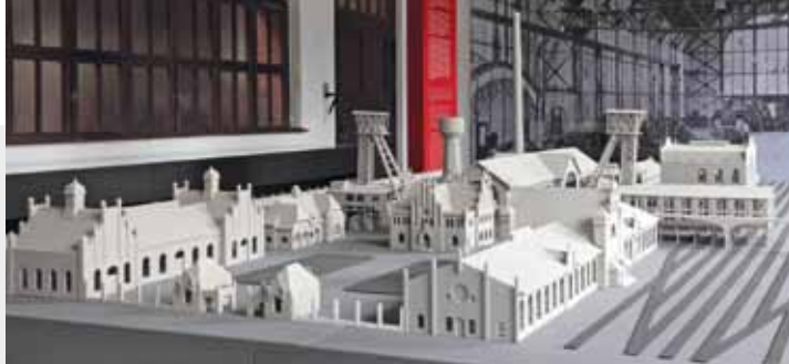
Modell der Zeche Zollern