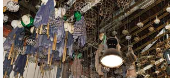
In der Waschkäue