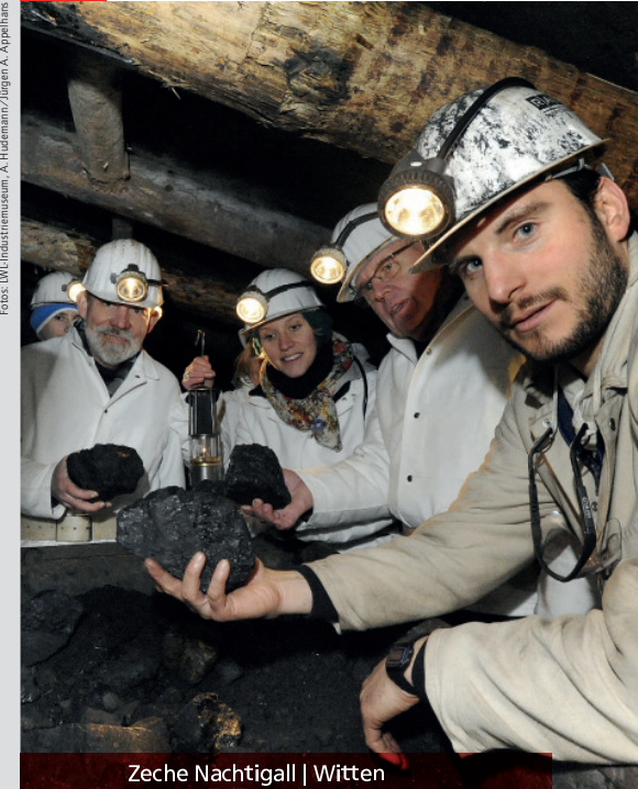
Zeche Nachtigall | Witten