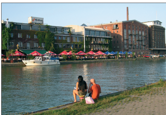
Abb. 1: Nördliche Uferpromenade Die Außengastronomie von Hot Jazz Club, Café Med und Großer Freiheit (links) sowie die erhaltene Industriearchitektur der umgebauten, ehemaligen Getreidespeicher (heute Atelierspeicher mit 32 Künstlerateliers, städtischer Ausstellungshalle für zeitgenössische Kunst und weiteren Veranstaltungs- u. Ausstellungsräumen, 3. Gebäude v. l.) tragen zum attraktiven Hafenflair des Kreativ-Kais bei. Nur wenige hafentypische Relikte zeugen heute noch von der industriegeschichtlichen Vergangenheit.

Abb. 2 zeigt die aktuellen, erdgeschossbezogenen Nutzungsstrukturen am Stadthafen I. Während der südliche Bereich an der Straße „Am Mittelhafen“ trotz zunehmender kreativer und sonstiger Dienstleistungen immer noch eher durch hafentypisches Gewerbe und Energieversorgungseinrichtungen der Stadtwerke geprägt ist, hat sich der nördliche Teil um den Hafenweg seit 1997 umfassend gewandelt (Tab. 1): Speditionen, Lager und Großhandel sowie Produzierendes Gewerbe sind fast vollständig verschwunden; 14 verschiedene Gaststätten mit Außengastronomie haben an der Uferpromenade statt dessen zwischen den Jahren 2000