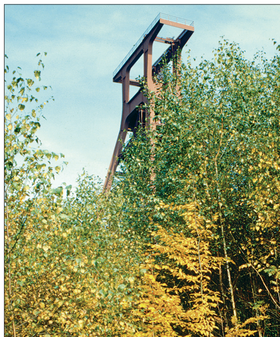
Abb. 2: Industriewald Zollverein