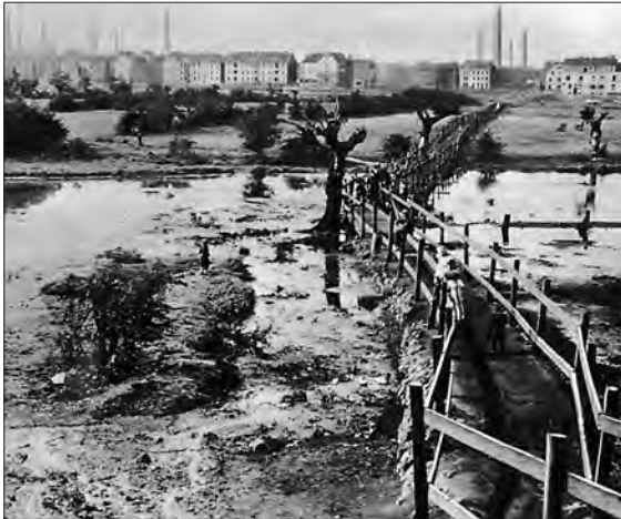
Abb. 2: Die Emscher während der „Blüte“ der Industrialisierung

Die Emschergenossenschaft betreut heute insgesamt 343 km Gewässerläufe, davon sind über 200 „geschlossene Kanäle“.