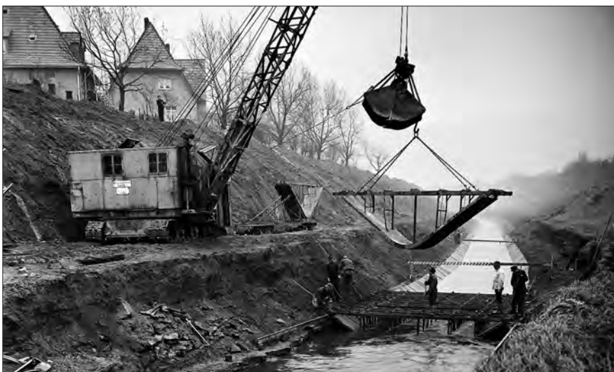
Abb. 3: Frühere Kanalisierung der Emscher mit Betonschalen

schen über 100 – Pumpwerken erst wieder herausgepumpt werden muss, damit es weiter fließen kann. In diesen „Poldern“, die insgesamt 37 % der Region ausmachen und stellenweise 20 m unter dem ursprünglichen Oberflächenniveau liegen, kam es durch die Fäkalabwässer zu Fäulnisbildungen, bei denen die entstehenden Geruchsbe-