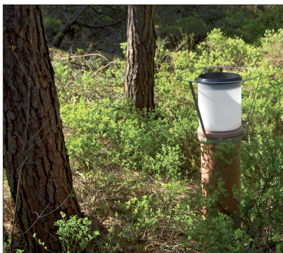
Abb. 1: Waldmessstation mit offenem Regen-sammler

Im Riesenbecker Osning, so der Lokal-name des nordwestlichen Ausläufers des Teutoburger Waldes, wurden bereits in den Jahren 1985 – 1988 Messungen zum Säureeintrag in ein Kiefernökosystem durchgeführt. In einer Waldmessstation (15 offene Regensammler, Abb. 1) wurde der Waldniederschlag als Kronentraufe aufgefangen, in einer nahegelegenen Freilandmessstation (vier offene Regen-sammler) der Freilandniederschlag ohne Beeinflussung durch die Vegetation. In wöchentlicher Beprobung wurde das Niederschlagsvolumen (in ml) gemessen und unter Berücksichtigung der Auffang-fläche der Regensammler in mm umge-rechnet. Die „freie Säure“ ( H^+ -Ionen) wurde über den pH-Wert ermittelt, der allein aber kein Maß für die Ökosystem-