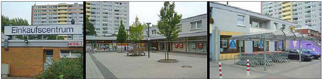
Abb. 2: Stabilisierung der Nahversorgung durch Ansiedlung eines Lebensmitteldiscounters mit Hilfe der Wohnungsgesellschaft in Dortmund-Löttringhausen (Quelle: Beckmann 2007, S. 14)

zur Ansiedlung von Nahversorgungsanbietern, um die Standortqualität in ihren Wohnanlagen zu verbessern.