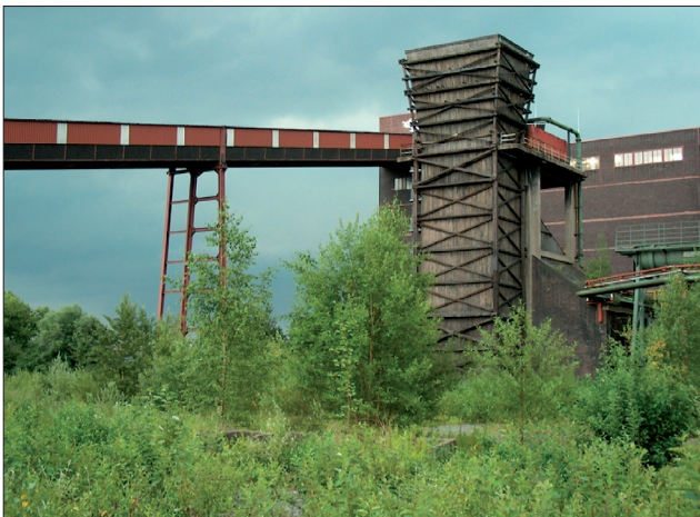
Abb. 2: Industriewald Hansa

u. a. das Potenzial, zumindest zwischenzeitlich für die Anwohner als gestaltete parkähnliche Freiflächen oder Stadtnatur zur Verfügung zu stehen. Beobachtungen und Befragungen der Bewohner ergaben allerdings, dass manche Flächen, obwohl sie schon offiziell als „postindustrielle Stadtnatur“ freigegeben sind, kaum genutzt werden. Eine neuere Studie sollte daher herausfinden, warum die Nutzung der Flächen durch die in angrenzenden Quartieren lebende Bevölkerung mit meist mehrheitlich türkischem Migrationshintergrund so gering ist. Speziell versuchte man durch eine sozial- und wahrnehmungsgeographische Analyse zu beantworten, ob die geringe Aneignung der Flächen auf mangelnde Akzeptanz dieser als Orte der Naherholung zurückzuführen ist und welchen Einfluss mögliche kulturspezifische Vorstellungen und Wahrnehmungen von Stadtnatur und Industriewäldern haben könnten. Ausgangspunkt der Untersuchung waren also die Akteure selbst und nicht die physisch-materiellen Strukturen des Raumes. Unter Aneignung wird in diesem Zusammen-