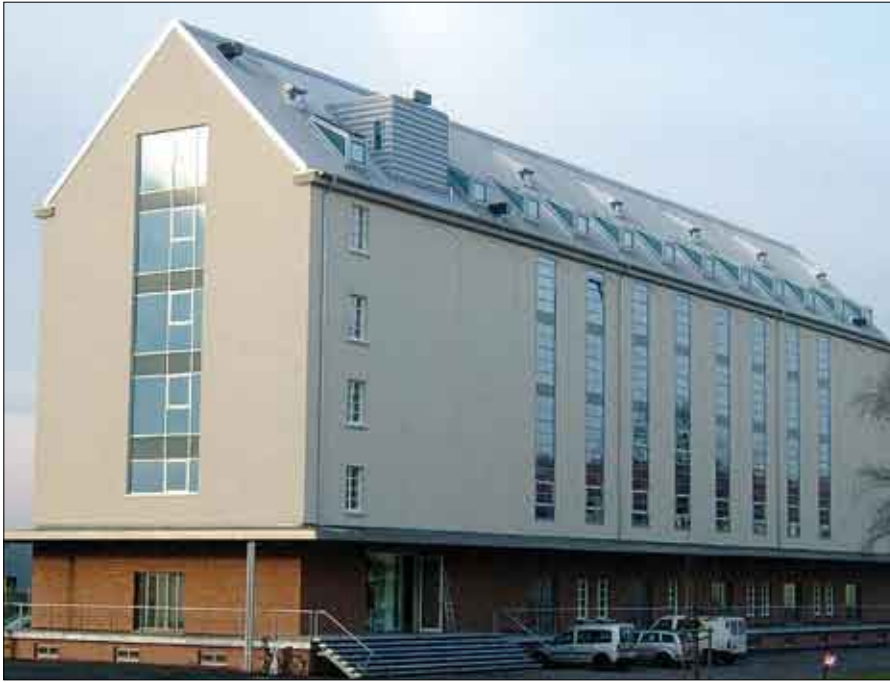
„An den Speichern 7“ war Teil des Heeresverpflegungshauptamtes.

gebaut. Von dort aus wurde die Armee im gesamten norddeutschen Raum mit Proviant versorgt. Tausende von Broten verließen die gigantische unzähligen Öfen tagtäglich. Angegriffen wurde das Gebäude-Ensemble im Krieg nicht. Beim Wiederaufbau nutzte die britische Rheinarmee die Anlage als Versorgungstützpunkt und Militärpolizei-Standort bis 1994. Dann stand alles drei Jahre leer. Bis die Westfälisch-Lippische Vermögensverwaltungsgesellschaft dieses gigantische Areal übernahm und später ein Nutzungskonzept für ein modernes Archiv- und Dienstleistungszentrum entwickelte – und umsetzte. Von den neun beeindruckenden Getreidespeichern ist nunmehr nur ein Speicher noch nicht modernisiert. Das lässt indes nicht mehr lange auf sich warten. Heute arbeiten und lernen dort 500 Menschen.