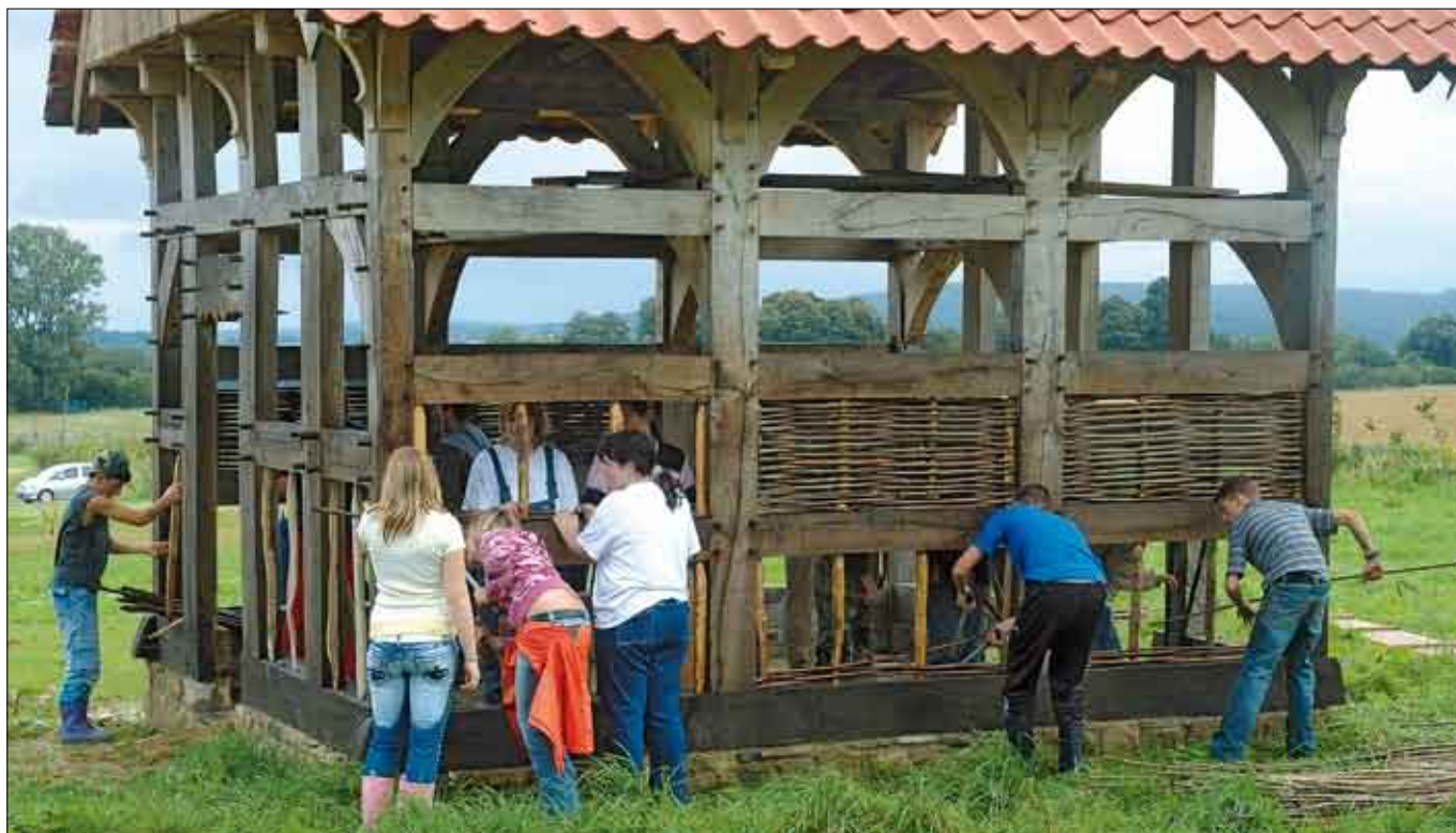
Schüler beim Flechten der Gefache, Backhaus (2006)