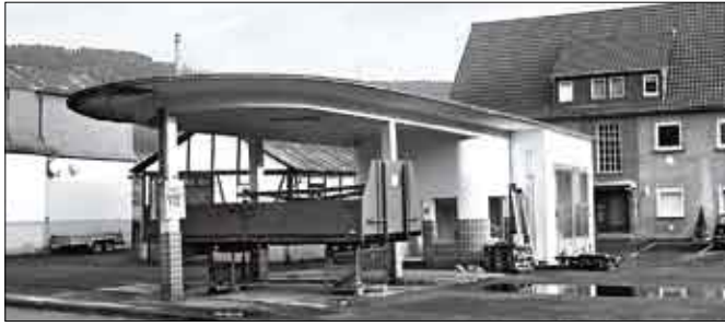
Tankstelle in Siegen von 1951 (Translozierung geplant)

Rasse. Seit dem Erwerb von zwei Zuchtstuten 2001 sind bereits sechs Fohlen im Museum geboren worden. Der inzwischen gegründete Verein zur Erhaltung der Senner hat zusammen mit dem Museum ein Netzwerk zur Weiterzucht gebildet. In einer historischen Scheune wird 2009 für diese seltenen Sennerpferde ein Stall eingerichtet, damit schon im kommenden Jahr Jungpferde von externen Pferdebesitzern dort überwintern können. Das Gebäude stammt aus dem Fundus von rund dreißig eingelagerten Gebäuden und fügt sich siedlungsgeografisch und zeitlich in die Baugruppe „Paderborner Dorf“ ein.