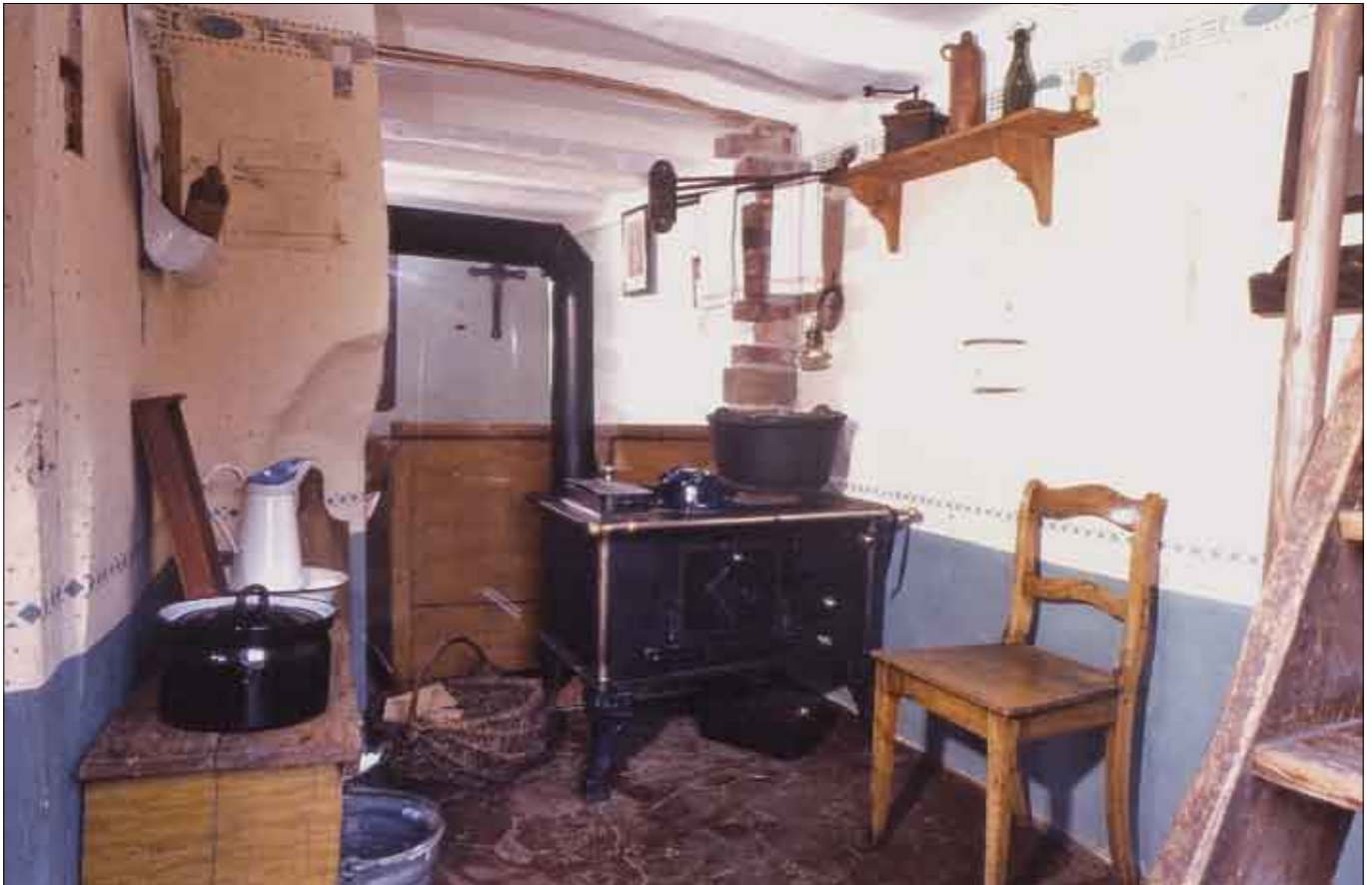
Tagelöhnerhaus aus Rösebeck, Flurküche mit Eisenherd

des Kirchhofes als Speichergebäude errichtet und seit dem späten 18. Jahrhundert als Wohnhaus genutzt.