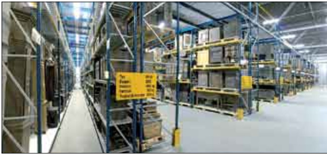
Blick ins Zentralmagazin (2003)

gutarchivs aus Jahrhunderten westfälischer Kulturgeschichte vom Spätmittelalter bis zur Gegenwart zu sammeln und für die Nachwelt zu bewahren. Die Detmolder Sammlung mit ihren ca. 300.000 Objekten wurde von Beginn an sehr breit angelegt und zählt heute zu den international bedeutenden, sehr gut dokumentierten Volkskundesammlungen in Europa.