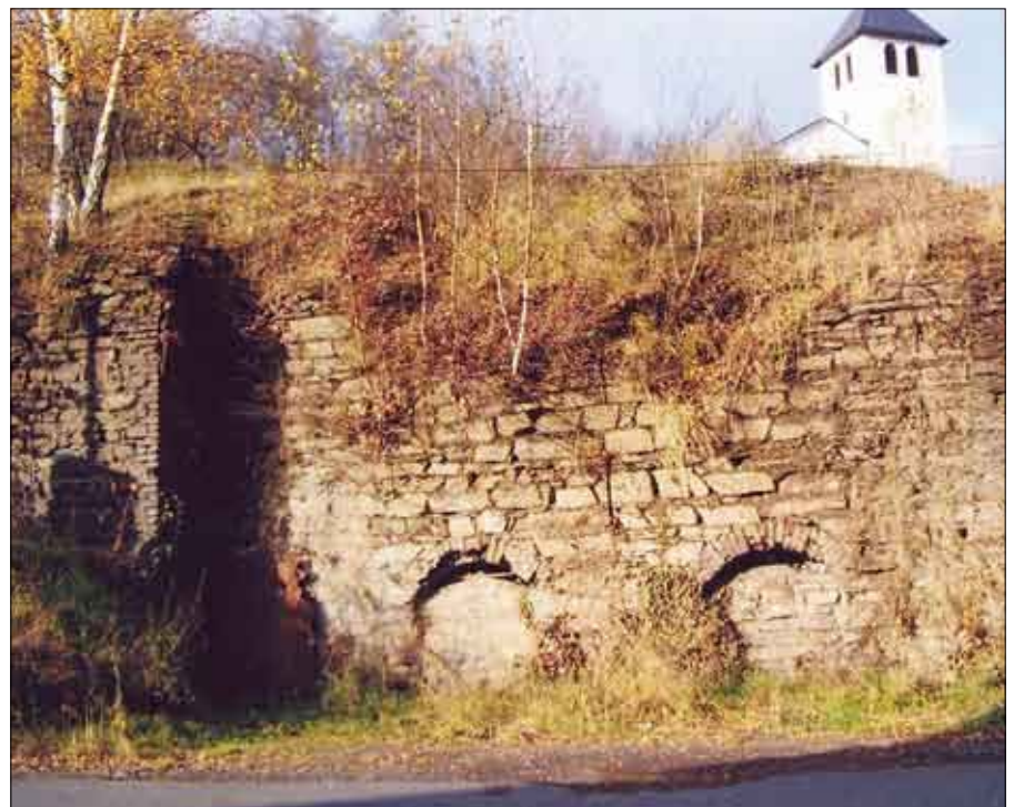
Keine gewöhnliche Stützmauer, sondern eine Röstofenanlage

Die in der Zeit von 1862 bis 1895 gebaute Anlage bestand ursprünglich aus 14 nebeneinander aufgereihten Öfen. Sichtbar geblieben ist ein Teil der An-