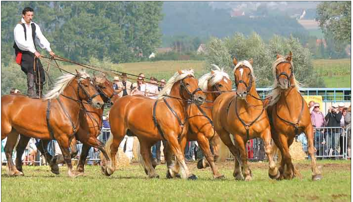
Großveranstaltung „PferdeStark“ (wieder im August 2009)

Detmold. Die Jahresthemen bieten Bezüge zu aktuellen gesellschaftlichen Fragen, geben den Schwerpunkt für das Jahresprogramm vor und beziehen die Dauerausstellung mit ein. Mit den Themenjahren wird das Museum zu einem Ort der Auseinandersetzung mit gesellschaftlich kontrovers diskutierten Fragen wie z.B. in diesem Jahr zur Migration.