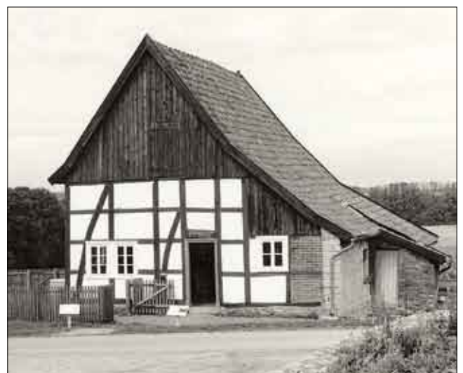
Tagelöhnerhaus von 1833 aus Vinsebeck

in der ehemaligen Stube begegnet man Masken auf einem Leuchttisch, der dem Raum Licht und Wärme gibt. Eintragungen im Gästebuch geben Auskunft: „Wir können hier wirklich zu Besinnung kommen“ oder „Es werden unglaublich viele Erinnerungen lebendig“ bis hin zu „Endlich ein Ort im Museum, der eine völlig freie gedankliche Entfaltung zulässt.“