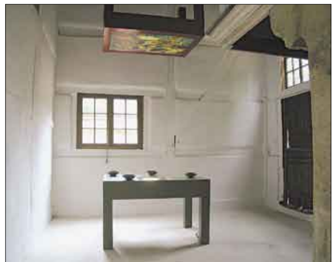
Armenhaus aus Rinkerode, Küche mit Installation (2005)

zu diesem Bautypus. Dieses Gebäude war 1825 errichtet worden und bot Platz für vier alte Frauen. Jede arme Frau, die Aufnahme gefunden hatte, bewohnte eine eigene Kammer. Sie waren angehalten sich gegenseitig zu helfen, diese Hilfe fand in der Gebrechlichkeit der Mitbewohnerinnen ihre Grenzen. Laut Stiftungsurkunde von 1628 waren die Bewohnerinnen verpflichtet, für den Stifter und seine Familie zu beten. Diese Hintergründe werden anhand von modern gestalteten Installationen im Gebäude für die Besucher verdeutlicht.