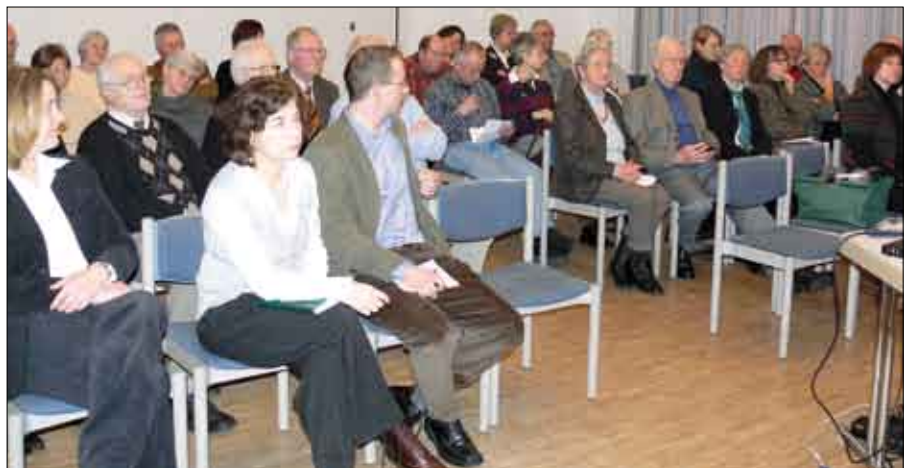
Aufmerksam verfolgt der Teilnehmerkreis die Vorträge