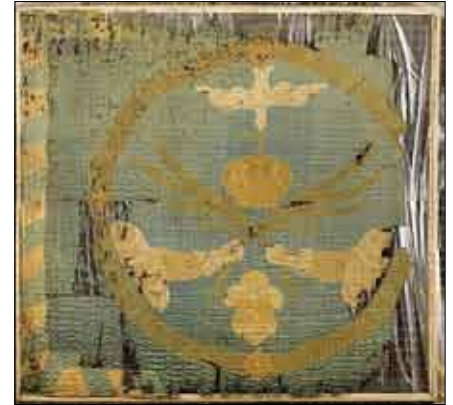
Original der Friedensfahne

fachliches Gutachten, Ergebnis: Eine Restaurierung wäre enorm aufwändig und unvorstellbar teuer.