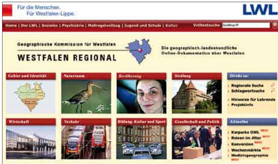
Die neue Startseite des Internetauftritts www.westfalen-regional.de