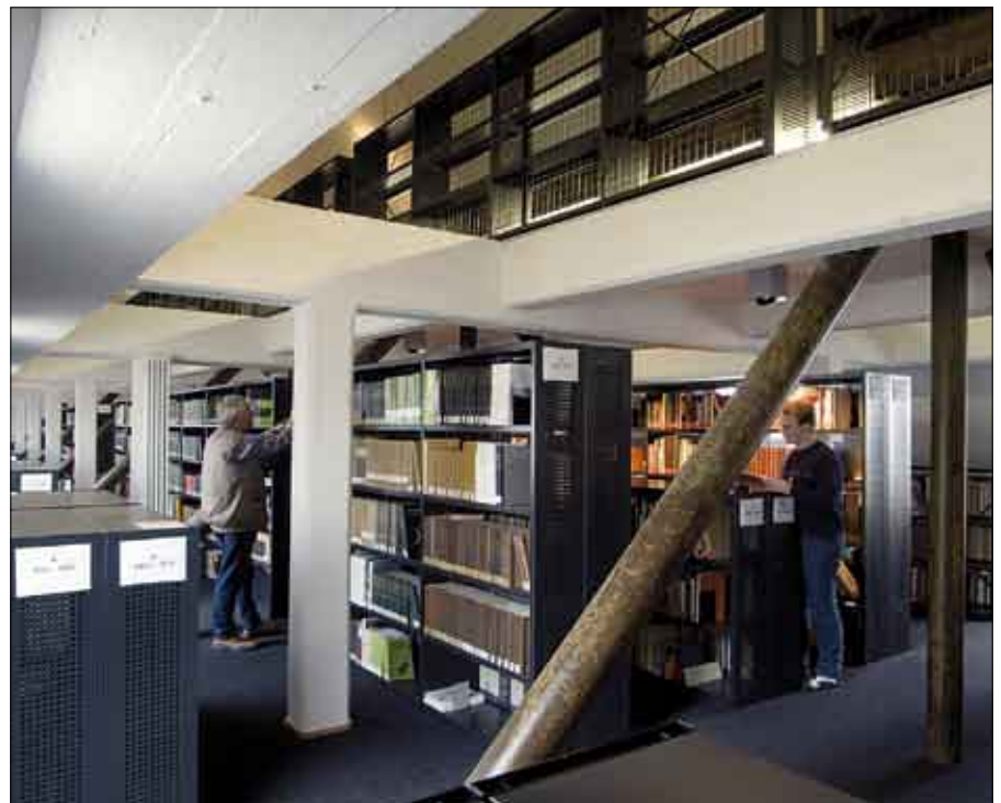
Schmuckstück in der Speicherstadt ist die Bibliothek