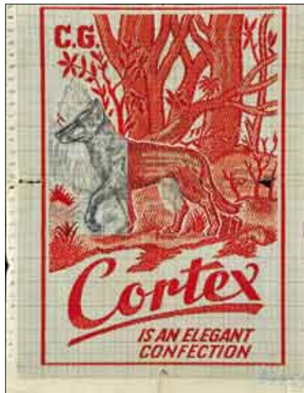
Entwurf eines Etiketts der Firma Neiss

Ergänzt wird die Ausstellung durch aktuelle Kunstwerke, die den heutigen Markenwahn thematisieren: Ganze Kleider aus Etiketten, Schmuckstücke,