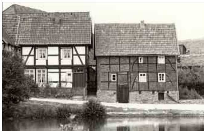
Tagelöhnerhäuser aus Rietberg und Rösebeck

allein die traditionelle bäuerliche Kultur Westfalens sollte im Mittelpunkt stehen, sondern es mussten zahlreiche andere Sozialschichten in die museale Darstellung einbezogen werden – vom besitzlosen Tagelöhner über den Handwerker und Dorfpfarrer bis zum wohlhabenden Branntweinbrenner. Zugleich wurden dem weiteren Ausbau des Museums auch neue, jüngere Zeithorizonte zu Grunde gelegt – vom ausgehenden 19. Jahrhundert bis an die Schwelle der Gegenwart.