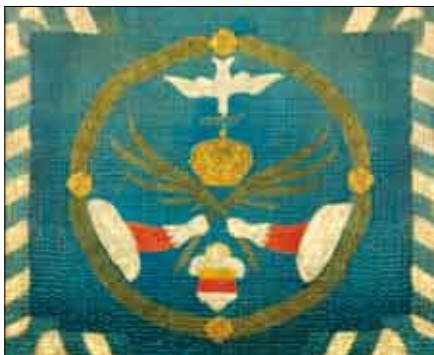
Die Replik der Friedensfahne

Als krönender Abschluss des Gedenkens an 360 Jahre Westfälischer Friede von Münster und Osnabrück im Jahre 2008 erinnert seit dem 10. Februar 2009 in der Bürgerhalle des Historischen Rathauses zu Münster (Westfalen) direkt neben dem Eingang zum Friedenssaal eine Replik der Friedensfahne von 1648 an dieses Jubiläumsjahr.