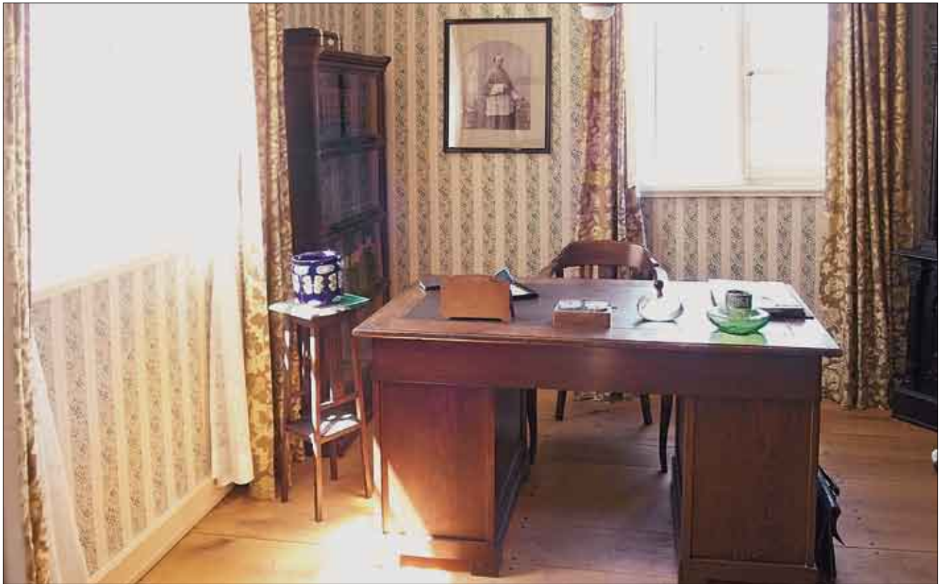
Pastorat aus Allagen, Amtszimmer des Pastors (2002)

Weitere Gebäude, die konzeptionell aktuelle Formen der Präsentation zeigen, sind: