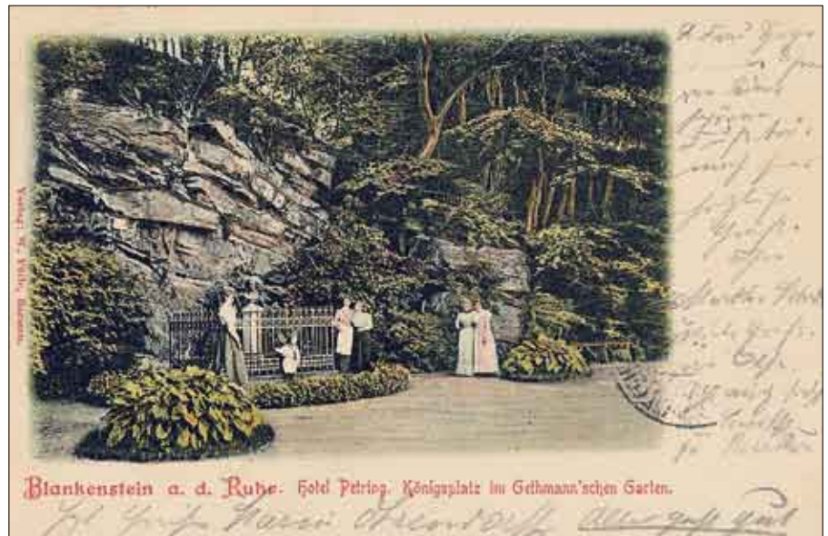
Königsplatz im Gethmannschen Garten 1901

Gute 80 Jahre blickte der König auf's Ruhrtal, dann, kurz nach Ende des 1. Weltkrieges im Jahre 1918 sollen, so wird berichtet, Wuppertaler Spartakisten die Büste von ihrem Platz genommen