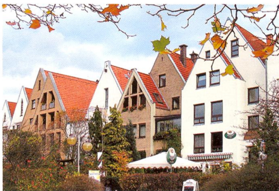
In der Altstadt von Bad Salzuflen orientieren sich die neuen Häuser an der historisch überlieferten Parzellenstruktur.

Djahanschah: Die westfälische Architektur gibt es nicht, sehr wohl aber westfälische Architekturen. Wir haben in Westfalen ganz unterschiedliche Kulturlandschaften mit unterschiedlich gepräg-