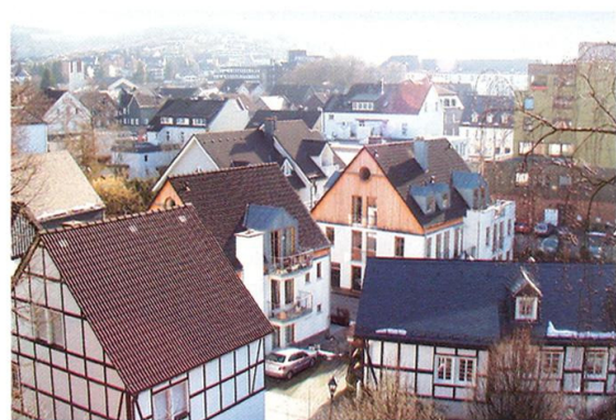
In Olpe passen sich die Neubauten trotz moderner Architektur hervorragend ins Stadtbild ein.