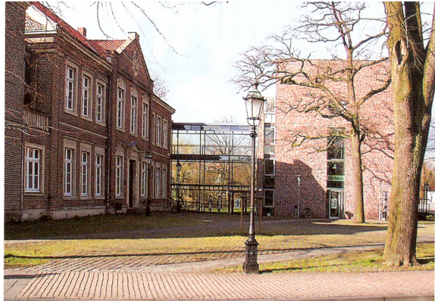
Regionale Verbindung durch die Verwendung des ortstypischen Klinkers: das Lüdinghausener Rathaus und sein moderner Anbau (Architekten: Pfeifer-Ellermann-Preckel, Lüdinghausen)

ten Siedlungsformen und Baustilen. Da gibt es das Münsterland mit den kompakten Hofstellen und Kleinstädten, das industriell geprägte Ruhrgebiet mit den typischen Arbeitersiedlungen oder das Sauerland mit dem schwarz-weißen Fachwerk und den Schieferdächern mit ihren knappen Dachüberständen. Das Sauerland beispielsweise verbindet man ganz klar mit den charakteristischen Materialien Holz, Schiefer, Lehm und Putz. Materialien, die den Menschen vor Ort auch schon vor 200 Jahren zur Verfügung gestanden haben.