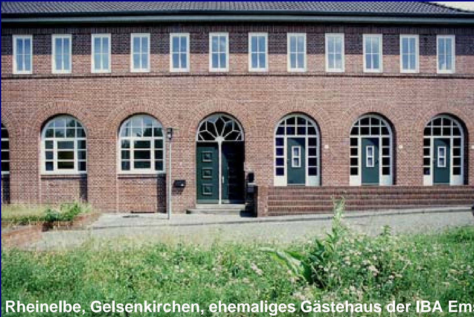
Rheinelbe, Gelsenkirchen, ehemaliges Gästehaus der IBA Emscherp