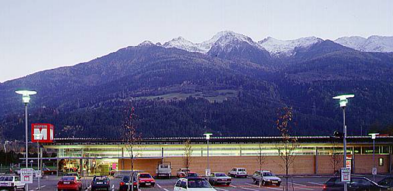
SUPERM TELFS WOLFGANG PÖSCHL + MARTIN BOTH