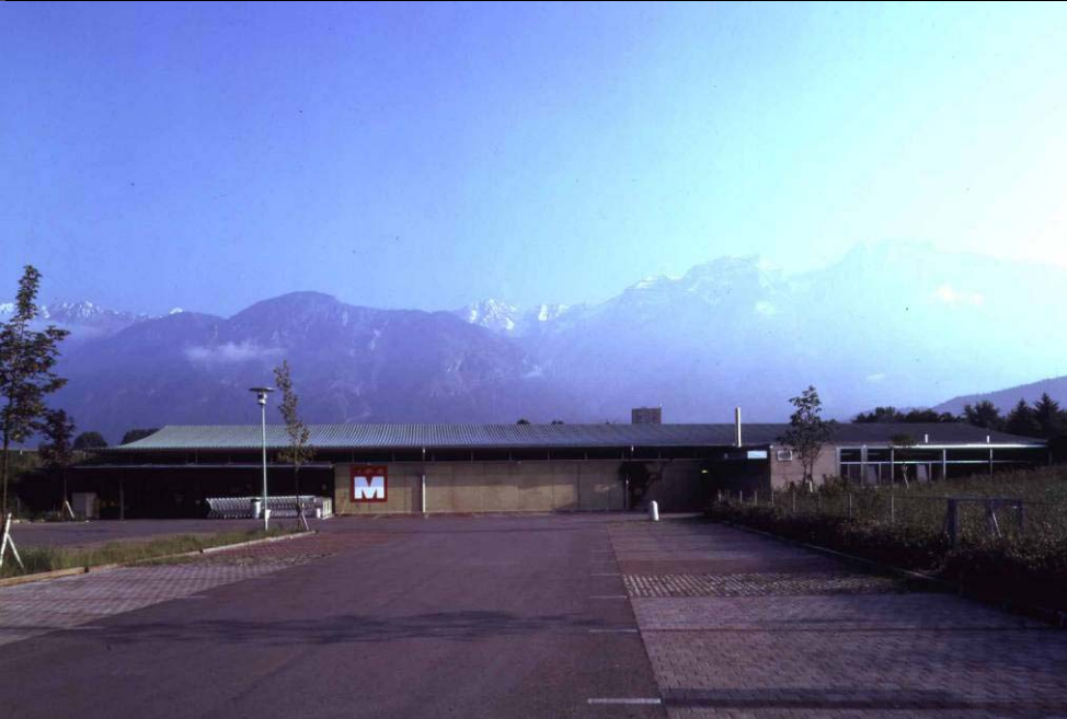
SUPERM HALL OST W. PÖSCHL + M.BOTH