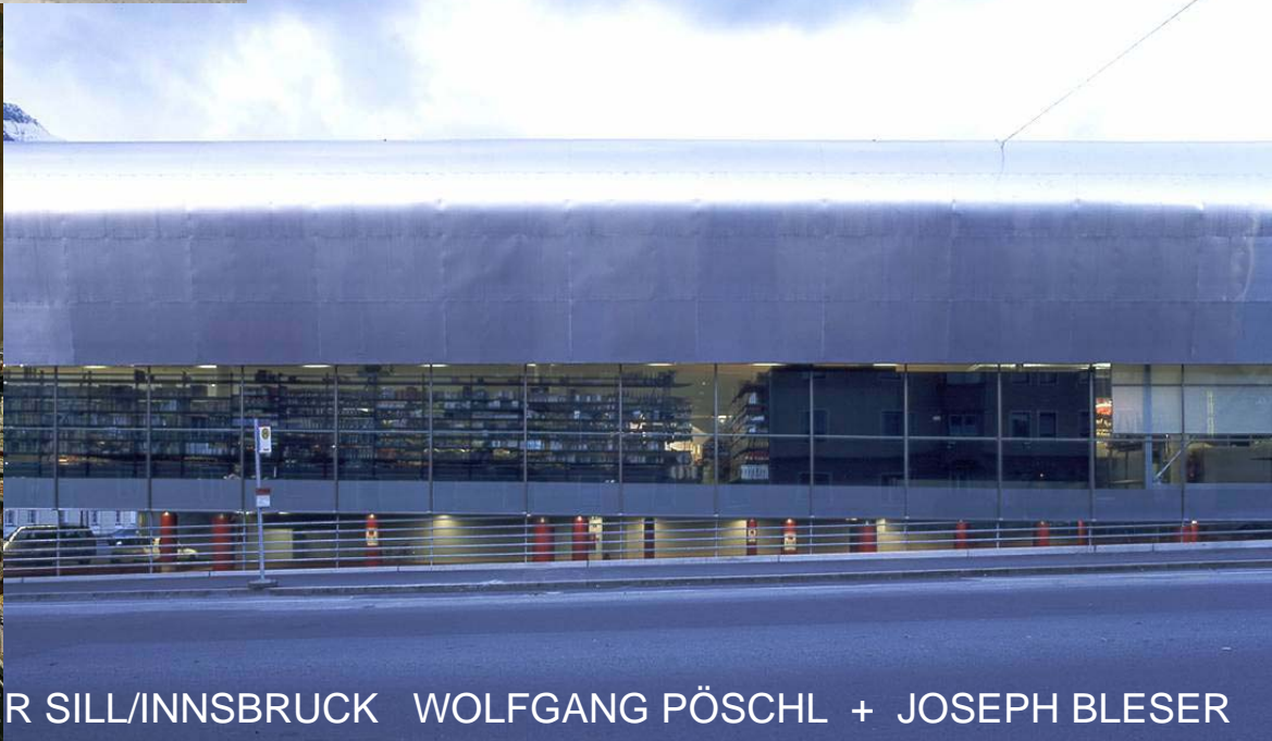
SUPERM AN DER SILL/INNSBRUCK WOLFGANG PÖSCHL + JOSEPH BLESER