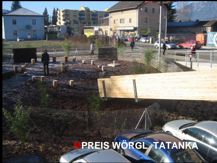
MPREIS WÖRGL TATANKA