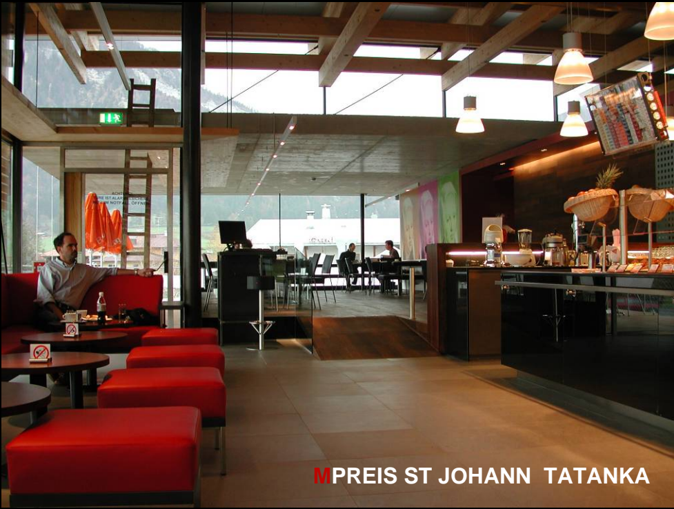
MPREIS ST JOHANN TATANKA