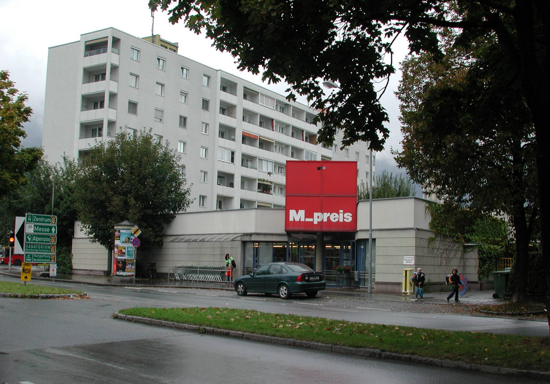
MPREIS ANDECHSSTRASSE/INNSBRUCK HEINZ PLANATSCHER