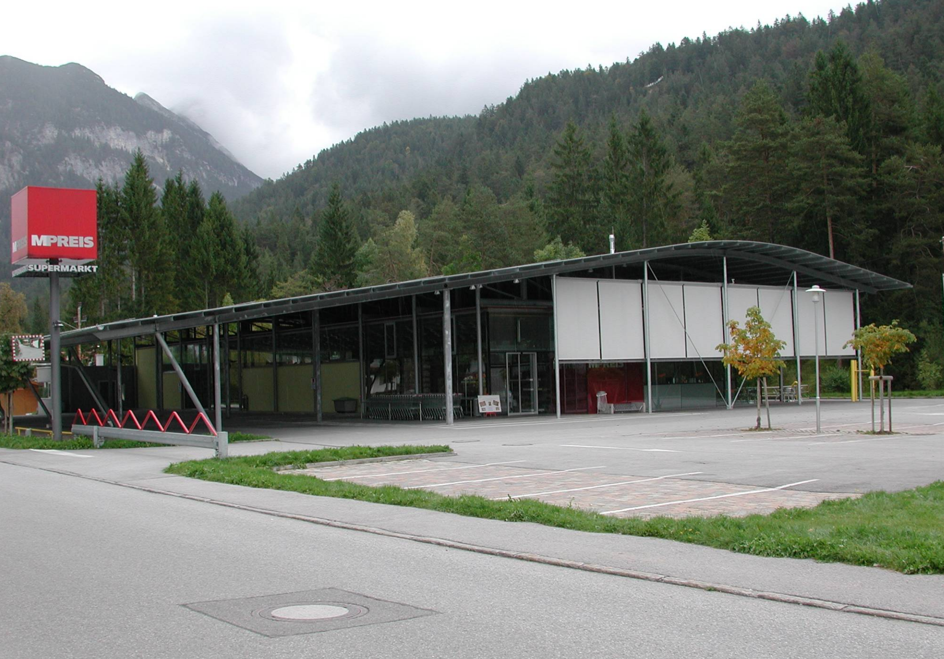
MPREIS LEUTASCH ERICH GUTMORGETH