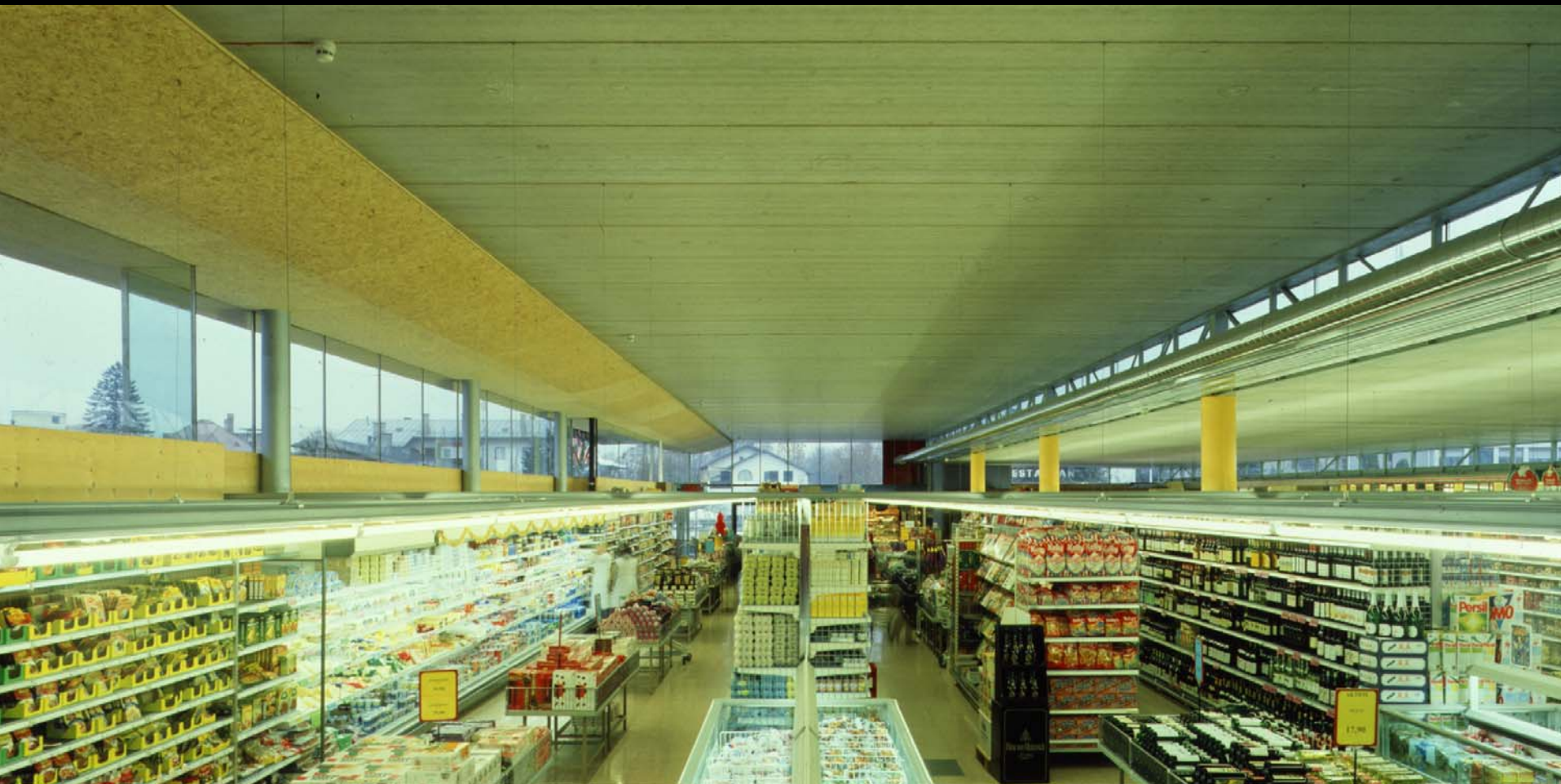
SUPERM TELFS WOLFGANG PÖSCHL + MARTIN BOTH