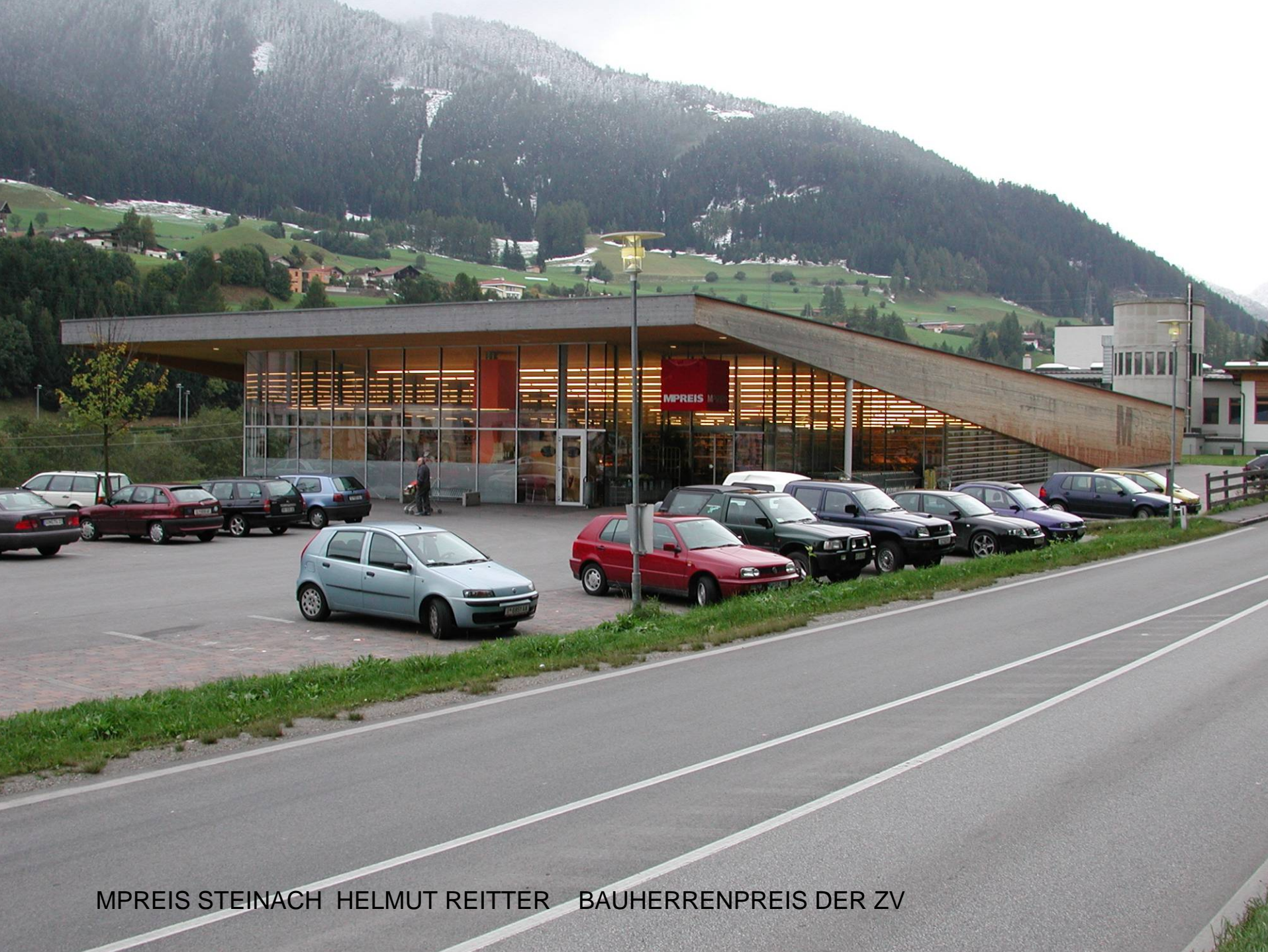
MPREIS STEINACH HELMUT REITTER BAUHERRENPREIS DER ZV