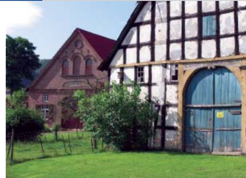
Regionale Baukultur des ländlichen Raumes im Mühlenkreis Minden-Lübbecke

Unter www.landschafts-und-baukultur.de werden rechtzeitig vor den Veranstaltungen nähere Infos bereitgestellt. Wenn Sie unseren eMail-Newsletter abonnieren, erhalten Sie automatisch eine Einladung.