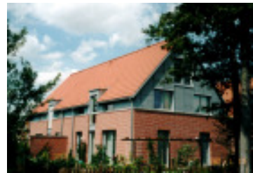
Alverskirchen 2003 Richter

Die gleiche Zielsetzung gilt auch bei städtebaulichen Entwürfen für Neubaugebiete oder kleinteiliges Brachflächenrecycling. Auch hier ist das intensive Auseinandersetzen mit der örtlichen Situation wichtig.