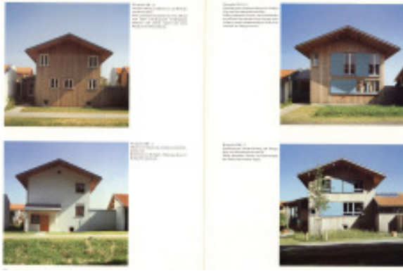
Tittmoning Oberbayern 2002 Landbrecht/Stadler