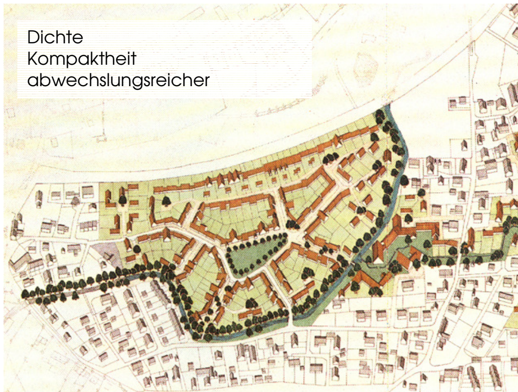
Deutscher Städtebau Preis Planungsgruppe SBS Moosburg Bayern 1990

Die gleiche Zielsetzung gilt auch bei städtebaulichen Entwürfen für Neubaugebiete oder kleinteiliges Brachflächenrecycling. Auch hier ist das intensive Auseinandersetzen mit der örtlichen Situation wichtig.