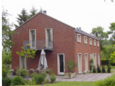
Münster 2002 Bastian