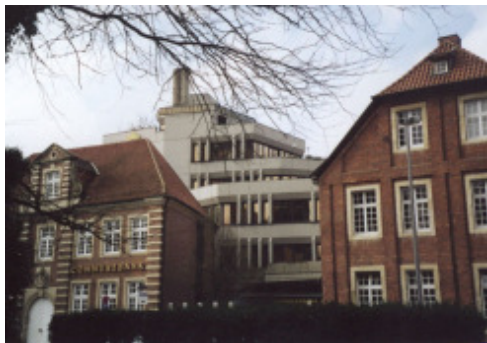
Behutsame Ergänzung ???

Leider ist die gedankenlose Duldung dieser Hässlichkeit zur Gewohnheit geworden, obwohl wir alle ein natürliches Empfinden für die harmonische Qualität der alten Städte und Dörfer besitzen. Nicht umsonst gehören intakte Stadtbilder zu den beliebtesten Freizeitzielen.