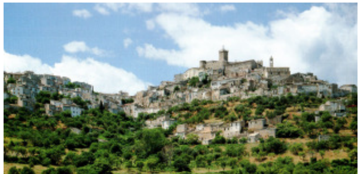
Symbiose von Stadt und Landschaft

Die Interessengemeinschaft Planen und Bauen in Westfalen hat sich zum Ziel gesetzt, auf die nachhaltige Qualität regionaler Gestaltungsmerkmale aufmerksam zu machen.