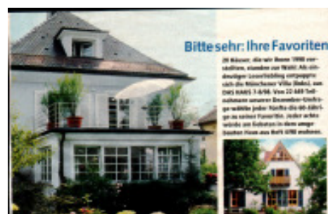
Das Haus 2000

Die Planer missachten dabei das Bedürfnis der Bürger nach einer gestalterischen Kontinuität ihres Umfeldes, die zwingend notwendig ist zur Schaffung einer emotionalen Identifikation. Selbst die eindeutigen Ergebnisse der zahlreichen Wettbewerbe zum „Traumhaus der Deutschen“ haben niemanden zu einem Umdenken bewegen können.