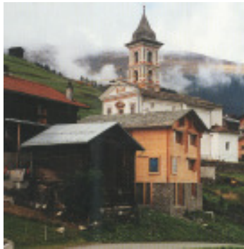
Vrin Allgäu 2000 Caminada