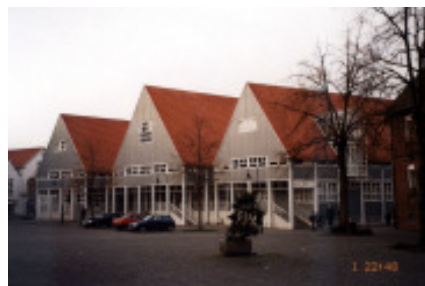
Rheda-Wiedenbrück Schürmann 82