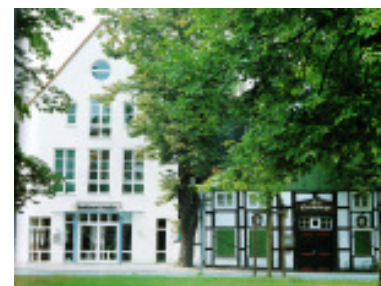
Gütersloh Schröder 1992