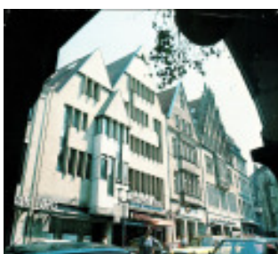
Münster Deilmann 1972

Dass diese Qualität planbar ist, beweisen einige Beispiele aus unserer Region, aber insbesondere aus dem süddeutschen Raum: