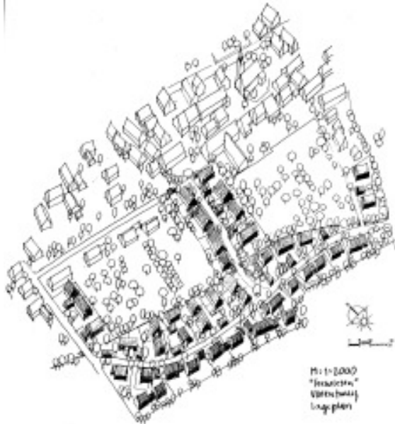
Dorfhauskonzept Württemberg 1988 Prof.Schmidt