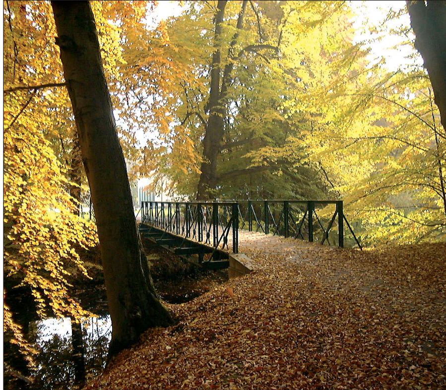
Abb. 2: Herbststimmung im Bagno am Schloss in Steinfurt-Burgsteinfurt

Erfassungskriterien waren, wie auch in den folgenden Projekten, die Bedeutung für die Regionalgeschichte, die Zuordnung zu einem geschichtlich oder kulturell wichtigen Bauwerk, die Repräsentanz für die Geschichte der Gartenkunst und Landschaftskultur, die Erholungs- und Freizeitfunktion der Anlagen, die touristische Bedeutung, der vegetationskundliche und dendrologische Wert, die visuelle und ästhetische Attraktivität, die Eignung und Nutzung für kulturelle Veranstaltungen sowie die Bezüge zur umgebenden Landschaft.