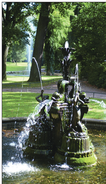
Abb. 1: Brunnenanlage im Palaisgarten Detmold

Im Rahmen der Regionale 2000/Expo-Initiative-OWL, gefördert mit Mitteln des Landes, konnten 206 Gärten und Parks in Ostwestfalen-Lippe ermittelt und in einer umfangreichen Dokumentation vorgestellt werden.