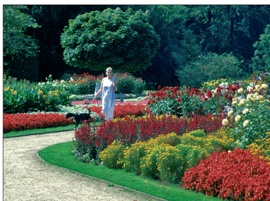
Abb. 5: Blumengarten im Botanischen Garten Gütersloh

Neben vielen fachlichen Gutachten und Hilfestellungen für die Gartenbesitzer