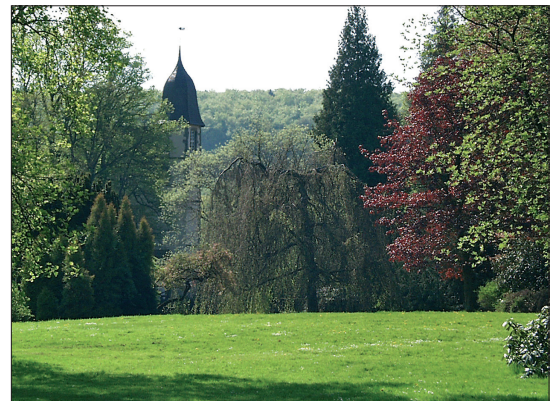
Abb. 2: Landschaftspark Wendlinghausen, Gemeinde Dörentrup