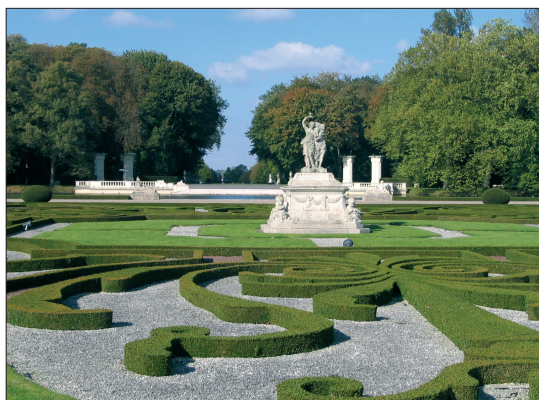
Abb. 4: Venusinsel auf der neobarocken Schlossanlage Nordkirchen

Auch nach Ende der EU-Förderung wird sich der Landschaftsverband für den Erhalt und die Entwicklung des gartenkulturellen Erbes in Westfalen-Lippe einsetzen und das Begonnene fortführen.