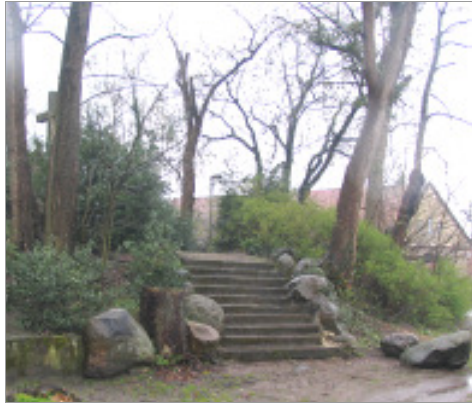
Zugang zur Anlage des „Kalvarienberg“ vom Parkplatz aus.

Der „Kalvarienberg“ ist sehr eng mit großkronigen Bäumen umstellt und teilweise haben deren Wurzeln zu Schäden an den Einfassungen des Hügels und den Treppenaufgängen geführt. Die Zugänglichkeit erfolgt nur über unbefestigte Wege, die nicht direkt in Verbindung mit den angrenzenden öffentlichen Wege- und Platzflächen stehen.