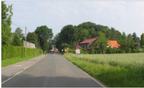
Südliche Ortseinfahrt „Dorfstraße“

Die jeweiligen Ortseinfahrten sind zurzeit weder durch eine Ortsrandbebauung noch in der Ortseinfahrtsituation besonders ausgebildet und im Übergang zwischen Landschaft und Dorf recht fließend. Besonders markante, dichte oder räumlich wirksame Bebauung ist nicht vorhanden, vielmehr legen sich einseitig am Straßenrand unauffällige, vereinzelt Gebäude vor die Ortsränder.