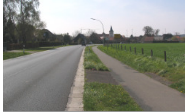
Nördliche Ortseinfahrt „Burgsteinfurter Straße“

Die südliche Ortseinfahrt über die „Dorfstraße“ verläuft geradlinig und eben entlang der westlichen recht hohen Abpflanzung des Sportgeländes und quert anschließend den kaum wahrnehmbaren Bachlauf des „Leerbach“. In der weiteren Fortführung zur Ortsmitte wird der Straßenraum bis zum „Naher Weg“ und dem „Kalvarienberg“ östlich von einer Fläche mit hochstämmigem Baumbestand des ehemaligen Gräftenhofes „Schulze Schleithoff“ und westlich von einer ca. 2,50 m hohen, dichten Schmitthecke gesäumt. Die Fahrbahnbreite in diesem Bereich liegt im Mittel bei ca. 7,50 m und bietet zusätzlich auf der Ostseite einen ca. 2,00 m breiten Mehrzweckstreifen. Der Fußweg auf der Westseite ist mit ca. 3,00 m verhältnismäßig breit angelegt. Innerhalb der Fahrbahn teilt eine aufgesetzte mit Warn- und Verkehrszeichen versehene Querungshilfe die Fahrspur.