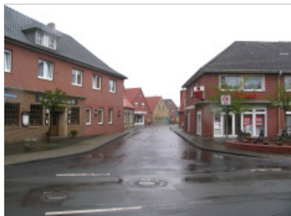
Einmündung der „Schorlemer Straße“ in die „Dorfstraße“.