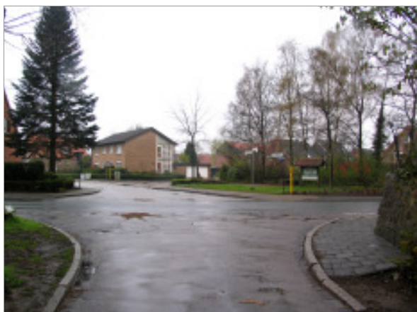
Kreuzungsbereich der „Dorfstraße“ mit „Naher Weg“ und der Straße „Am Bach“.

Überwiegend sind die Einmündungsbereiche der Seitenstraßen in die Ortsdurchfahrt zu Lasten der Bürgersteigbereiche sehr überdimensioniert aufgeweitet. Gleichwohl ist zu beobachten, dass die Abbiegevorgänge aus den Seitenstraßen wegen der Sichtverhältnisse nur unter Inanspruchnahme der gesamten Fahrbahnbreite der Ortsdurchfahrt erfolgen. Auf Grund der relativ geringen Verkehrsbelastung kommt es jedoch nur vereinzelt zu Begegnungssituationen zwischen größeren Kraftfahrzeugen, Lkws oder landwirtschaftlichen Maschinen.