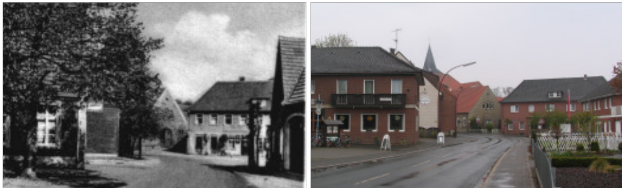
Die Situation der Straßeneinmündung „Schorlemer Straße“ in die „Dorfstraße“ aus südlicher Richtung.

Zur Wahrung der erhaltenswerten Eigenart der Dorfstraße im Ortsteil Leer wurde bereits die Wichtigkeit der städtebaulichen Situation von der Einmündung der „Schorlemer Straße“ bis zur Einmündung „Burgsteinfurter Straße“ durch einen Satzungsbeschluss der Stadt Horstmar im Jahre 1979 sichergestellt. Danach können im Geltungsbereich der Satzung, abweichend von den Vorschriften der Landesbauordnung, die dort vorgeschriebenen Maße für Bauwiche und Abstandsflächen unterschritten werden.