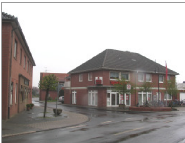
Straßeneinmündung „Schorlemer Straße“ in die „Dorfstraße“

Die sehr weit ausgebildeten Straßeneinmündungen lassen die seitlichen Randbereiche zu äußerst engen Restflächen verkümmern und heben die Bedeutung der Straße hervor.