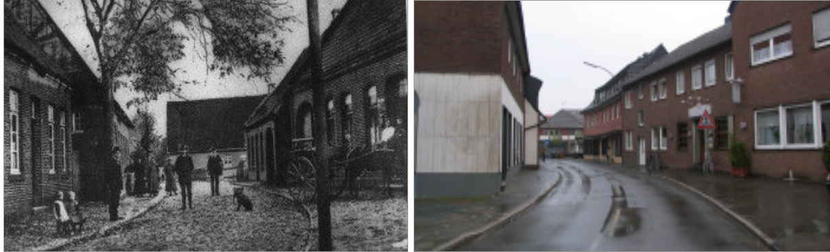
Die „Dorfstraße“ im Bereich der Straßeneinmündung „Zum Esch“ mit Blick in südöstlicher Richtung.

Eine Auswertung und Gegenüberstellung historischer und aktueller Fotos belegt, dass die Straßenführung der Ortsdurchfahrt auf Grund der historischen städtebaulichen Anordnung weitgehend erhalten geblieben ist. Einige Häuser entlang der Dorfstraße zeigen heute noch ablesbar die Struktur ehemaliger „Ackerbürgerhäuser“, die allerdings ab den 60er Jahren des 20. Jahrhunderts so stark umgebaut wurden, dass das ursprüngliche Erscheinungsbild kaum mehr zu erkennen ist.