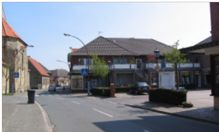
Situation Dorfmitte an der Kirche

Der Fußgängerquerungsschwerpunkt – Zebrastreifen im Bereich „Kirchplatz“ / „Geschwister-Buller-Straße“ – ist schwer erkennbar und z.T. nicht ausreichend dimensioniert. So liegt die Zugänglichkeit nicht in der direkten Wegebeziehung und die notwendigen Aufstellflächen für Fußgänger sind daher auch äußerst beengt. Insbesondere die nur in einem kurzen Abschnitt der „Dorfstraße“ einsehbare Situation der Querungsstelle erschwert die Wahrnehmung in der Sichtbeziehung zwischen Fahrzeugführer und Fußgängern.