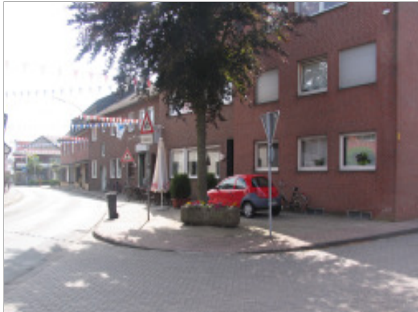
Straßeneinmündung „Zum Esch“ in die „Dorfstraße“

Neugestaltung der Ortsdurchfahrt - Planungskonzept -