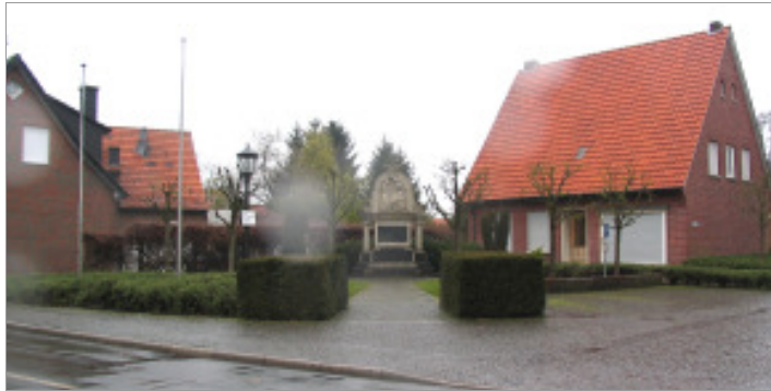
Ehrenmal am Kirchplatz

Neugestaltung der Ortsdurchfahrt - Planungskonzept -