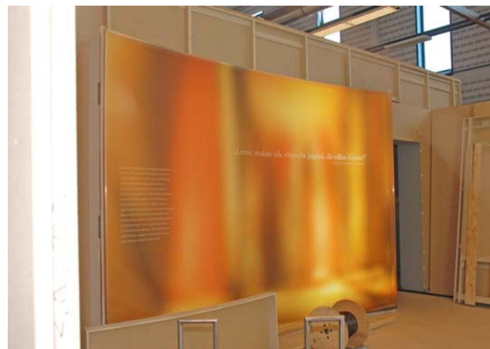
Arbeit unter Hochdruck: Ab Anfang Mai sollen die Exponate in die dann bezugsfertigen Ausstellungsräume.

Im Nebenraum fallen entlang der Lippe die Römer in Germanien ein. Den Feldzügen des Drusus folgt eine überwiegend friedliche Zeit, die mit der Varusschlacht ein abruptes Ende nimmt. Zum Schluss der Ausstellung befindet sich der Besucher direkt am Rhein. Auf der einen Seite die dichten dunklen Wälder Germaniens, auf der anderen das aufgehende Licht der römischen Kultur, die sich entwickelnde Zivilisation der linksrheinischen Gebiete.