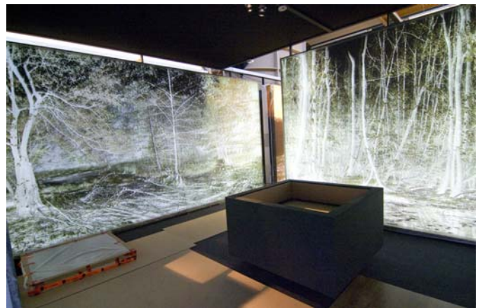
Lichtbildwände: Die Wälder Germaniens.

"Toll, einen so großen leeren Raum ausbauen zu dürfen", sagt Jochen Hähnel über die Aufgabe. Auf 1000 Quadratmetern Ausstellungsfläche gebe es einfach sehr viele Möglichkeiten. Zunächst kam es aber darauf an, die richtigen Voraussetzungen zu schaffen. Das bedeutete beispielsweise, eine spezielle Klimaanlage zu installieren, alle Fenster mit Sonnenschutzfolie zu bekleben und den Fußboden neu zu beschichten.