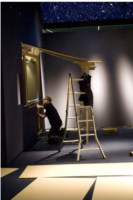
Vorbereitungen unter dem Sternenhimmel 9 v. Chr.: In den Wandschaukästen erwacht die Architektur des antiken Roms zum Leben.

Ab Anfang Mai werden die Exponate angeliefert. "Dann herrscht hier eine enorme Sprachenvielfalt", sagt Jochen Hähnel und spielt auf die Kuriere an, die unter anderem von Italien, Bulgarien, Rumänien, der Türkei und Israel aus ihre Leihgaben nach Haltern begleiten. Knapp 60 freistehende Vitrinen und noch wesentlich mehr Wandschaukästen warten bereits auf die antiken Exponate.