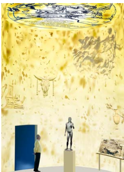
Bronzestatue des Apollo aus Pompeji im Ausstellungsraum zum „Goldenen Zeitalter“.

Die Togastatue eines Jungen aus Ostia steht in der Ausstellung „IMPERIUM“ für den Varus in seiner Kindheit. Sie stellt einen jugendlichen Römer dar, der aus einer vornehmen Familie stammt, worauf Toga und Patrizierschuhe hinweisen. Wie bei jungen, frei geborenen Römern üblich trägt er einen Anhänger, eine Bulla, um den Hals, die ihn während der schutzbedürftigen Kindheit vor Unheil bewahren soll. Der zylindrische Buchrollenbehälter (capsa) neben ihm verweist auf die Bildung des Jungen.