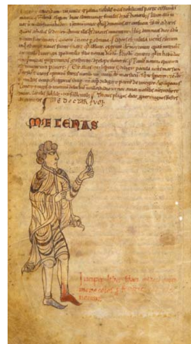
Auszug aus Horaz' „Carmen saeculare“.

Den Anbruch der neuen Epoche verkündet Augustus 17 v. Chr., als ein Komet am Himmel erscheint. Mehrtägige Feierlichkeiten heißen das neue Zeitalter willkommen. Der Herrscher lässt Horaz zu diesem Anlass ein Preisgedicht – das „Carmen saeculare“ – verfassen, in dem der Autor die Fruchtbarkeit und Fülle bringende Glückszeit mit den wiederkehrenden republikanischen Tugenden verbindet.