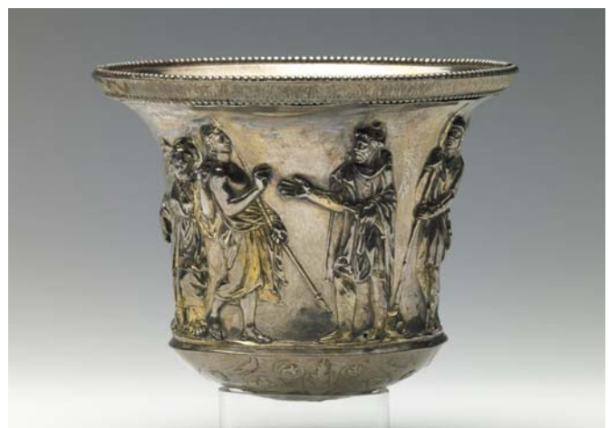
So genannter Chryses-Becher: Silberbecher mit mythologischen Darstellungen. Chryses war ein Priester des Apollon in der römischen Mythologie.