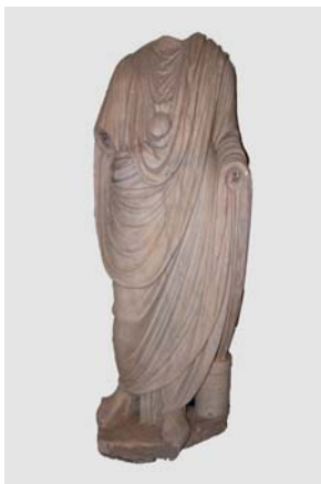
Togatus eines Jungen aus Ostia.