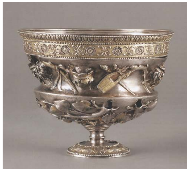
Silberbecher mit dionysischen Szenen.

Auch wenn Augustus einen starken Einfluss auf das künstlerische Schaffen seiner Zeit ausübt, begnügen sich die Dichter und bildenden Künstler des Goldenen Zeitalters nicht damit, politisch vermittelte Ideen nur aufzugreifen und zu verarbeiten. Durch ihre Werke wirken sie stattdessen daran mit, dass ein neues römisches Weltbild und ein neues Selbstbewusstsein entstehen können. Die Leitlinien der augusteischen Erneuerung formulieren die Künstler übereinstimmend mit dem politischen Willen des Herrschers, sie veranschaulichen diese Ideen, wandeln sie aber auch ab.