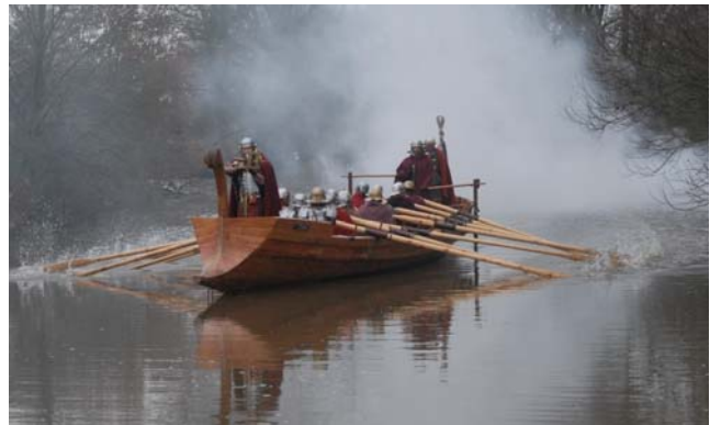
Schützender Begleiter: Schiffe wie die „Victoria“ begleiteten die militärischen und zivilen Transporter auf den germanischen Flüssen.

Pressekontakt: Martin Holzhaus, LWL-Pressestelle, Telefon: 0251 591-235, presse@lwl.org