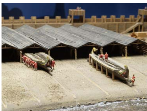
Anlaufpunkt für römische Schiffe: Forscher wiesen durch archäologische Untersuchungen in Haltern am See auch Schiffshäuser (hier im Modell) nach, die zumindest als Reparatur- und Lagerstätten dienen.