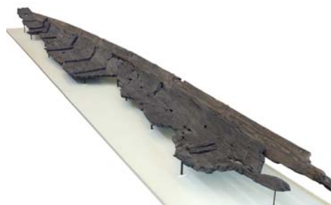
Wrack eines römischen Lastschiffes aus dem Militärlager Zwammerdam.

Haltern (lwl). Fünf Tonnen Getreide pro Tag – so viel benötigten die Soldaten einer römischen Legion vor 2.000 Jahren. Diese Menge ließ sich in Germanien nicht ohne Weiteres auftreiben. Das LWL-Römermuseum in Haltern am See zeigt in seiner neuen Ausstellung „IMPERIUM“ (16.5.-11.10), wie die Legionäre zu ihrem Proviant kamen: Am Mittwoch (29.4.) erreichte das Wrack eines römischen Lastschiffes aus dem niederländischen Lelystad das Römermuseum des Landschaftsverbandes Westfalen-Lippe (LWL).